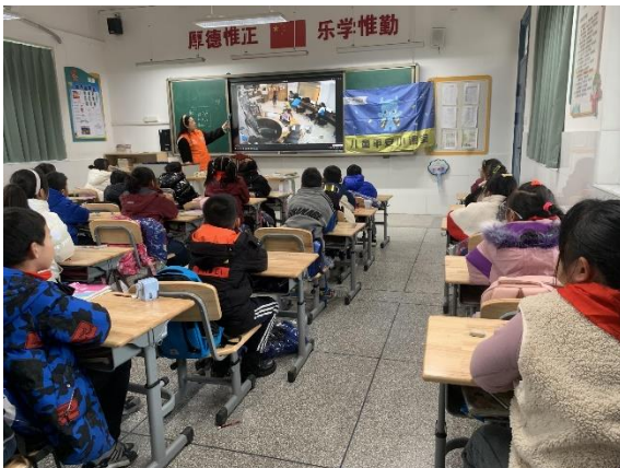
图 3 同学们在上地震安全课程 项目学校：南京市高淳区古柏中心小学 执行机构：南京市高淳区淳青青少年服务中心