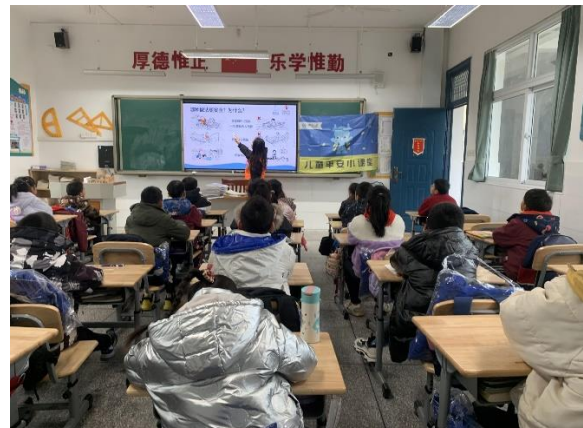
图 4 同学们在上防溺水课程 项目学校：南京市高淳区古柏中心小学 执行机构：南京市高淳区淳青青少年服务中心