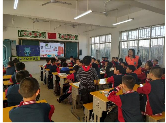
图 2 同学们在上消防安全课程 项目学校：浩口第三小 执行机构：潜江市义工联合会