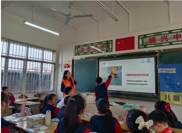
图 1 同学们在上交通安全课程 项目学校：浩口第三小 执行机构：潜江市义工联合会