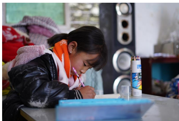
独自写作业的孩子

孩子们也已经放了寒假，而忙于生计和灾后重建的家长如何安顿孩子们的漫长假期显得有些力不从心。孩子们在社区安置点无所事事，不仅增加了安全风险，也消耗着他们美好的童年时光。