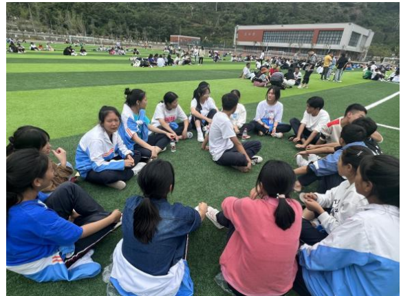
开展心理支持活动