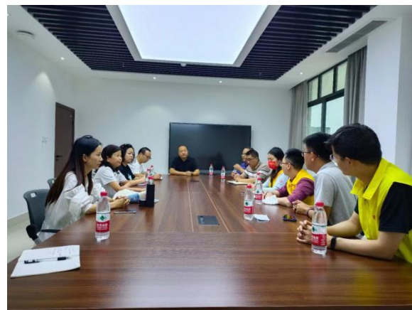
与石棉县教育局沟通