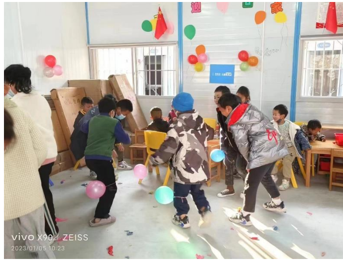
物资进站以及玩耍的孩子

12月以来，5个站点已陆续开展家庭入户走访、儿童服务站社区空间搭建等工作内容，并已开展多场活动。其中在得妥镇的繁荣安置点，居住着泸定地震受灾严重各个村的安置居民，安置点安排了最大的一间活动板房用于开展儿童服务活动。