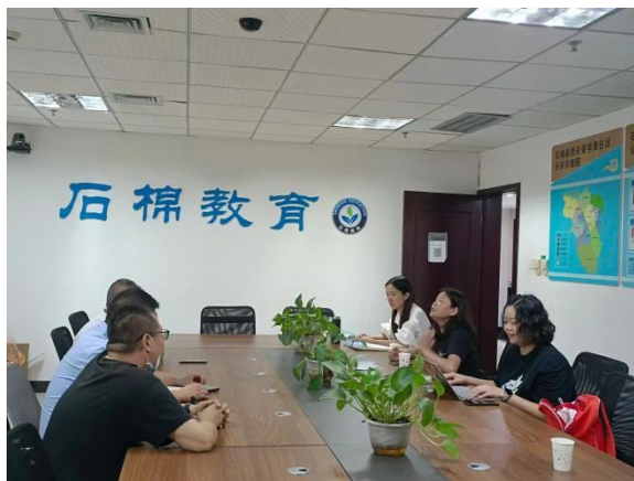
与石棉县教育局沟通

2015 年—2018 年，雅安市石棉县开展 3 年减灾示范校园项目，14 所项目学校在儿童安全教育、校园风险管理、教师能力建设、校园安全文化方面有相应的经验积累。泸定 6.8 级地震发生后有序避险逃生，全县无师生伤亡。在调研中，学校、教育局/教师说到“在石棉县学校 98% 以上的学校没有校医生，在紧急情况发生时，不能及时应对，希望能够加强教师在应急技能和安全教育授课能力方面的培训，全面提高教师群体在面对突发状况时的应急能力和日常安全教育的有效性。