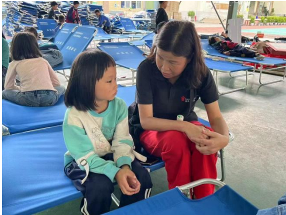
与学生沟通灾后生活

在灾害发生时，父母或者教师可能会没有第一时间出现在孩子身边，为培养和激发儿童参与安全教育的积极性，增强自身面对灾害的自我保护能力，调研中与教育局达成共识：开展以儿童为中心活动，如：儿童安全小组，生存训练营活动，先进行尝试，在通过以点带面在全县范围内进行推广和运用。