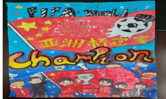
学生们的绘画作品