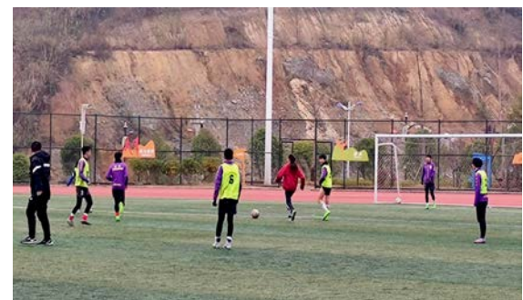
大方第七中学日常训练对抗赛