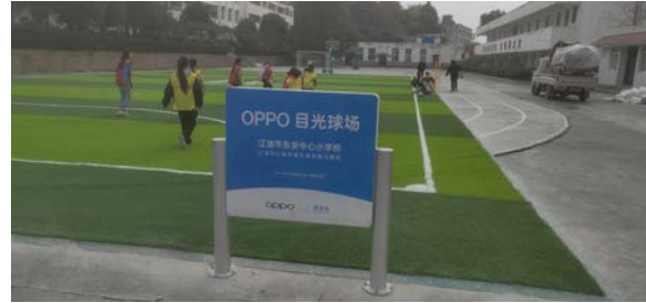
东安中心小学女足在建成的球场上开展训练