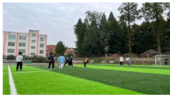
右图：马岭初级中学七年级足球赛