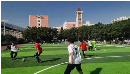
左图：白鹤荆州学校师生友谊赛

县域青少年足球公益项目由中国足球发展基金会专项支持，计划 2022 年在四川雅安建成【8】座足球场，支持【8】个县【99】所乡村学校足球队组建及教师培训、比赛等活动，目前【8】座球场已交付完成，并在学校体育活动中投入使用。12 月，汉源县白鹤荆州学校和马岭镇初级中学【2】所项目校举行了校内足球比赛。