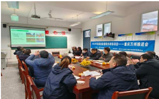
左图：项目推进会现场

12月7日，重庆万州项目组工作人员召开了项目推进会，10所学校的校长和体育老师参加，推进会上具体介绍了项目内容，共同讨论了项目后续工作计划。