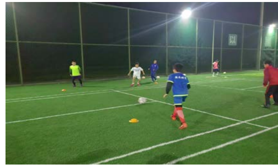
右图：龙沙小学球队日常训练