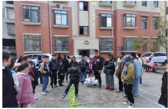
右图：荣丁小学体能训练