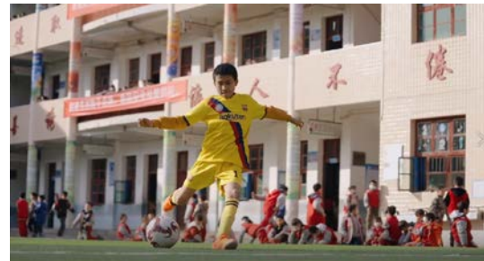
衙前中心小学球场已建设完成并投入使用