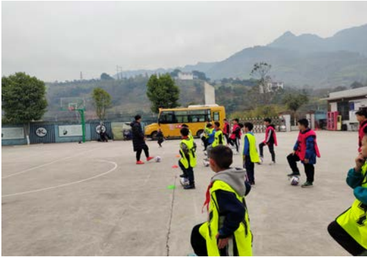
左图：劳动镇中心校足球训练