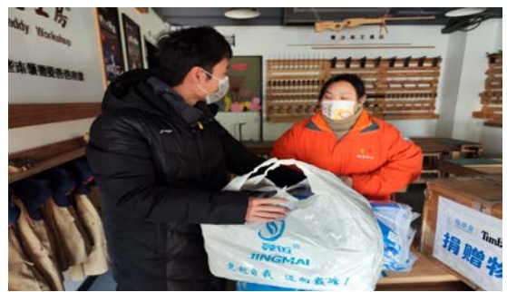
工作人员走访项目学校并分发物资