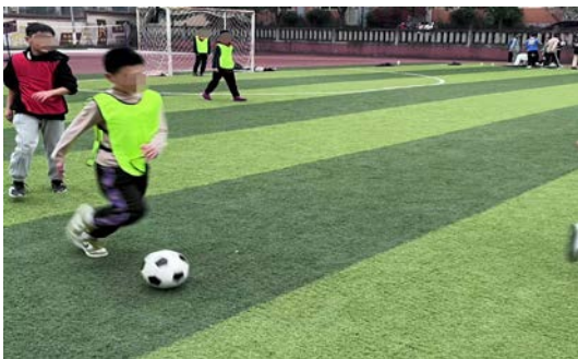
左图：弹子学校球队日常训练