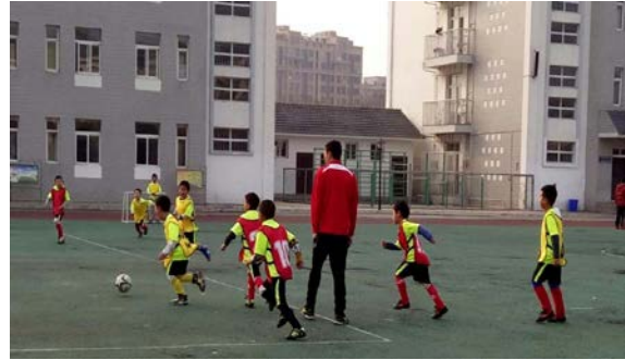
项目校日常足球训练和比赛