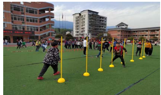
右图：分水中心小学球队日常训练