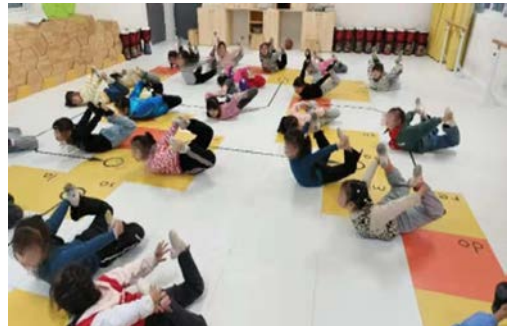
孩子们在教室里上舞蹈课