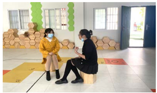
项目执行人员与音乐老师沟通教室使用事宜