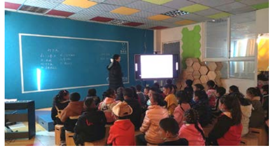
康定音乐教室日常教学