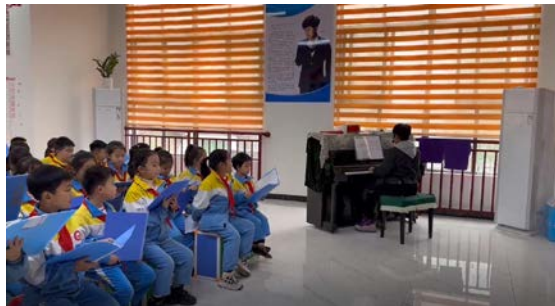
合唱兴趣班里，老师带着学生们在熟悉乐谱

11月5日，项目召开了“壹彩虹2022年全体教师会议”，通过线上会议让各项目校老师更加了解项目内容和目标。本月，项目组已完成专家指导团队组建工作，正式启动为期【20】期的“乘着歌声的翅膀-少数民族乡村少儿合唱教育”年度教师培训课程，目前已开展【3】期线上培训活动，内容包含音程训练、信息化助力音乐教学等，参与教师达43余人次，老师们将把培训中所学到的内容运用到合唱团学习和排练中。