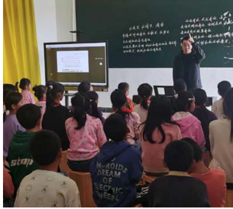
项目校日常合唱排练