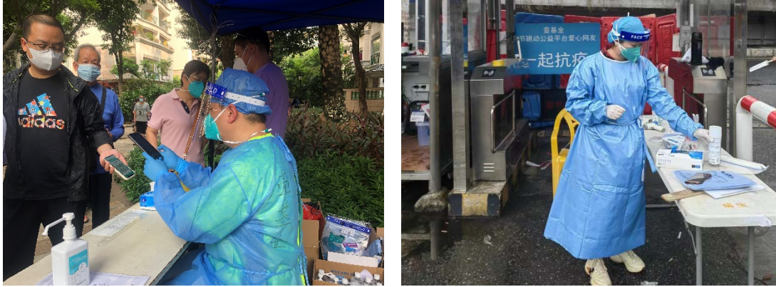
上图：壹基金联合救灾项目河南伙伴在海珠区开展协助社区开展全民核酸检测工作

壹基金针对广东疫情开展抗疫行动，参与的社会组织 2 家，向广州市海珠区发放隔离衣 2000 件、医用手套 4500 双、医用隔离面罩 1500 个。