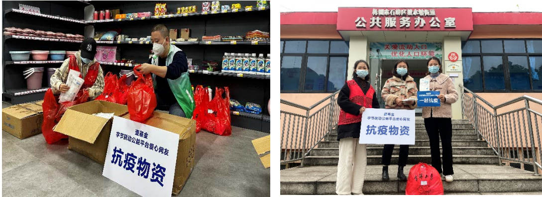
上图：壹基金联合救灾项目湖南伙伴分装及发放防疫物资

壹基金针对湖南疫情开展抗疫行动，参与的社会组织 2 家，向株洲市石峰区发放 N95 口罩 12000 只。