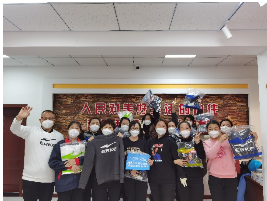
上图：11 月 4 日，壹基金联合救灾项目吉林伙伴在南关区、二道区、绿园区等社区发放鸿星尔克衣服