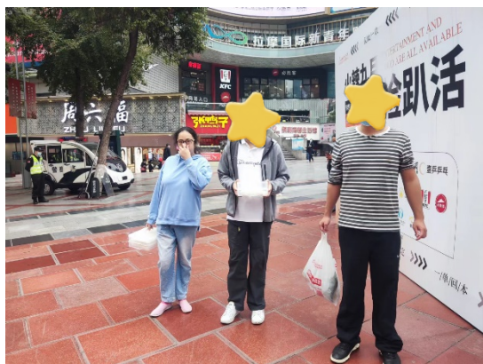
自主生活活动现场