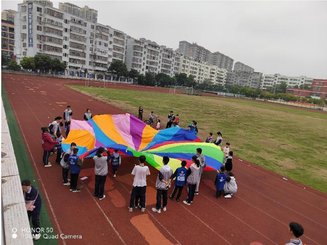
融合喘息活动现场