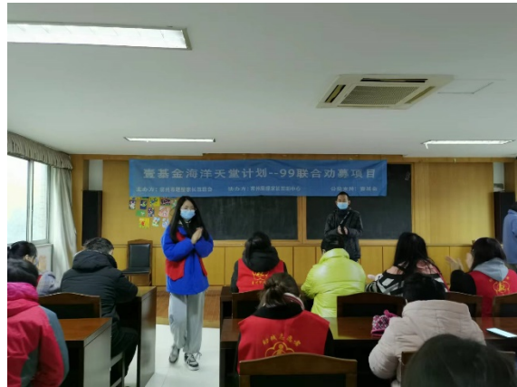
志愿者和心智障碍者互帮互助