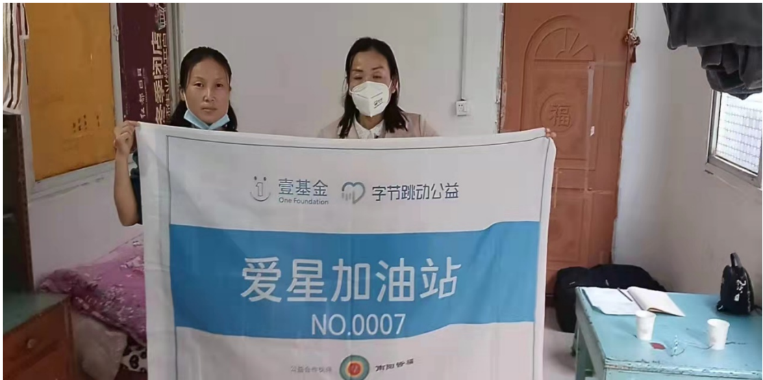
探访人员与家长见面