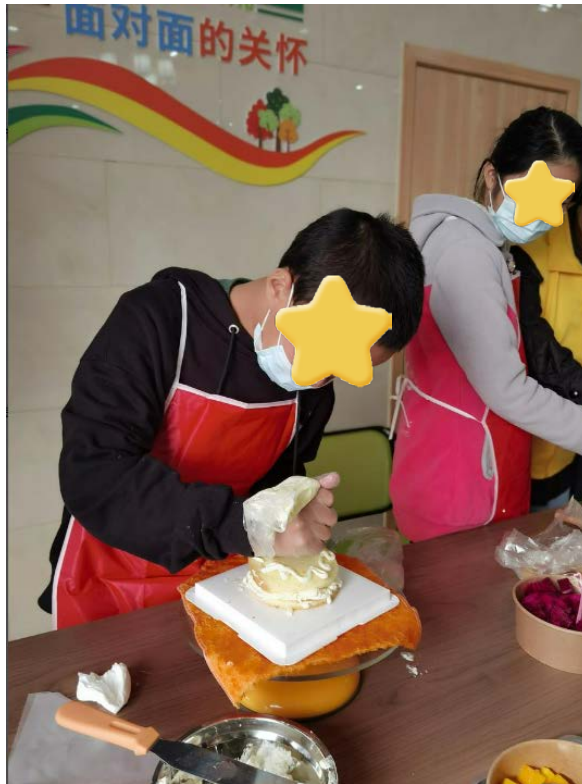
感恩节做蛋糕活动