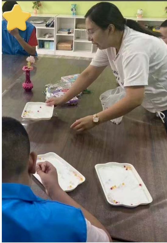
手工编织技能培训