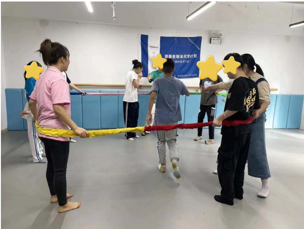
心青年们参加舞动疗愈课程

2022年11月，西安市某康复机构通过本项目支持，每周四开展舞动疗愈课程，放松星儿身体，让情绪得以舒缓，且通过合作类身体互动活动，让孩子熟悉自己，了解同伴，从而更好的表达自己的情绪，有8名心青年参与其中。几场活动开展下来，孩子们每周四见到老师都特别兴奋，用自己的语言、行为表达着情感，真切又真挚。