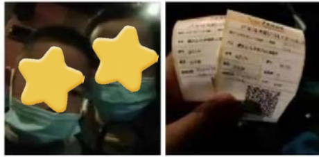
心智障碍者家长感受