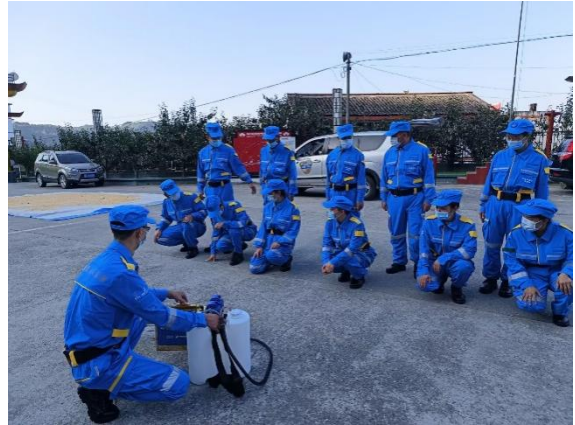
讲解消杀工具的使用