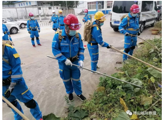
古窑社区志愿者救援队开展培训

10月2号，税务街社区志愿者救援队开展了安全家园搜索与救援培训；10月5号，税务街社区志愿者救援队开展了安全救援培训。