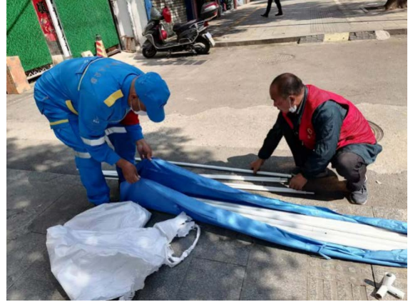
社区志愿者救援队队员参与疫情防控