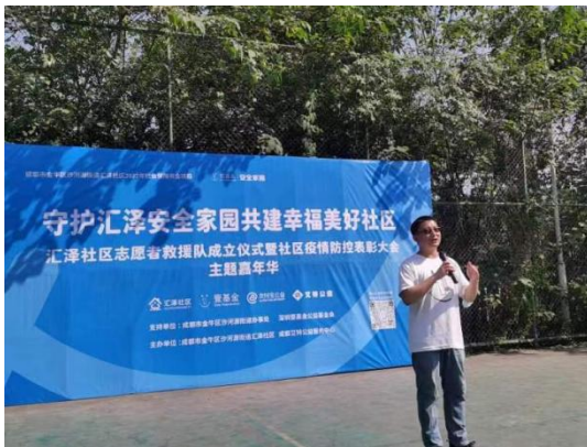
安全家园项目负责人讲话

10月16日，汇泽社区志愿者救援队成立仪式顺利召开，会上社区书记为参与8月社区防疫行动的志愿者救援队队员进行了表彰。