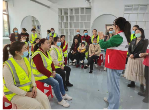
开展灾难医疗培训