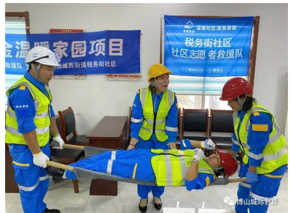
税务街社区志愿者救援队开展培训