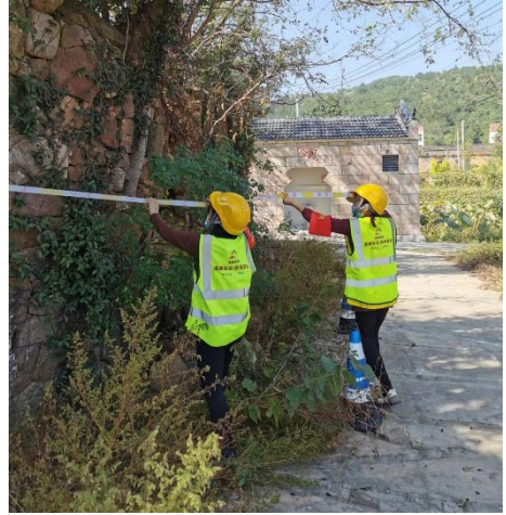
开展社区安全隐患排查