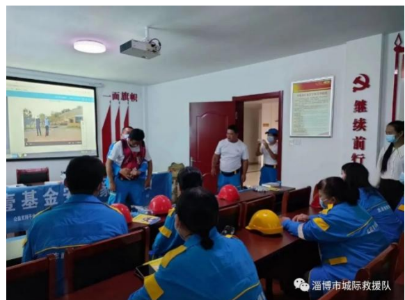
开展防灾减灾知识培训