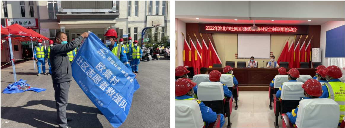
举行项目启动仪式

10月13日国际减灾日，由杜集区应急管理局主办，淮北市蒲公英公益协会、淮北市红十字会应急救援队、淮北市公益服务协会承办的壹基金温暖家园项目启动仪式，在淮北市杜集区举行。