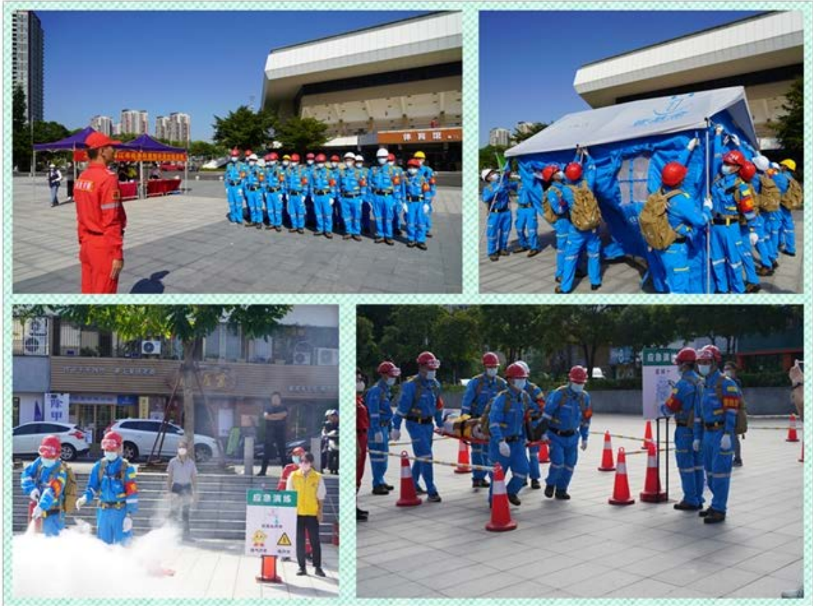
开展应急避难场所应急演练

10月13日国际减灾日，湛江市情暖湛江志愿者协会协同市应急管理局、赤坎区应急管理局、联合市体育中心、南桥街道办、京基社区、广东国兴安全技术有限公司在市体育中心开展应急避难场所应急演练，进一步强化政府主导、社会参与、多方协同的自然灾害早期预警与应急响应行动机制，着力提高全社会灾害风险防范应对能力。