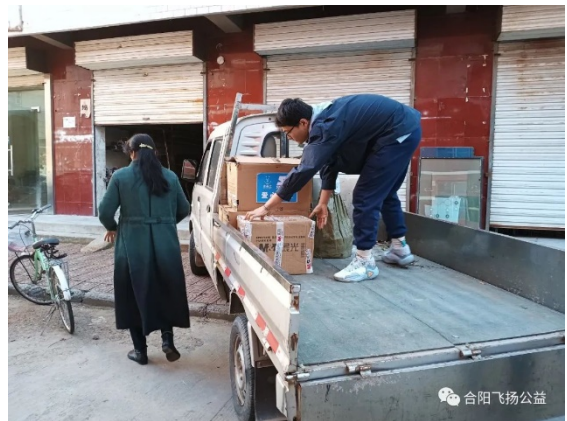
合阳县爱心飞扬公益服务中心进行物资派发