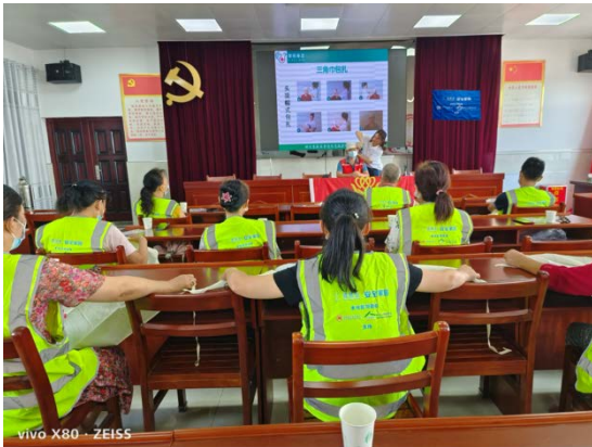
灾难医疗知识理论讲解

10月26日，广水市义工联合会走进城南社区，为社区志愿者救援队和居民开展灾难医疗自救互救安全教育培训。