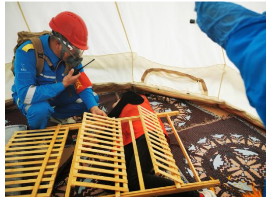
开展应急救护培训