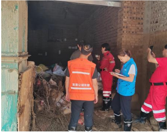
响应山西省吕梁市中阳县洪涝灾害