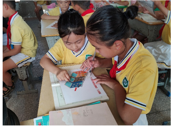
图 6 同学们在上消防安全课程 项目学校：茅家岭小学 执行机构：信州区繁星社会工作服务社

9月，交通训练营新增活动场次9场，本月共1383名儿童从交通训练营的活动中学习了安全知识和自救互救的技能。