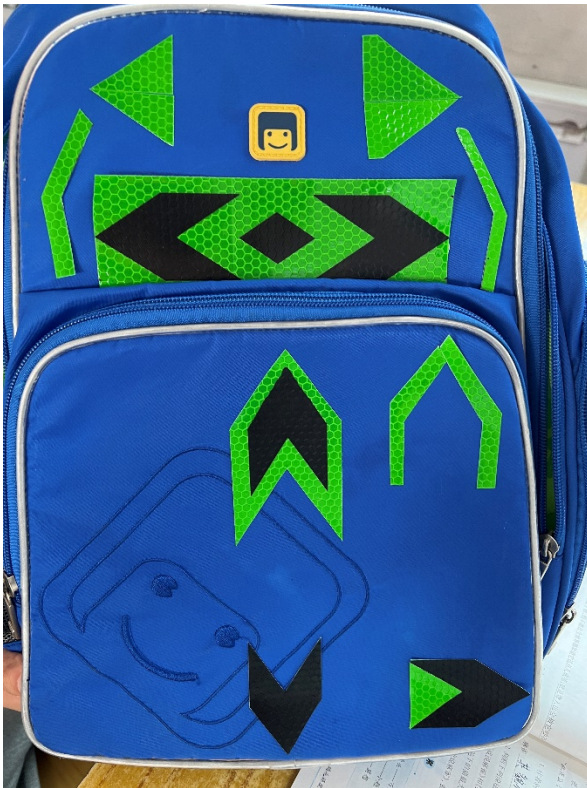
图 15 作品：自制反光挂饰 作者：杜宇博 项目学校：石嘴山市第六小学 执行机构：大武口区善信公益服务中心