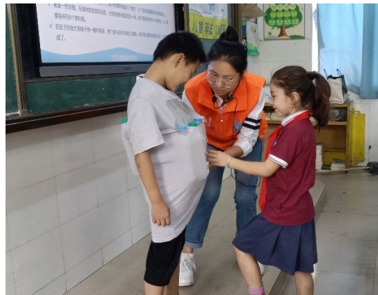
图4 防溺水课上，老师在教同学们制作紧急救生衣 项目学校：南昌桃花小学 执行机构：南昌益心益意公益服务中心