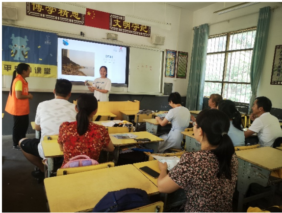
图 1 平乐县二塘镇牛角小学教师工作坊 执行机构：平乐县未成年人保护中心

9 月，广西、甘肃、重庆、山东等地执行伙伴共开展了 26 场入校教师、志愿者工作坊，360 名老师、志愿者参加培训。在工作坊中，各地执行伙伴将儿童平安小课堂的项目理念、模式方法及核心产品——安全教育课程介绍给老师，参与过工作坊的老师将在后期作为骨干教师承担儿童平安项目在学校的授课任务。未来，将会有更多的学校教师参与到儿童平安小课堂的项目中，使得参与式、体验式安全教育方法扎根当地，提升项目的可持续性。