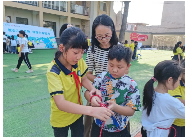
图 12 游戏名称：绳结大比拼 执行机构：郑州高新区益人社会工作服务中心