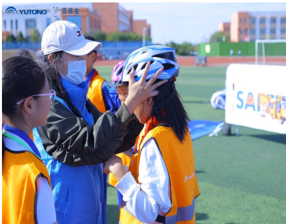
图 7 游戏名称：安全头盔接力赛

9月，交通训练营新增活动场次9场，本月共1383名儿童从交通训练营的活动中学习了安全知识和自救互救的技能。