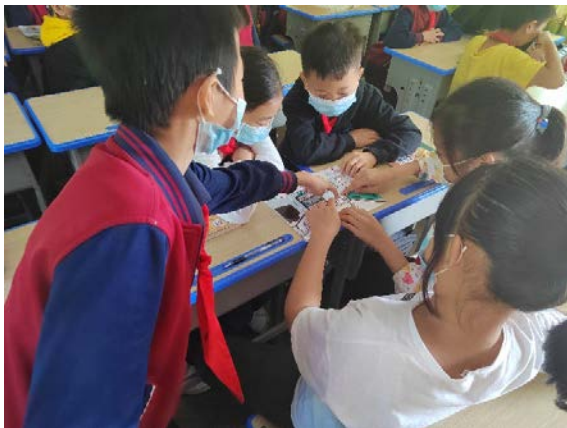
图3 同学们在地震减灾课堂上进行小组讨论 项目学校：澳背小学 执行机构：惠州市手牵手公益服务中心