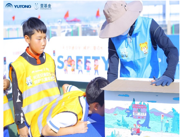
图 10 游戏名称：探索神奇的盒子