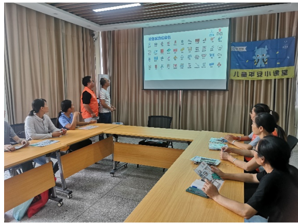
图 2 平乐县阳发实验学校教师工作坊 执行机构：平乐县未成年人保护中心