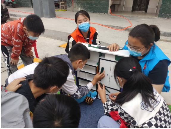
图 13 游戏名称：家具防倾倒 执行机构：漯河中和社会组织服务中心