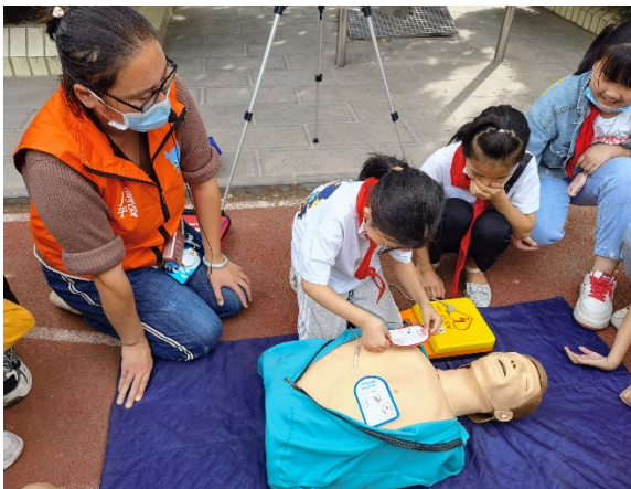
图 11 游戏名称：AED 的使用 执行机构：郑州市金水区比邻社会工作服务中心

9月，生存训练营新增活动场次 125 场，本月共 9865 名儿童从生存训练营的活动中学习了安全知识和自救互救的技能。