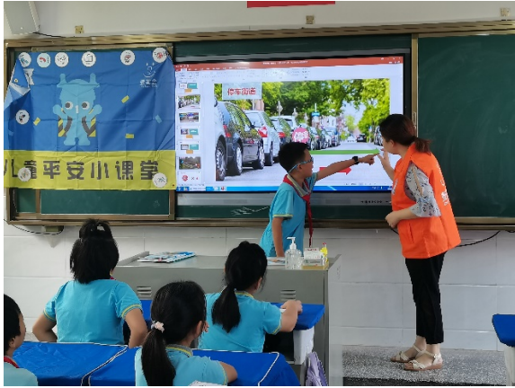
图 5 同学们在上交通安全课程 项目学校：宜昌市点军区联棚小学 执行机构：宜昌市启智亲子公益活动中心