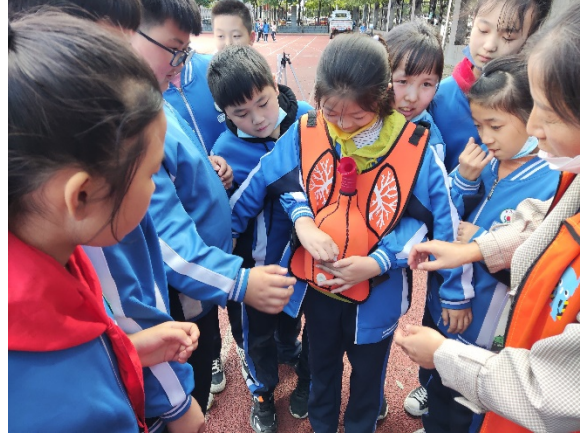
图 14 游戏名称：海姆利克急救法 执行机构：济源市春芒社会工作发展中心