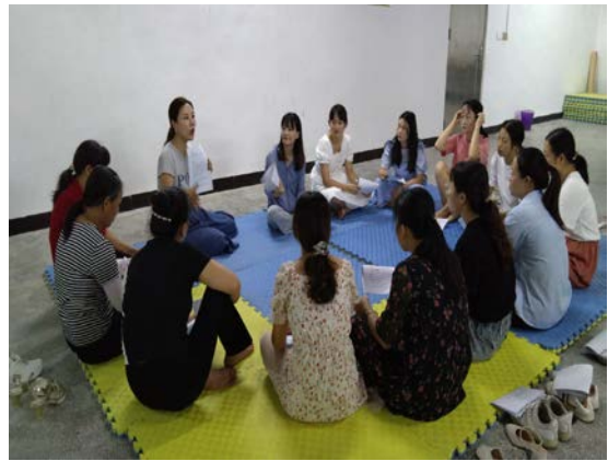
翁源县坝仔镇举办健康童乐园项目培训