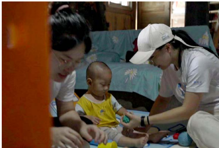
壹基金项目人员走访项目家庭

同时，壹基金项目团队前往到贵州省三都县进行项目的走访调研，共计走访1村5户家庭，进一步了解了少数民族偏远项目地的具体需求，为项目后续的设计及运营积累了完善和迭代的经验。