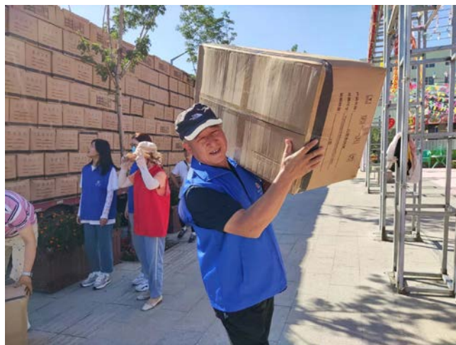
吉木萨尔县关工委成员及当地志愿者卸货物资

8月，健康童乐园项目在广东韶关市、新疆昌吉州落地3000户。截至8月底，广东韶关市在翁源县发放童乐园家庭物资2000套。在新疆昌吉州，因受疫情影响，童乐园家庭物资未能全部入户，在吉木萨尔县发放了174套，在阜康市发放了466套。