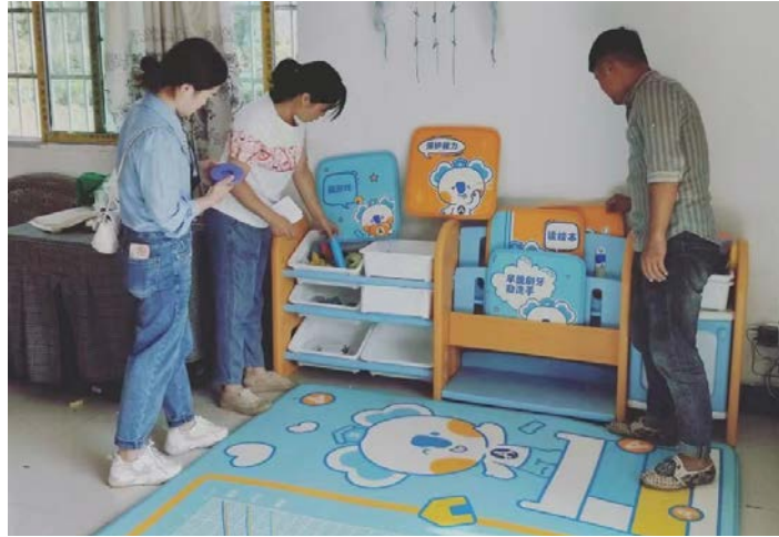
凤冈县管理人员走访项目家庭

本月，凤冈、湄潭2县开展了入户走访督导活动。凤冈县管理人员/志愿者走访了大连村、官田村、玛瑙社区等14个村社的96户家庭，执行督导工作100次。湄潭县在大山社区走访了2户家庭。