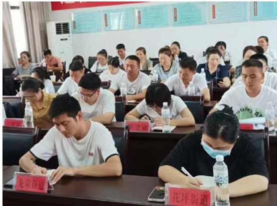
凤冈县组织健康童乐园项目培训