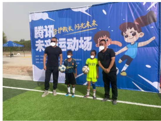
未来运动场启动仪式现场