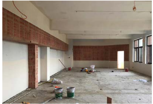
安州、昌平、滦平、金溪、本庄【5】所项目校装修现场