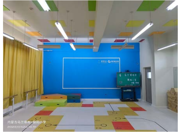
音乐教室建成效果图