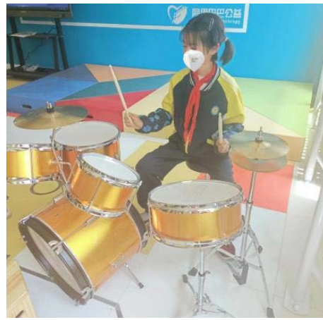
同学们在音乐教室中练习架子鼓