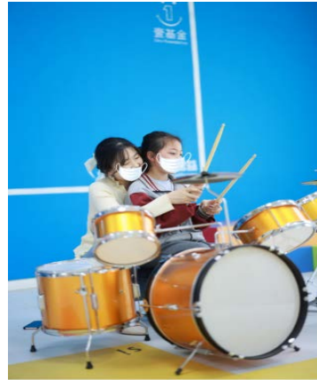
老师在音乐教室中教授舞蹈和架子鼓