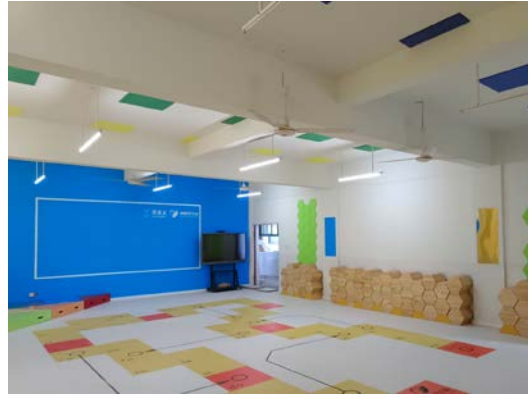
音乐教室装修效果图