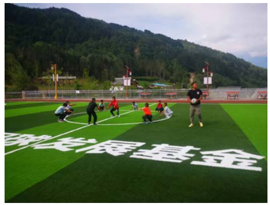
老师带领同学在足球场地上开展体育活动