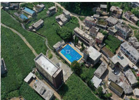
图：织金县鸡场乡丫口寨山村幼儿园铺设前后对比照片