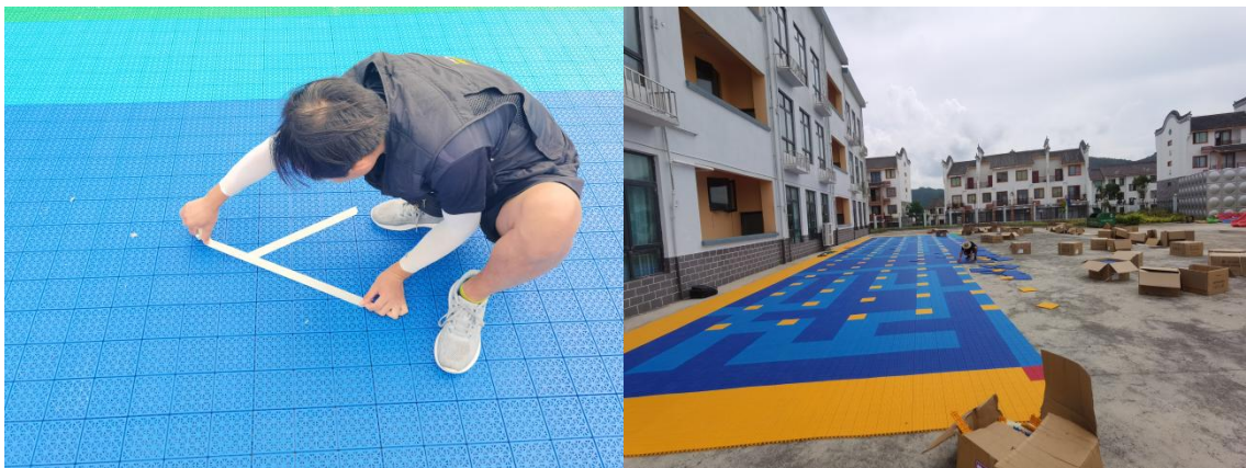
图：织金县上坪寨乡五甲幼儿园-施工照片