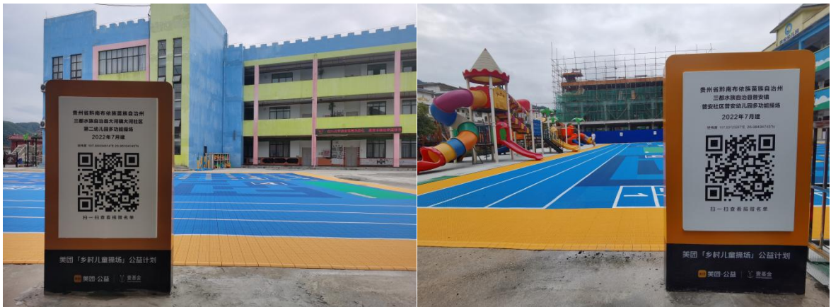
图：三都水族自治县大河镇大河社区第二幼儿园（左）、普安镇普安社区普安幼儿园（右）铭牌安装照片