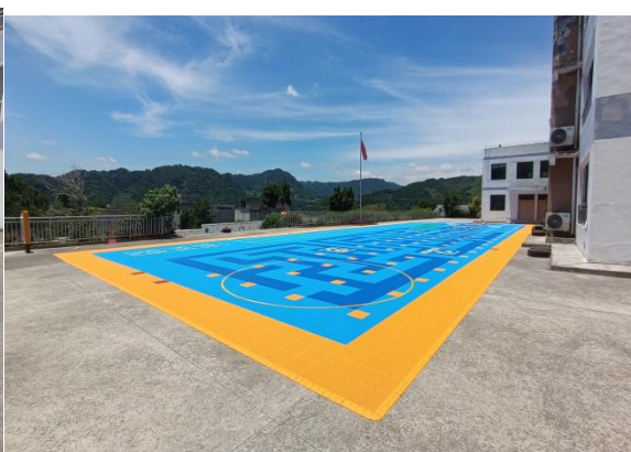
图：黔西市中建苗族彝族乡中心幼儿园-场地铺设对比照片