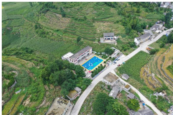
图：黔西市永荣彝族苗族乡建筑幼儿园铺设前后对比照片