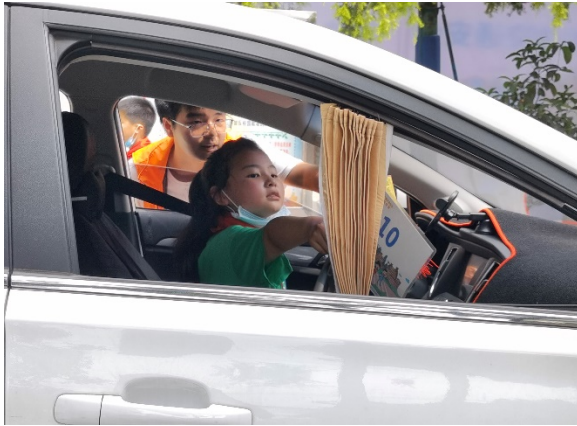
图 7 游戏名称：认识车辆盲区 执行机构：成都市爱有戏社区发展中心