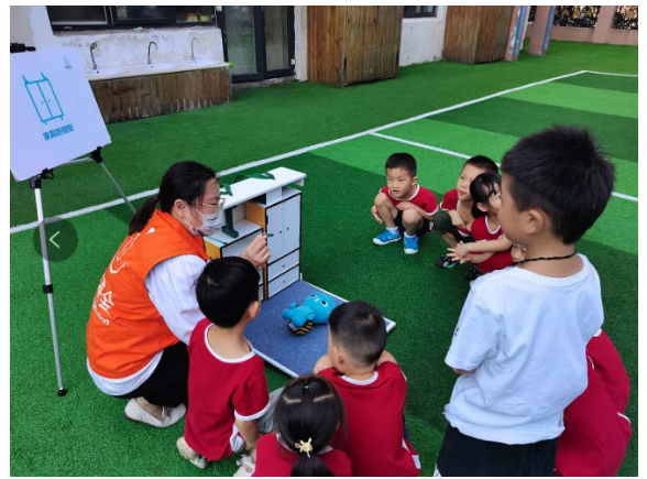
图 14 游戏名称：家具防倾倒 执行机构：郑州市金水区梓闻社会工作服务中心