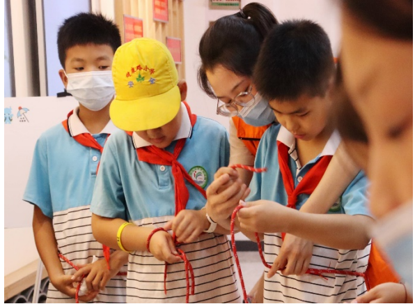
图 12 游戏名称：绳结大比拼 执行机构：济源市心理咨询师协会