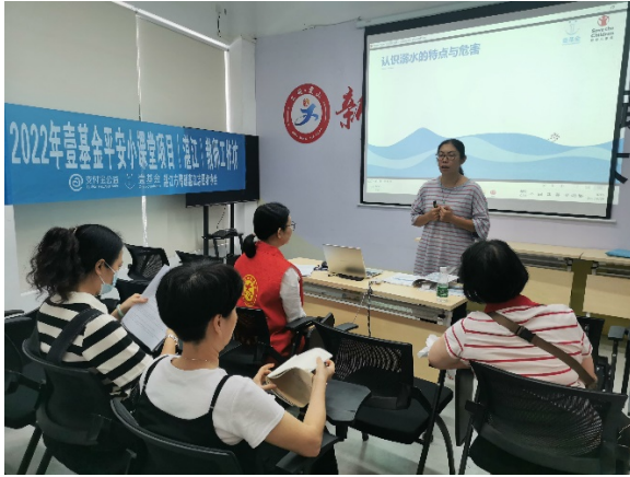
图 1 湛江市第二十小学教师工作坊 执行机构：湛江市情暖湛江志愿者协会