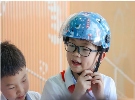
图 10 游戏名称：安全头盔接力赛 执行机构：成都市爱有戏社区发展中心