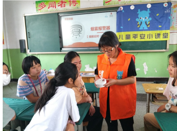
图 4 消防课上，老师在给同学们展示烟雾报警器 项目学校：临猗县北景小学 执行机构：新绛天龙救援队