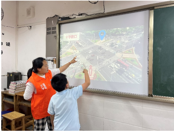
图 3 同学们在上交通安全课程 项目学校：江津区菜市街小学 执行机构：重庆市江津区阳光公益志愿者协