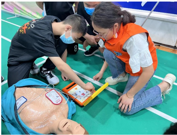
图 13 游戏名称：AED 的使用 执行机构：郑州高新区益人社会工作服务中心