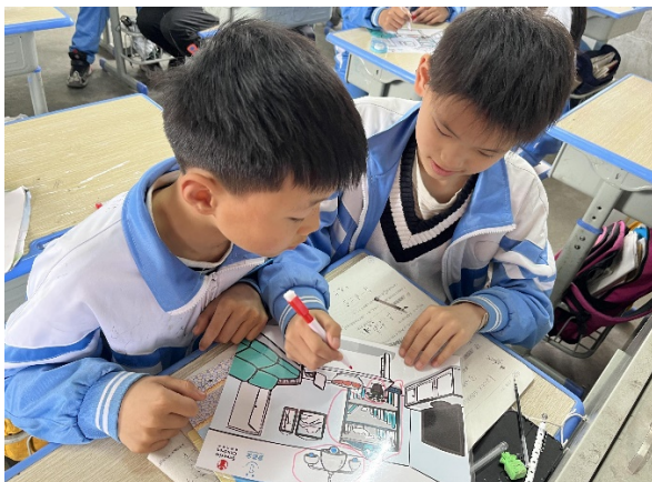
图 5 同学们在上地震课程 项目学校：德安县邹桥学校 执行机构：德安义工联合会