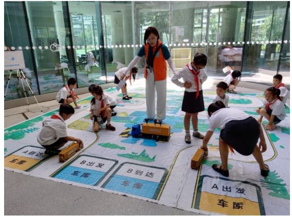
图 8 游戏名称：认识车辆内轮差 执行机构：成都市爱有戏社区发展中心