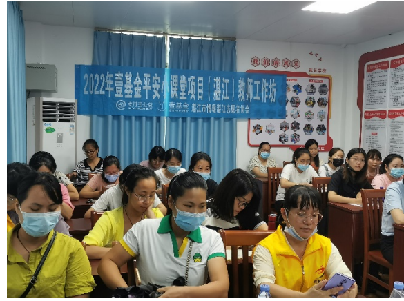
图 2 湛江市第二中学小学部教师工作坊 执行机构：湛江市情暖湛江志愿者协会