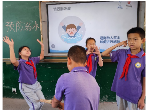
图 6 防溺水课堂上，同学们在进行情景剧表演 项目学校：临猗县三管学校 执行机构：新绛天龙救援队