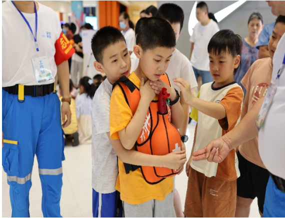
图 11 游戏名称：海姆利克急救法 执行机构：黄山市微公益志愿者协会