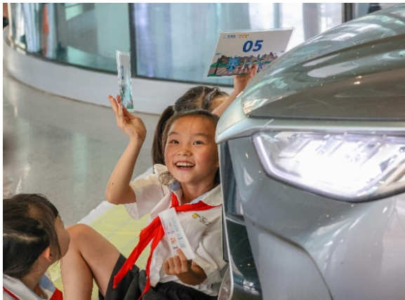
图 9 游戏名称：认识车辆盲区 执行机构：成都市爱有戏社区发展中心