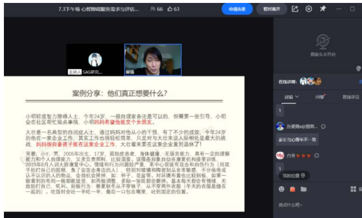
心智障碍服务需求与评估线上培训