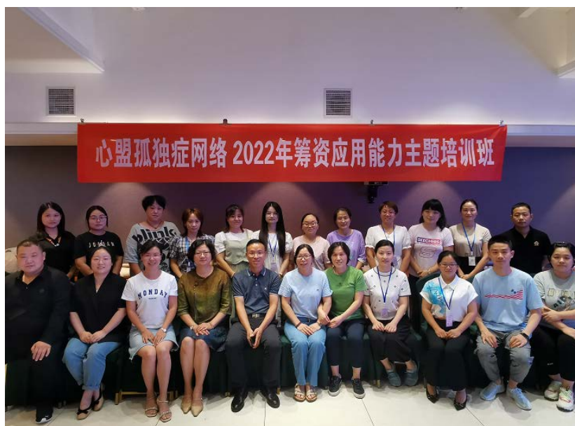
筹资应用能力主题培训

培训就筹资理念、筹资策略、筹资技能、分析潜在资源，梳理不同形式筹资的特点和策略、如何拓展筹资渠道等内容展开参与式学习和分享。