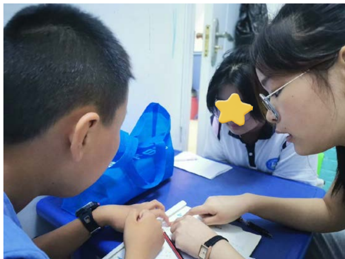
孤独症儿童康复训练

同时，7月，为40名孤独症儿童进行了项目末期教学评估，评估3月以来所援助孤独症儿童康复进展情况，总结进步点和落后处，为后续课程提供指导。