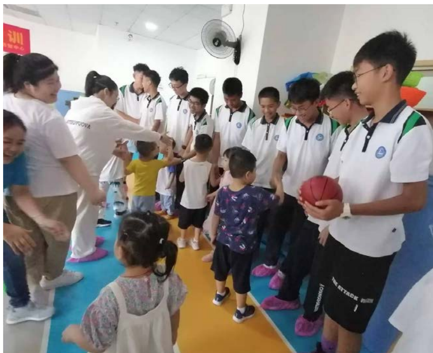
长沙市立信中学 C2017 班的同学们在给孤独症儿童分发礼物