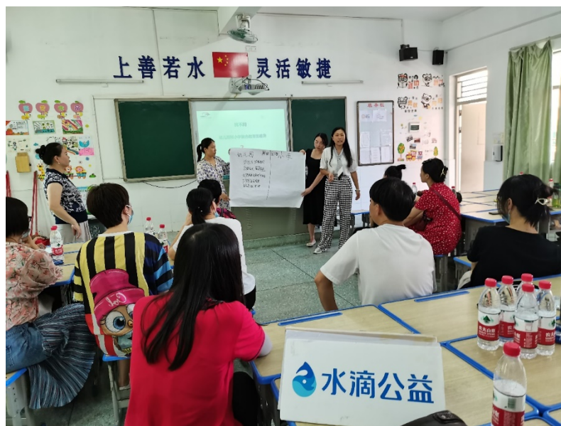
家长们在积极参与融合教育活动