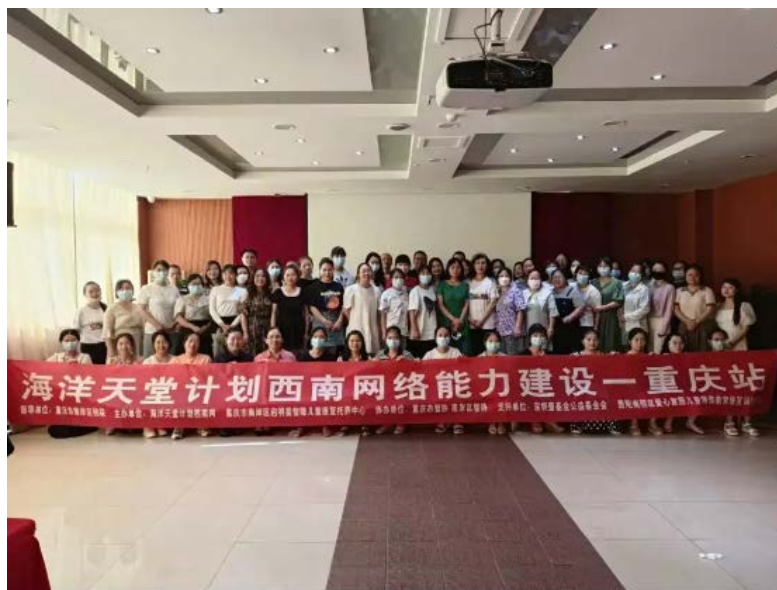
重庆分会场圆满结束