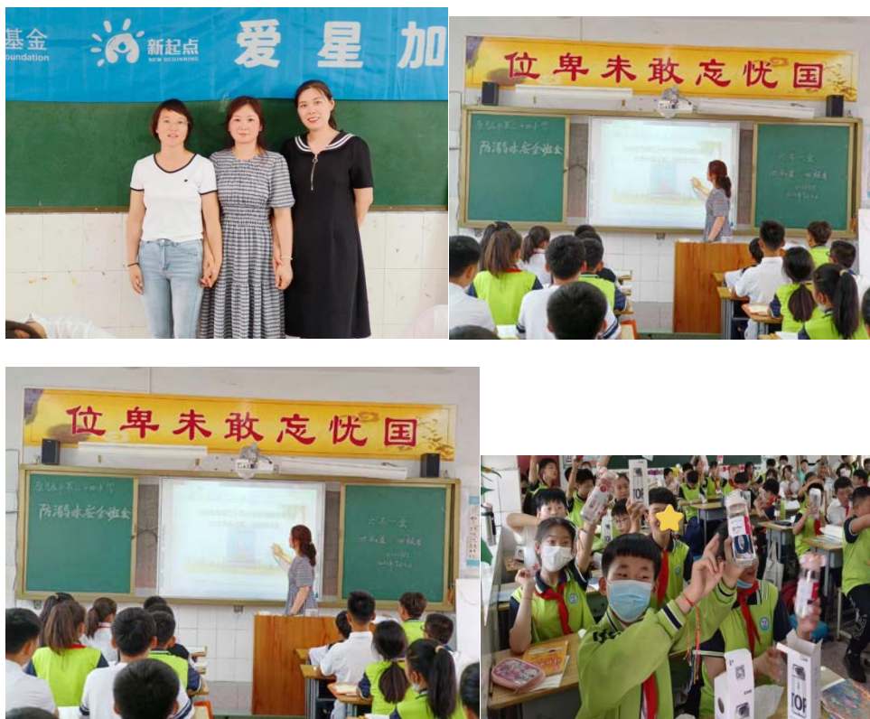
孩子们踊跃参与活动