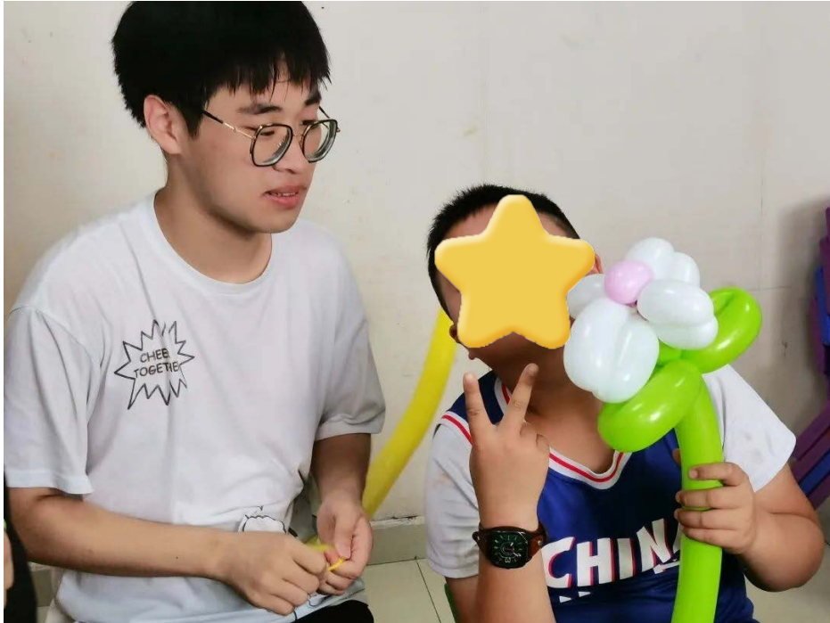
孩子们在展示活动成果