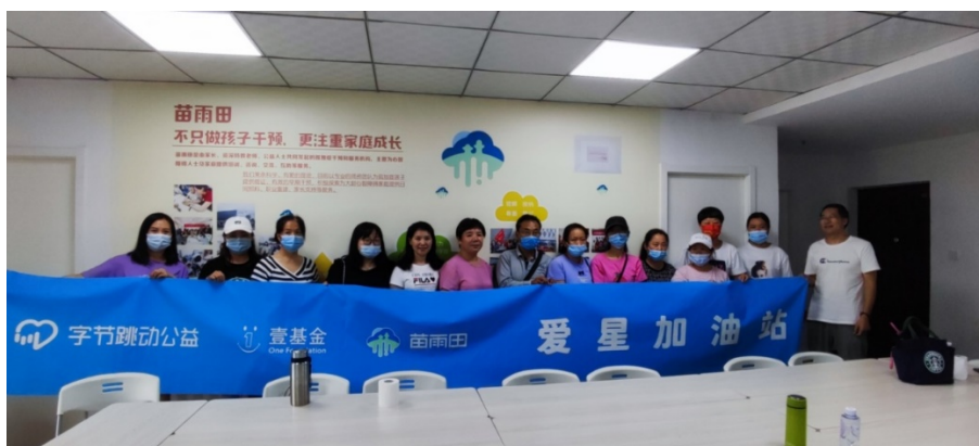
家长们认真地听讲座