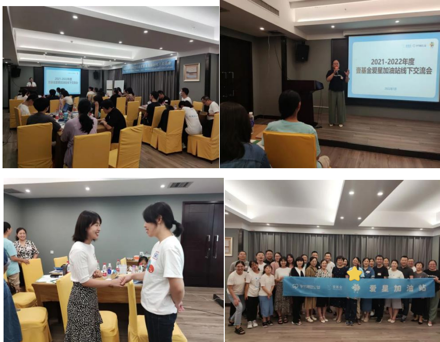
来自河南省各地的项目伙伴欢聚一堂