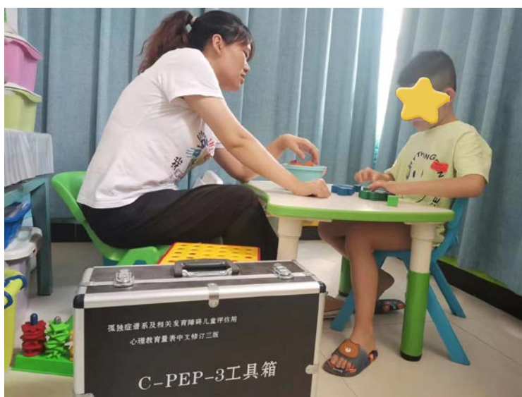
孤独症儿童教学评估

同时，7月，为40名孤独症儿童进行了项目末期教学评估，评估3月以来所援助孤独症儿童康复进展情况，总结进步点和落后处，为后续课程提供指导。