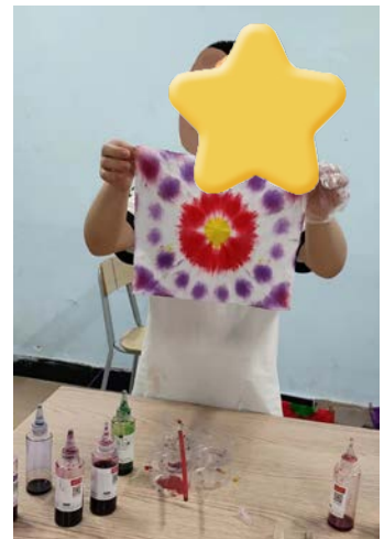
孩子们在展示作品