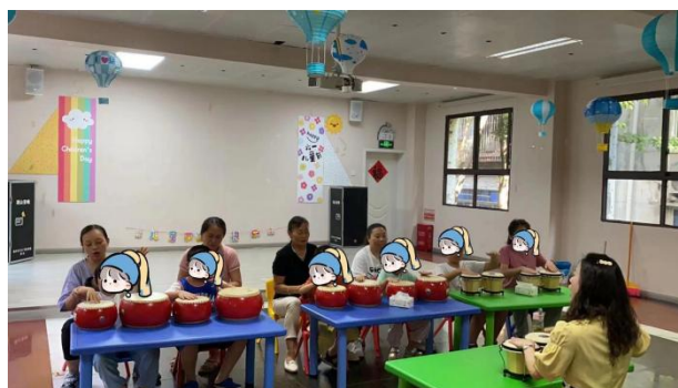
孩子们在参加课程