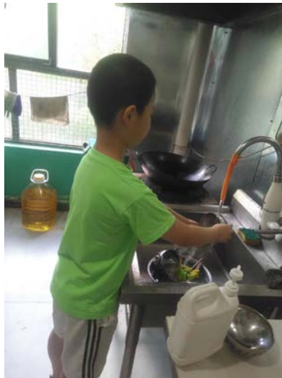
做力所能及的家务