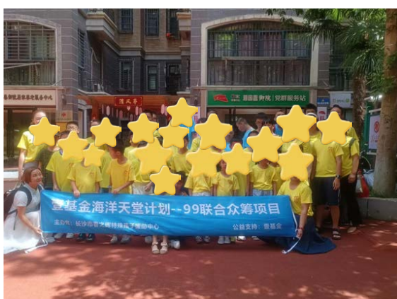
孩子们在参加融合活动