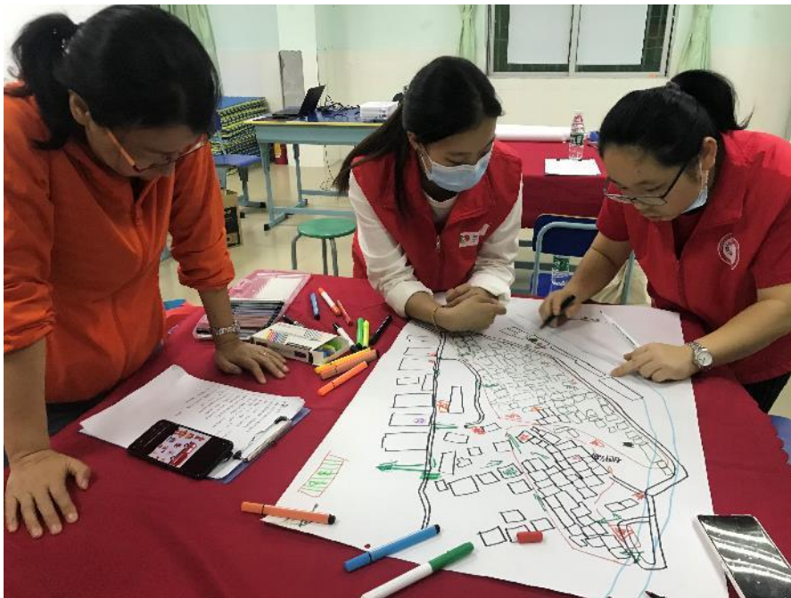
队员们绘制社区风险地图