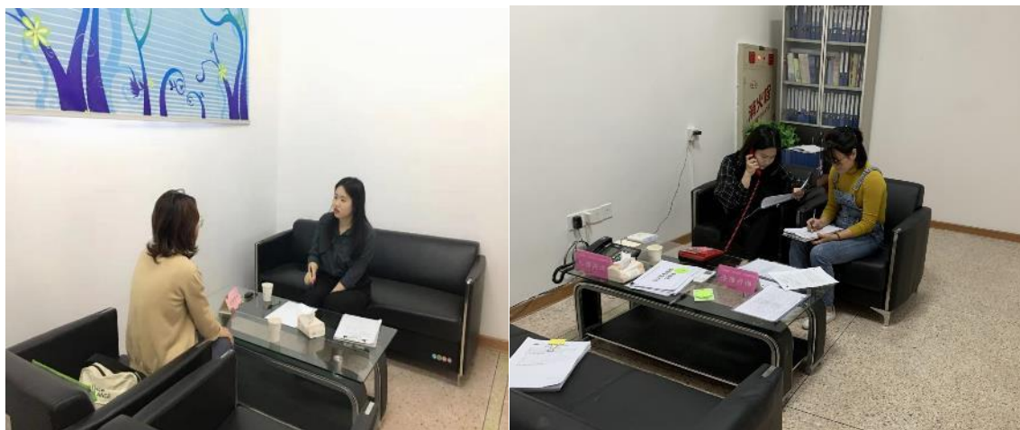
值班（个案求助、电话回访）剪影