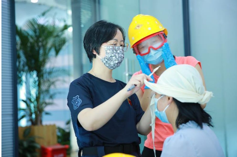
队员们分组参加结项实操考核

11月8日，开展项目考核及总结会，共【18】人参加，项目总结传播覆盖【545】人。