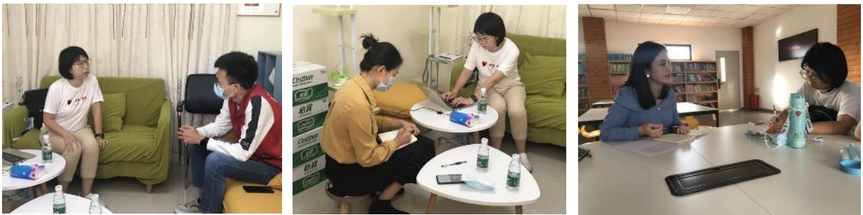
青少年案例收集-访谈党群青少年社工及学校心理社工

10-11月，完成本地青少年欺凌案例搜集，共访谈了【10】位青少年服务社工、驻校社工、律师等、心理医生、家长。