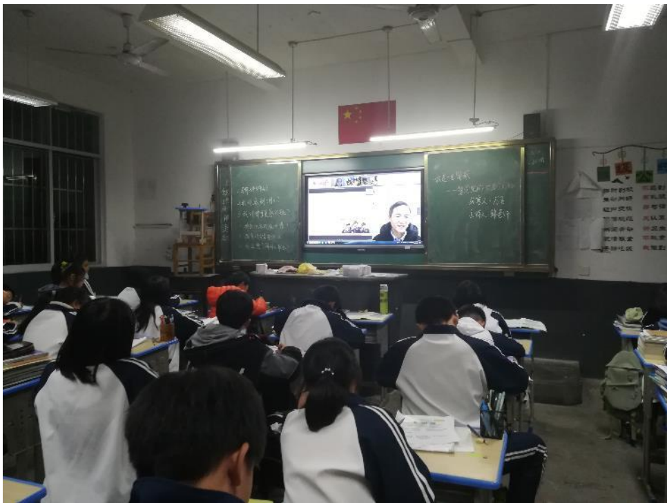
黄埠中学的同学在听法制警察万飞做职业分享