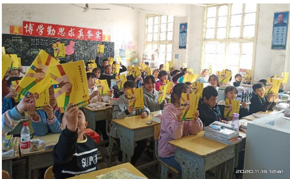
高坪九校学生收到教材

与线上的“知彼”课程相配合的是由当地学校老师为学生开展的线下生涯教育课程。线下课程所用相关教案（包括课件和逐字稿）以通过网盘发送给学校老师，配套的自我探索教材《构建自我与未来——中学生生涯手册》六所学校也已全部签收完毕。