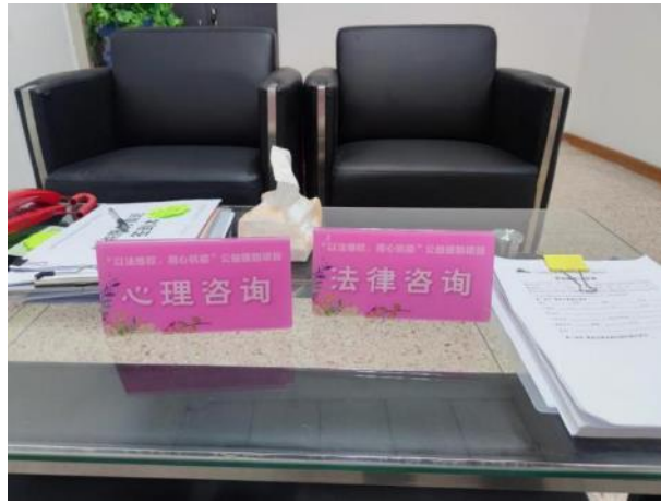
安排布置法律和心理咨询室