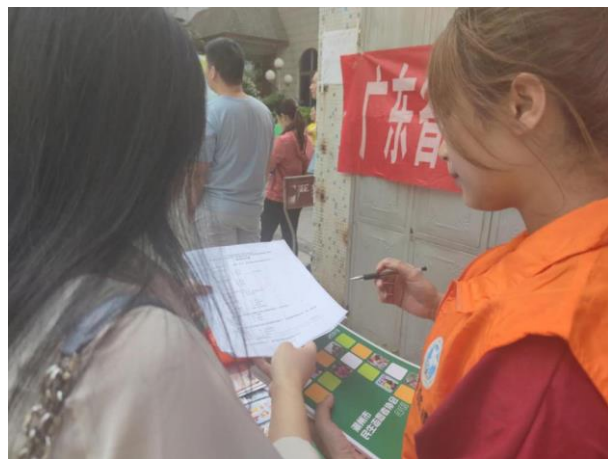
以上照片，为在悦园宣传项目和调查群众需要。