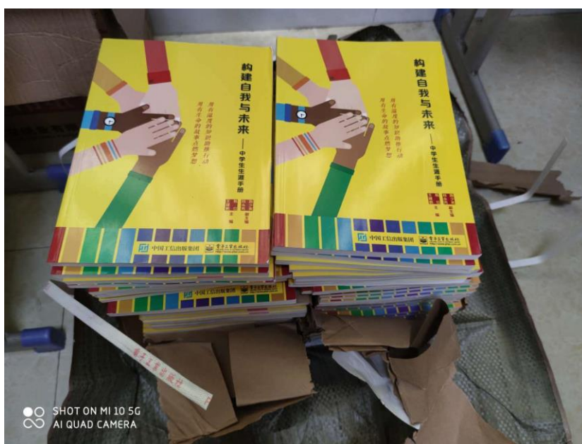
宜章十一中、东山学校签收教材

配套的自我探索教材《构建自我与未来——中学生生涯手册》也已印发邮寄。本次免费提供教材355本，其中黄陈中心学校59本，大湾学校74本，黄埠中学45本，宜章十一中学70本，东山中学52本，高坪九校55本。东山中学和宜章十一中目前已收到教材，等待后续由老师带来学生开展线下生涯教育课程。