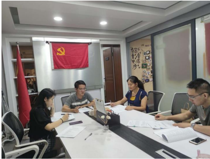
项目团队主要成员，召开前期动员会议。