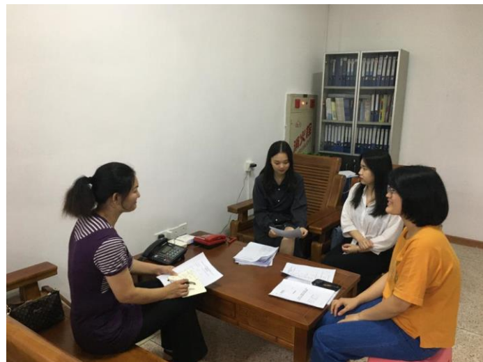
走访妇女维权站工作人员。