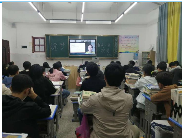
演员李瑞凤老师为宜章十一中学生分享