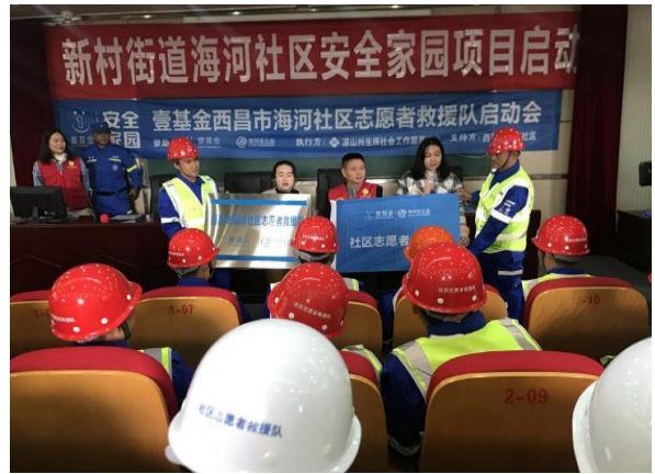
海河社区领导及执行机构负责人为海河社区志愿者救援队授牌和授旗