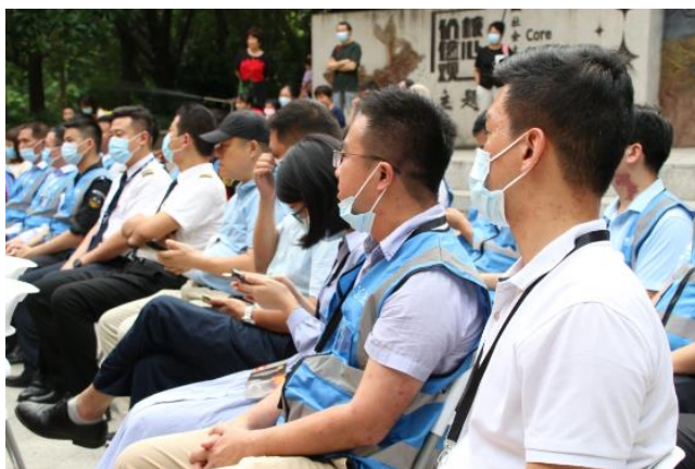
社区救援队参与活动

活动现场笋西社区设置了空中救援、应急救护、家庭用电安全、安全屋、“强安杯”等多个项目展示，吸引众多市民参与体验。笋西社区应急志愿者救援队为社区居民展示了双人灭火等应急项目。