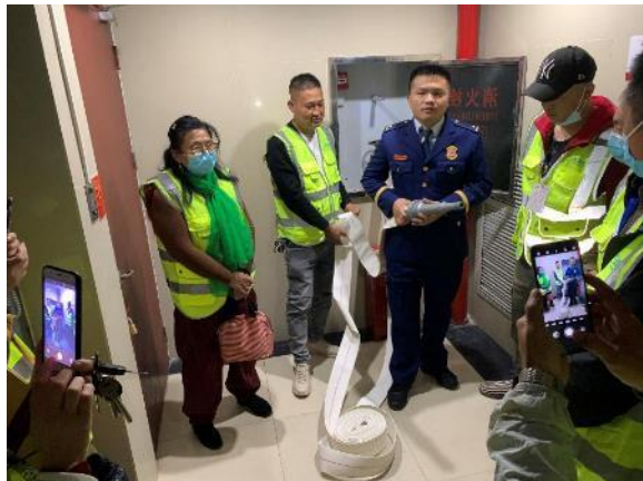
消防队员讲解火灾警铃和消防栓的使用