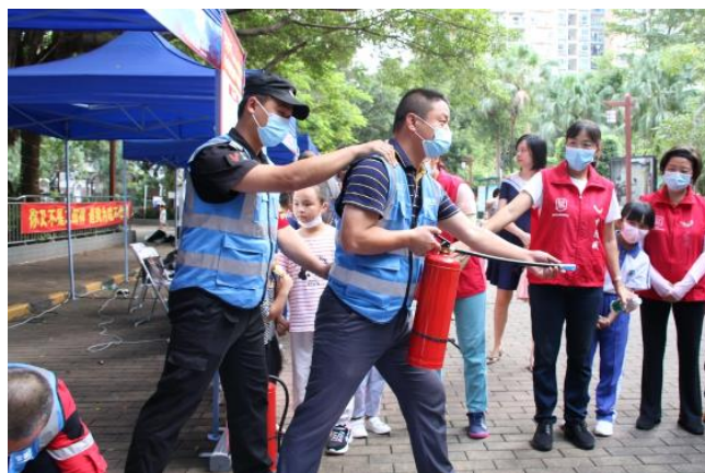
队员现场展示双人灭火