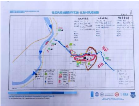
风险图绘制成品之一