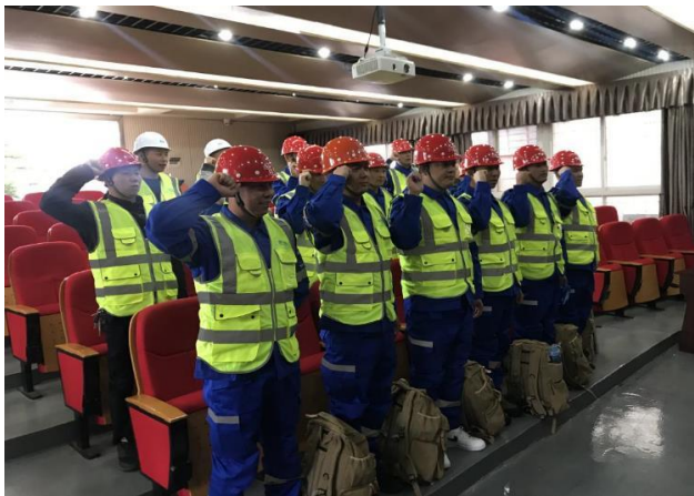
全体队员庄重宣誓志愿加入队伍