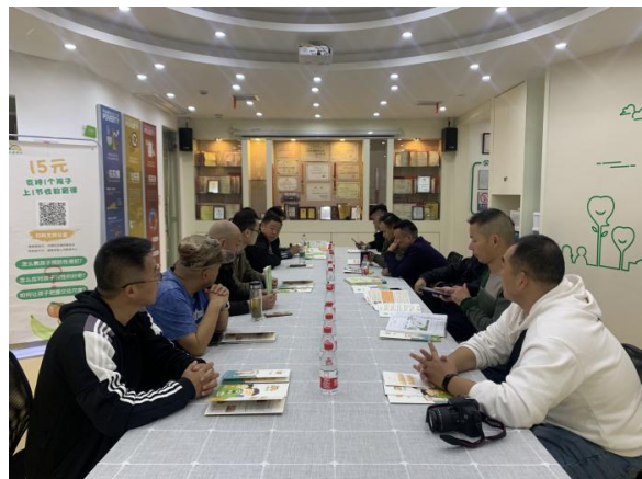
右图：交流和探讨机构发展规划