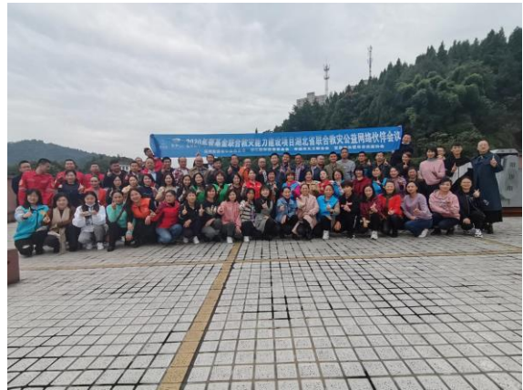
右图：活动结束后合影