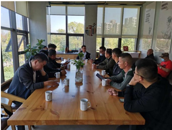
左图：交流共享图书馆

2020年10月21日-23日，为提升壹基金联合救灾安徽救灾伙伴救灾能力，拓展安徽救灾伙伴视野，特选拔了14家伙伴机构前往湖南学习湖南省壹基金联合救灾伙伴机构管理、机构发展，本次交流共16人参与。