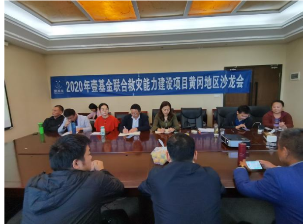
上图：参会代表分别对各自机构发展历程和未来发展规划做分享