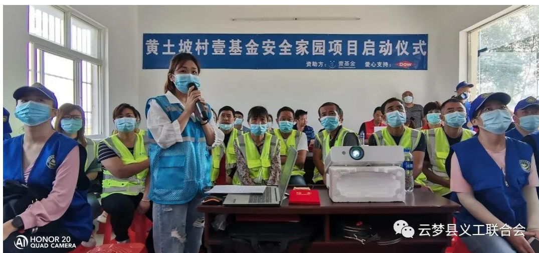
项目负责人介绍项目

9月11日，云梦县义工联在义堂镇黄土坡村举办了项目启动会暨第一次培训会。县应急管理局、新时代文明实践中心、团县委、义堂镇政府、县民政局、县消防大队、县志愿消防服务队、黄土坡村委会及部分村民出席了此次会议。参会社区志愿者救援队20人、消防志愿服务队28人，义工志愿者16人，村居民10多人。