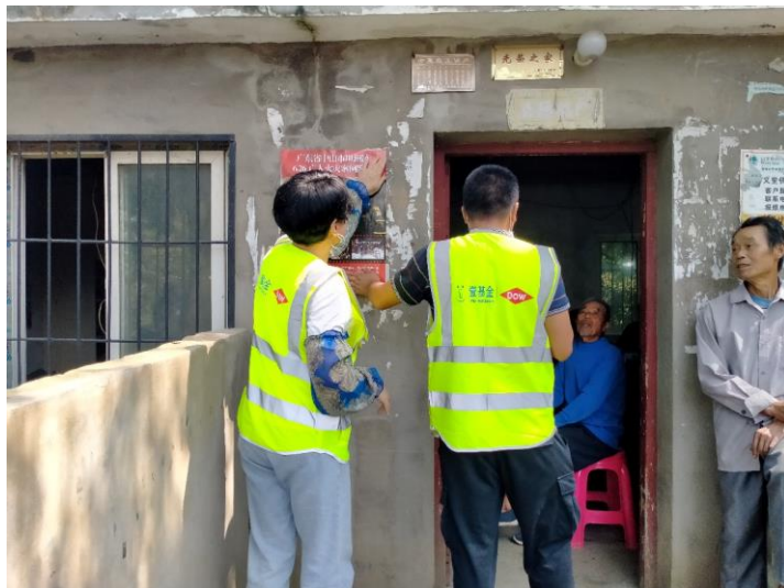
张贴消防宣传海报

队员听课精力高度集中。课后还进行灭火练习，又带领队员进村做消防风险排查，人群聚集地张贴海报宣传防火安全知识。