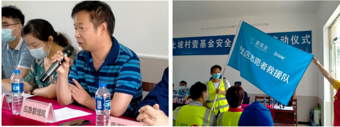
应急管理局李局长讲话并对黄土坡救援队授旗

谢意。感谢为此项目提供捐赠的公益组织和陶氏集团公司以及前来支持的各位领导。今后他将带领村民积极参与到项目的各项培训学习中，确保每一份馈赠都不被辜负。