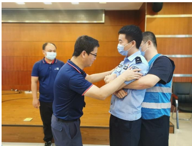
双人转运姿势讲解