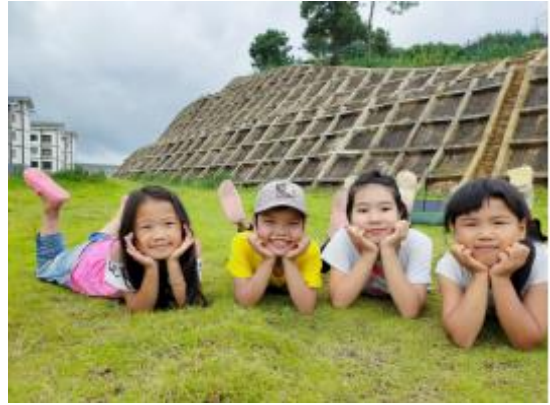
左图：阿妹戚托儿童服务站 | “大手牵小手，快乐一起走”亲子趣味活动