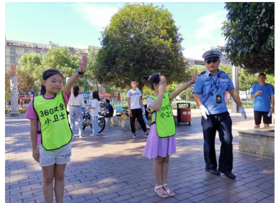
左图：复胜村家乡记忆·壹基金儿童服务站 | 家乡记忆·夏日梦工厂——相见欢与守护天使