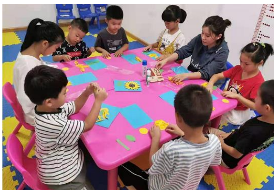
左图：广德社区儿童服务站 | 手工制作