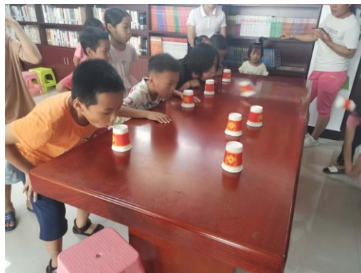
上图：鹤城新区儿童服务服务站 | 纸杯游戏

2020年8月期间，【广西】8家壹基金·儿童服务站整体工作进展顺利，【8】家儿童服务站分别开展了建军节、小学生礼仪课堂、趣味数学课堂、观看电影《龙猫》、美食绘画活动、阅读课外书籍、开展了“课业辅导、游戏、课外阅读、室外运动、自由活动，观看视频”等常规活动，“防溺水安全教育、未成年人保护法的宣讲、保护环境”等主题活动，“垃圾分类、变废为保”等特色活动等。受益儿童【3049】人次，志愿者【64】人次，微信推文【23】篇。