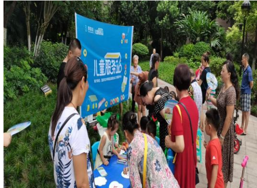
左图：塔耳门社区儿童服务站 | “环保小先锋”环保课堂