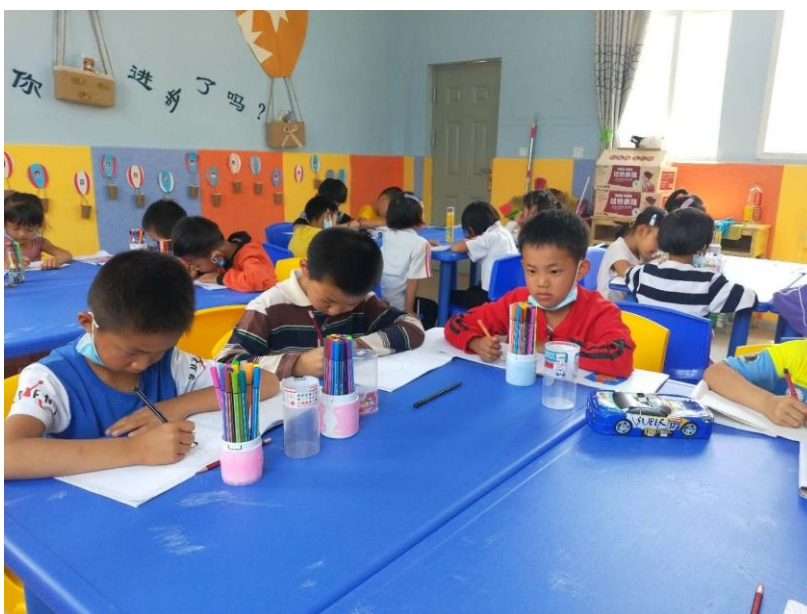
上图：803 站点 | 绘画活动