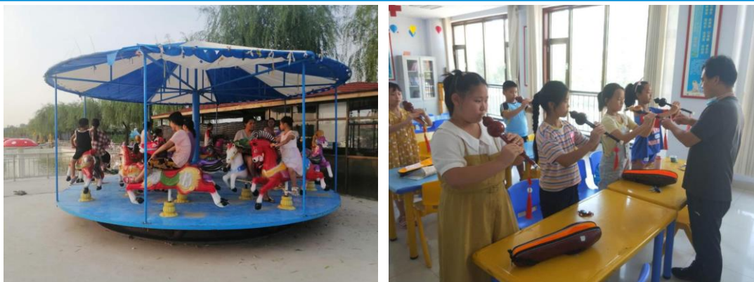
左图：十三村儿童服务站 | 游览鲁庄故道游乐园