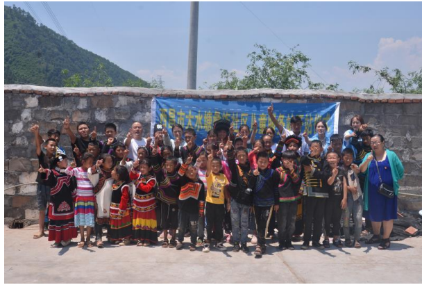
上图：大水塘苗族社区儿童服务站 | 开站仪式