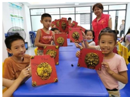
右图：东新街道站 | 传统文化之手工活动《门扣》