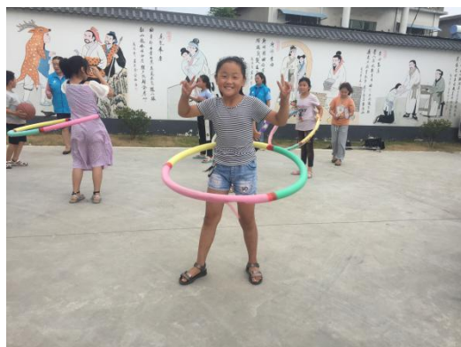
右图：阳光天使儿童服务站 | 室外活动