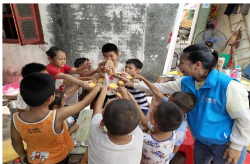
左图：太平镇文化站 | 趣味蛋挞DIY