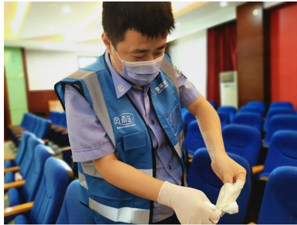
一次性医疗手套摘除练习