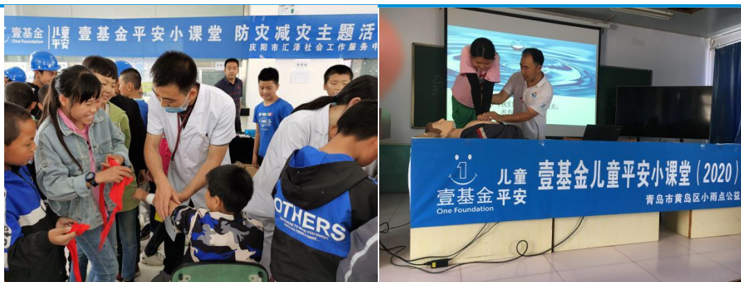
甘肃西峰区什社小学老师在教孩子们学习伤口包扎