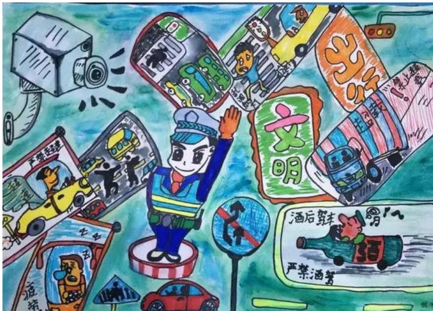
重庆黔江区白石镇中心小学学生上完交通课程后绘制的安全出行海报