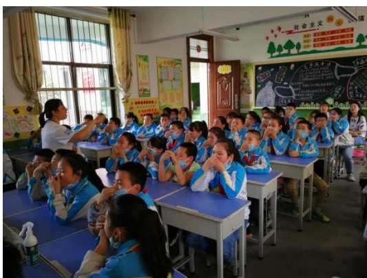
宝鸡五丈原北星小学学生在体验不能呼吸的感受

截止8月底，儿童平安小课堂项目共在全国16个地区共525所学校累计开展安全教育课程1135节，共有41057人次的学生参与其中。