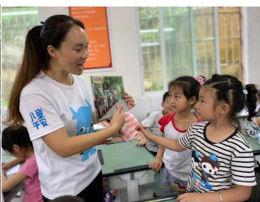
重庆潼南区上和小学学生演示如何安全出行

虽然时值暑假，但是丰富多彩的减灾主题活动在8月的校园中也轮番上演，围绕意外伤害的紧急救治、伤口包扎、心肺复苏的操作、简易担架的制作、伤员的运送、异物的催吐……一个又一个减灾主题活动以各种有趣又有效的活动形式在学校开展，让孩子们在游戏的过程中学习安全知识和技能。8月，甘肃、山东两地的伙伴共开展16场大大小小的减灾主题活动，共有2955人次的孩子参与到活动中，通过游戏的方式学习安全知识和技能。