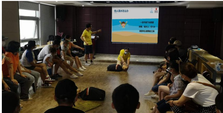
武伙伴汉知音广场会议室开展防溺水课程的学习，父母和孩子共同学习溺水急救