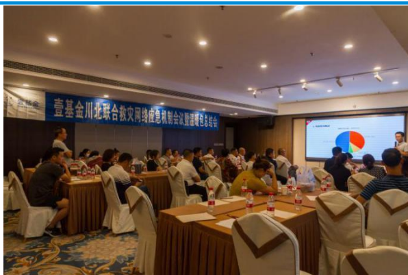
左图：温暖包项目总结图片