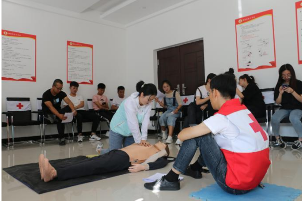
左图：红十字会救援考核

核，以“心肺复苏”、“创伤救护”等实操及理论为考试内容，功夫不负有心人，所有人都通过考核获得初级救护员证书。