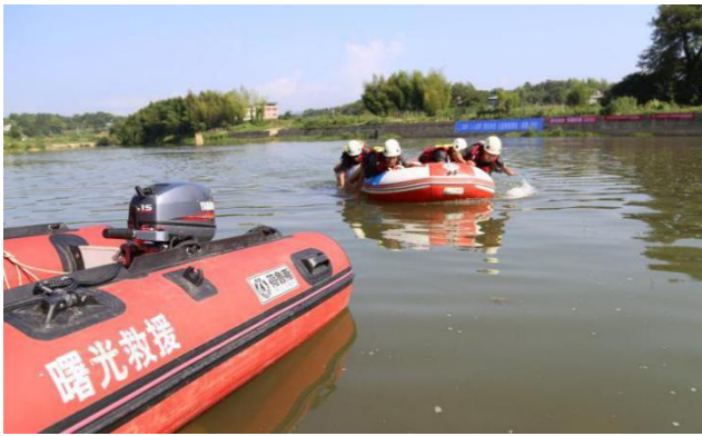
左图：现场冲锋舟演练图