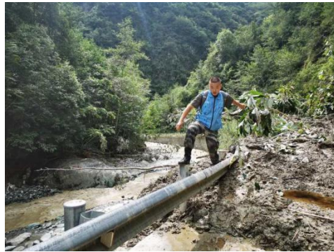
联合救灾伙伴在北川县开展灾情需求评