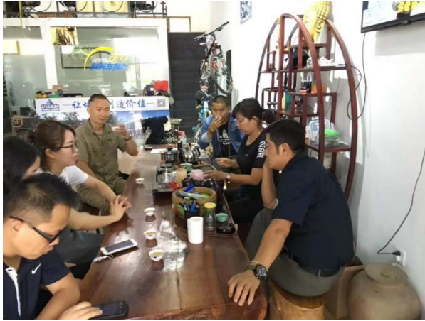
左图：景洪伙伴走访