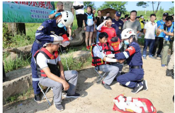
右图：现场急救演练图