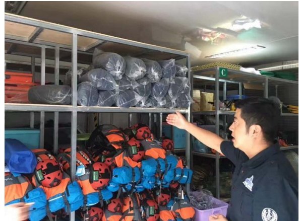
右图：普洱伙伴走访