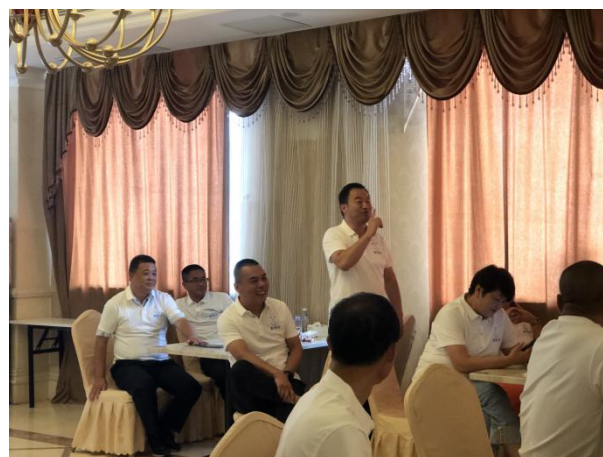
右图：伙伴现场互动图