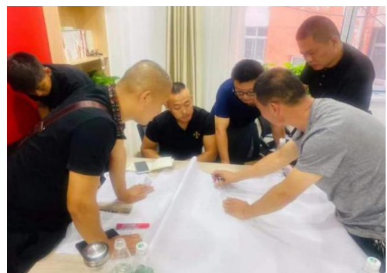
右图：伙伴们分组模拟制定救灾计划