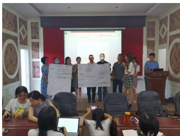
左图：伙伴现场互动交流成果展示