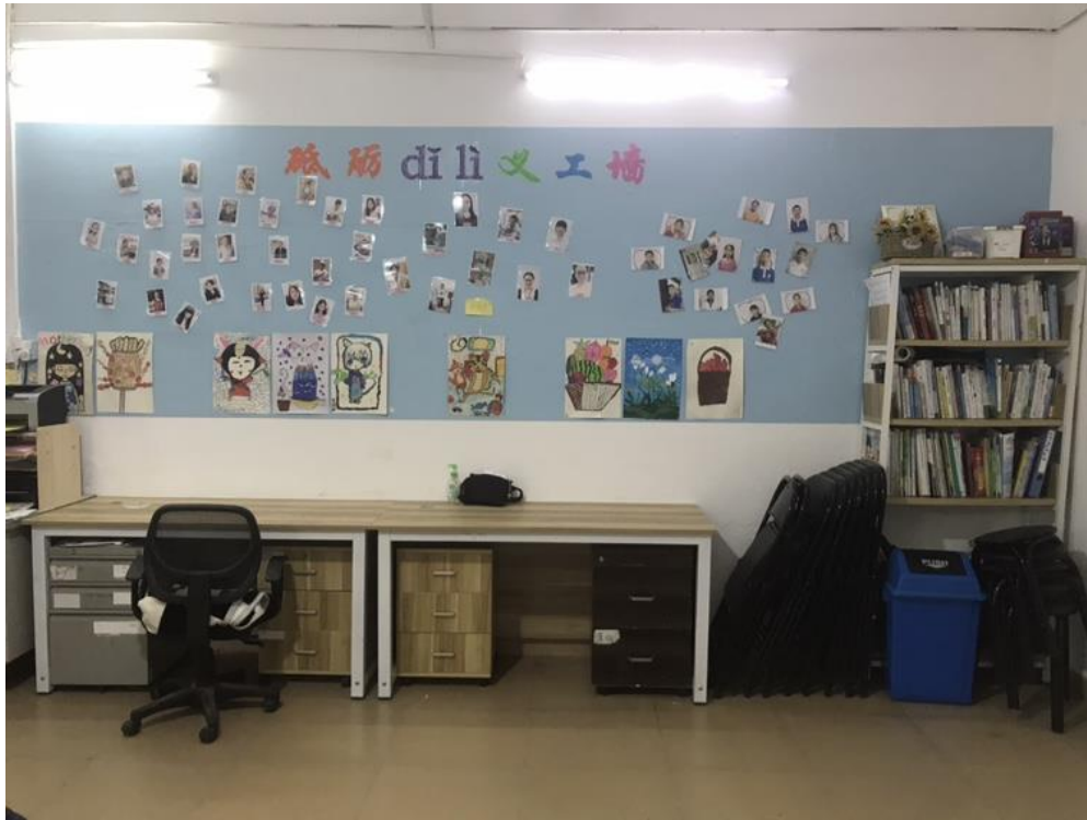
砥砺-大水坑项目点夏令营活动