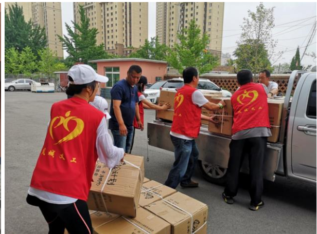
7月，东港市爱心义工协会按照项目学校儿童数量对项目水杯进行清点与分装