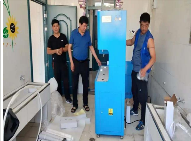
7月初，吉林省延边州项目学校已经收到净水设备，并陆续完成安装工作