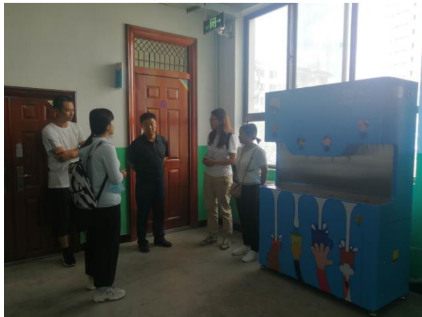
督导小组与新合小学校长交谈