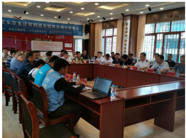
7月16日，云南省镇雄县召开2020年净水计划项目培训会