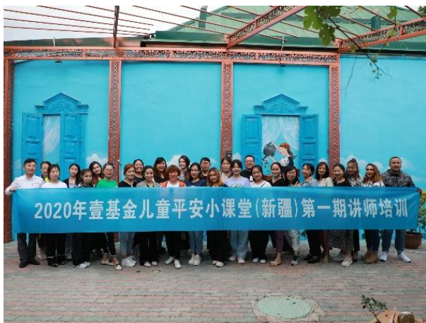
图1 新疆维吾尔自治区第一期讲师培训