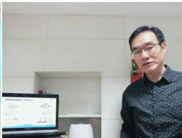
图2 湖北省第二期讲师培训中正在试讲的学员