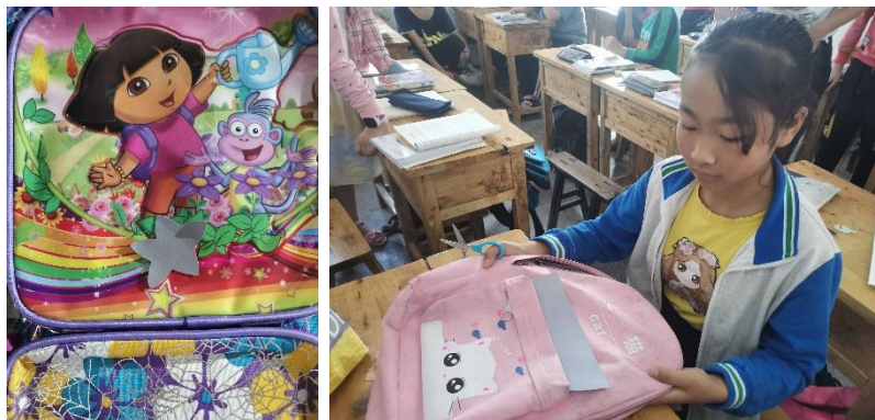
图 12 麻柳小学的同学制作的反光贴

在重庆市江津区麻柳小学，儿童平安讲师给孩子们带来了交通安全主题课。课程的实践与行动是让孩子们给自己的书包制作一个反光贴，从而让自己走在街上更容易地被司机看见。出人意料的是，孩子们制作的反光贴不仅能反光，还能当装饰品，又实用又美丽！