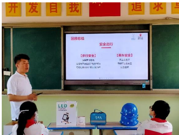
图6 交通安全出行课堂一角

6月，随着疫情的逐步缓解，伙伴们进入学校开展项目活动的频率也越来越高，共开展儿童平安小课堂431节，其中交通课程177节，溺水课程147节，地震课程55节，消防课程52节，共有7161人次的儿童从儿童平安小课堂的安全课程中学习了安全知识，掌握了自我保护的技能。