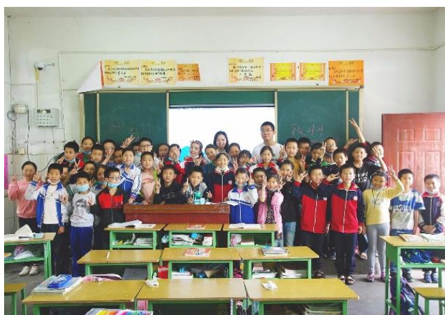
图8 课程结束后的大合影