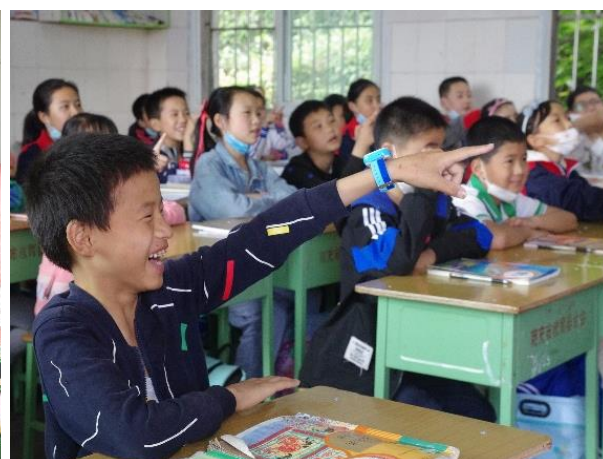
图9 老师，那个是不安全的

丰富多彩的减灾主题活动也在6月的校园中轮番上演，溺水中的憋气比赛，火灾中的烟道逃生，地震中的应急包分装，交通中的鸡蛋头盔实验……一个又一个减灾主题活动各种有趣又有效的活动形式在学校开展，让孩子们在游戏的过程中学习安全知识和技能。甘肃、云南、陕西、江西等地的伙伴共开展29场大大小小的减灾主题活动，共有4245人次的孩子参与到活动中，通过游戏的方式学习安全知识和技能。