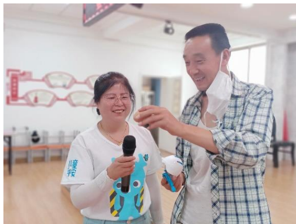
图5 甘肃平凉教师工作坊中专职与老师互动