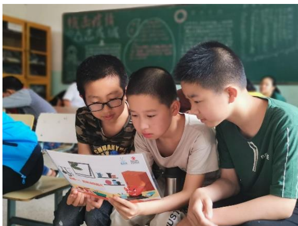
图7 三位小伙伴认证一起看项目手册