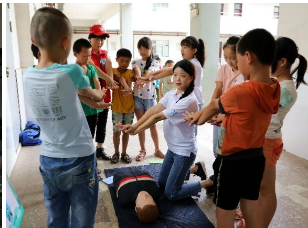
图 11 和老师一起学习心肺复苏技能