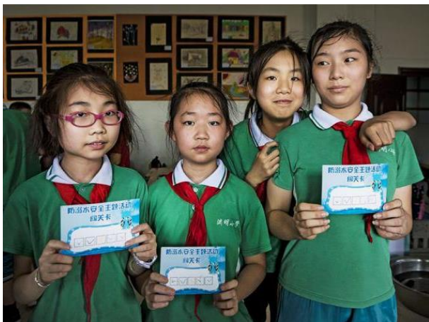
图 10 防溺水安全主题活动闯关 4 人组