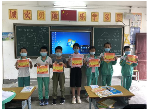
广东省兴宁市项目学校开展“我是净水小能手”线上主题手抄报活动