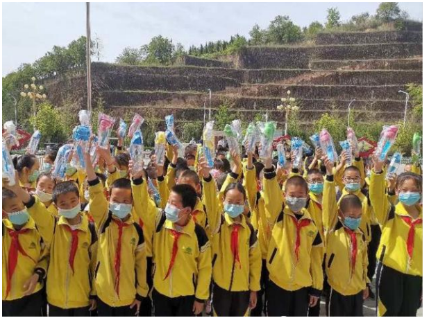
甘肃省庆阳市蒲公英志愿者协会前往项目学校发放安全水杯