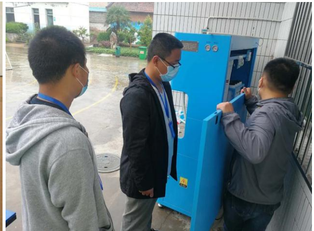
5月7-10日，陕西省宝鸡市金台区社区志愿服务联合会与厂家工程师对项目学校净水设备进行检测维护