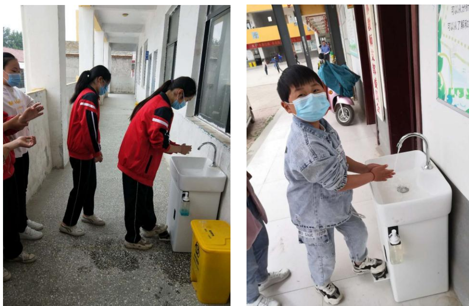
安徽省宿州阳光天使公益助学中心走访砀山县项目学校洗手台使用情况