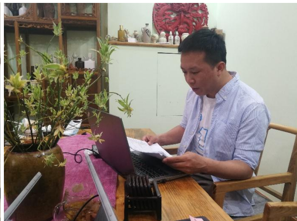
5月28日，2020年壹基金净水计划项目线上启动会伙伴参会打卡照与现场照