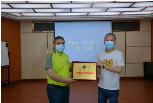
表彰广东省联合救灾伙伴

有关紧急救灾的总结，一方面针对 2019 年广东省的救灾行动进行了总结，梳理了救灾行动中经验和不足；另一方面重点针对政社关系营建进行了培训，并分享了灾情评估、需求分析、物资发放的技巧。有关筹资分享和实战讨论，既有筹款新思维训练营的理论分享，也有结合本省筹款项目的实战，最终识别了项目筹款捐赠人群体，并提出了“一对一的结对帮扶”的方案，弥补筹资和行动的不足。有关财务管理培训和项目答疑，一方面统一标准，另一方面识别伙伴在项目执行过程中的困难，并现场提出解决方案。