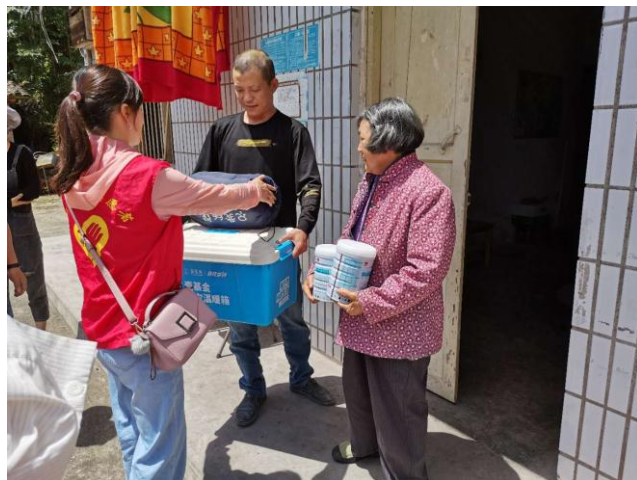
重庆梁平救灾温暖箱发放

5月10日至15日，壹基金联合救灾-重庆伙伴先后到梁山街道、鸭江镇、羊角镇、庙垭乡、白马镇、武陵镇、郭村镇发放救灾温暖箱40个，睡袋20个，温暖包（夏季适用）710个，折叠床20张。