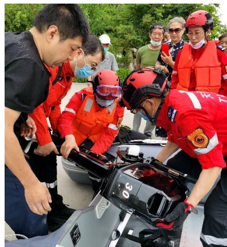
山西救援演练操作救生艇