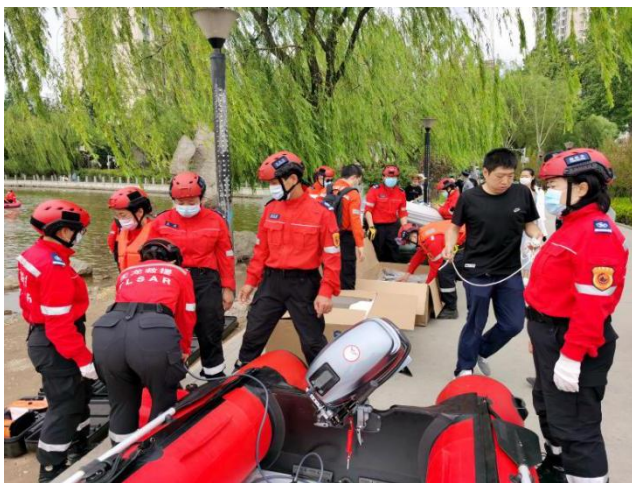
山西救援演练熟悉装备中