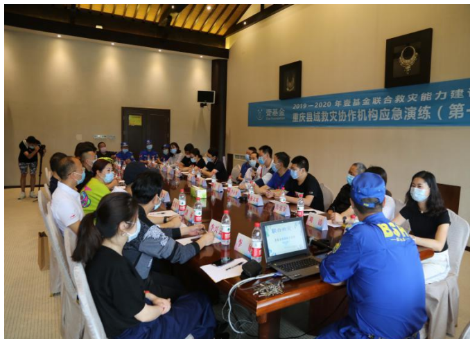
重庆伙伴讨论救灾协作机制