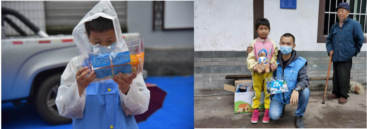
重庆武隆物资发放