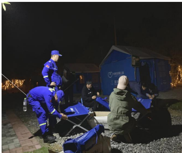
重庆伙伴演练搭建帐篷

本次演练，进一步完善了重庆联合救灾网络应急救援响应机制，提高了重庆联合救灾网络各伙伴机构灾害响应的协作能力。