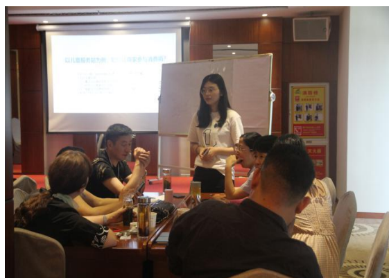
支付宝平台筹款培训现场