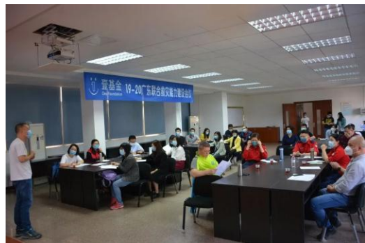
广东省能建培训现场