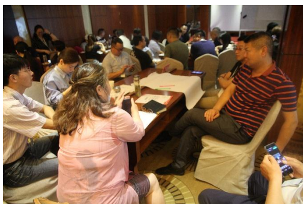
联合救灾会议讨论现场

2020 年 5 月 29 日-5 月 31 日，安徽省 39 家伙伴机构，45 名工作人员及志愿者参与安徽省—2019 年安徽省壹基金能力建设会议暨温暖包总结会。此次会议进行了安徽省联合救灾内部建设治理，经过讨论，安徽 2020 年的工作重心将会放在做到全省、市、县区的全覆盖，以更大程度地实现属地救援；同时扶持新机构的发展，以壮大伙伴的力量。此外，在壹基金公众捐赠人发展部的支持下，活动现场还为伙伴分享了支付宝平台筹款的方法和技巧，拓展了伙伴筹资的渠道。