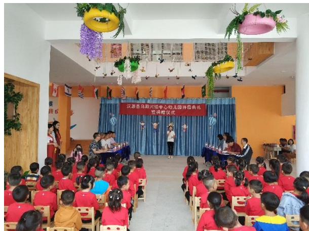
乌斯河幼儿园开园典礼现场