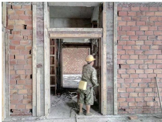
天全县大坪乡中心幼儿园地坪及室内墙面施工

9月，壹基金援建雅安乡村幼儿园项目中的汉源枣林幼儿园及天全大坪幼儿园主体施工正如火如荼的顺利开展。大坪幼儿园截止9月底围墙砌体接近尾声，开始外墙保温及室内地坪施工。枣林主体完成，开始二次结构柱及填充墙砌体，内外墙抹灰施工。