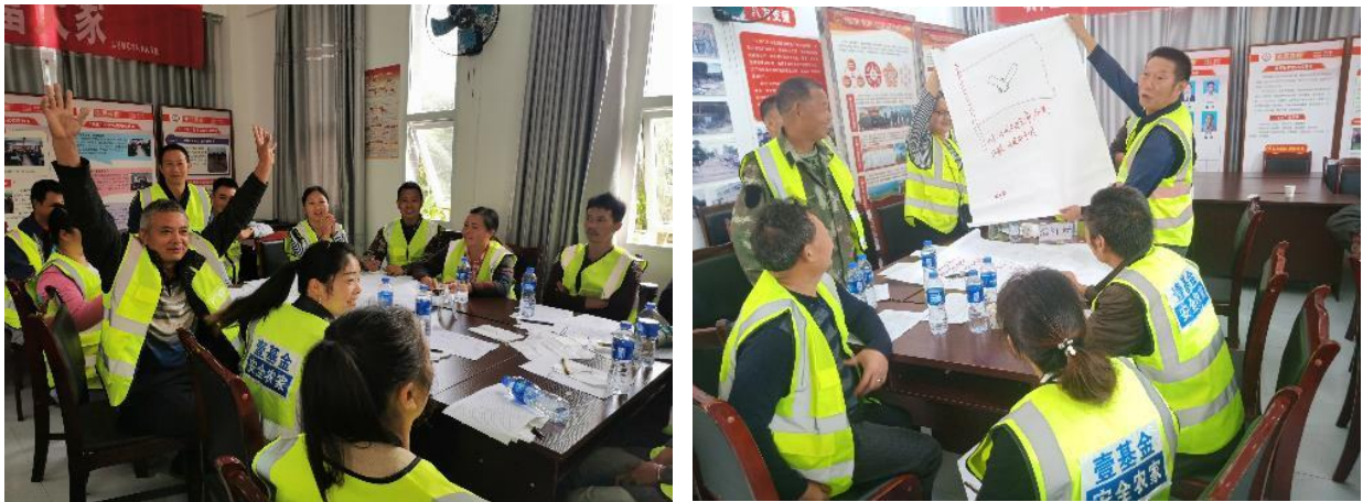
队伍章程制度讨论及展示