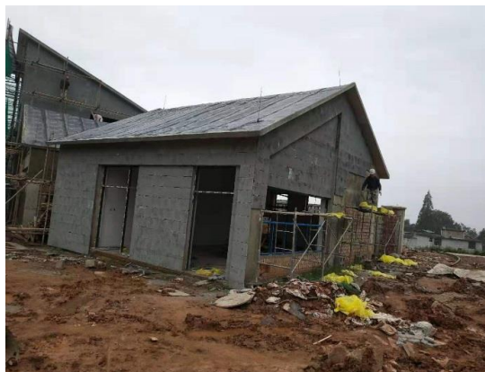
天全县大坪乡中心幼儿园外墙保温施工