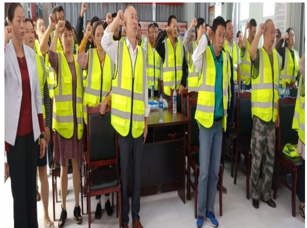
队员宣誓志愿加入队伍