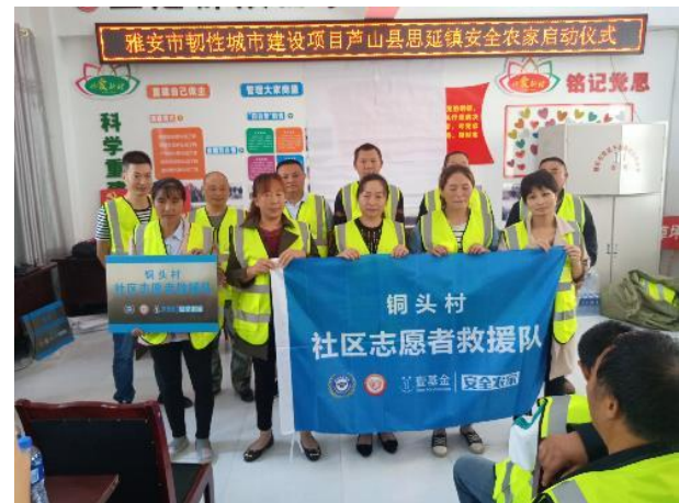
成立大会合影、领导激励、团队游戏、授旗等