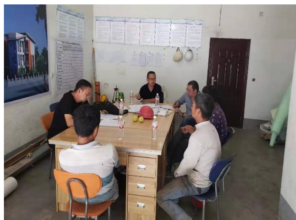
汉源县九襄镇枣林村幼儿园安全进度协调会