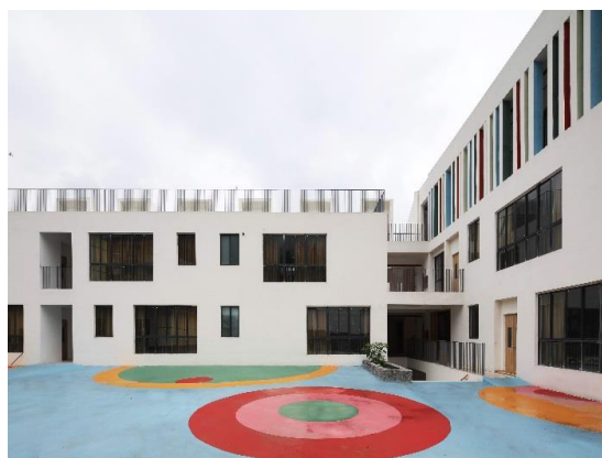
崭新的乌斯河幼儿园