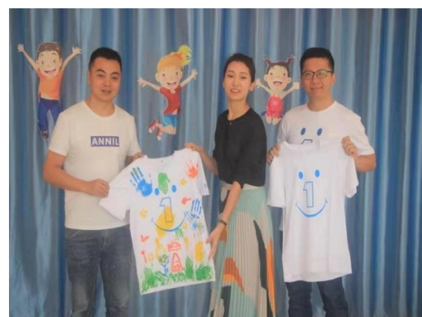
雅安乡村幼儿园园服捐赠仪式