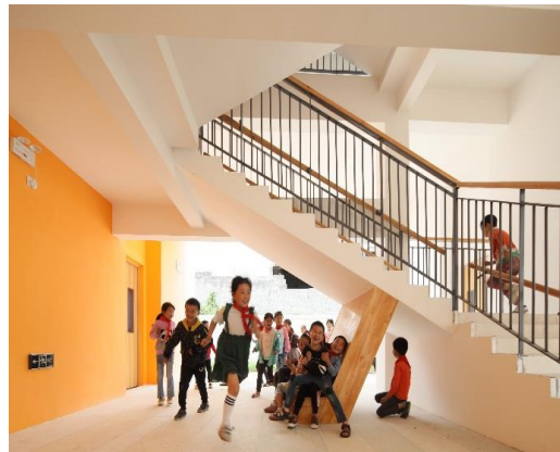
投入使用的乌斯河幼儿园