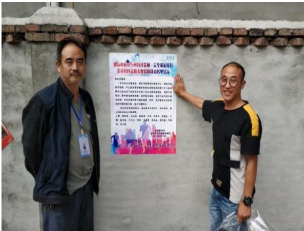
张贴公开招募公告

目前，已在芦山县 6 个乡镇完成了项目启动仪式暨社区志愿者救援队成立大会。会上，邀请了各乡镇政府、区县应急管理局等相关单位领导出席，并统一宣讲该项目内容，阐述队伍成立的意义，组织队伍第一次团队建设，最后由上级主管单位为队伍授旗。