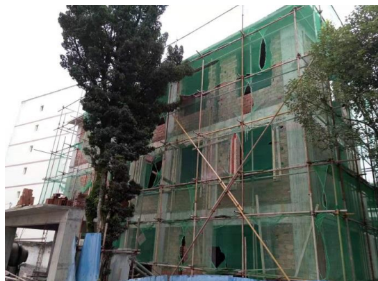
汉源县九襄镇枣林村幼儿园北立面形象进度