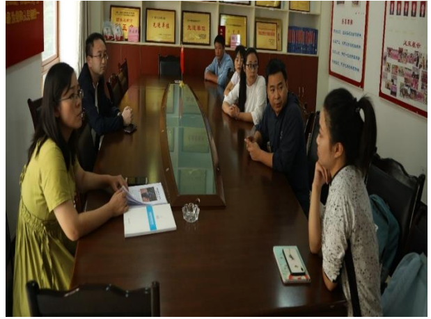
项目人员入村与当地居民交流、与政府工作人员对接项目