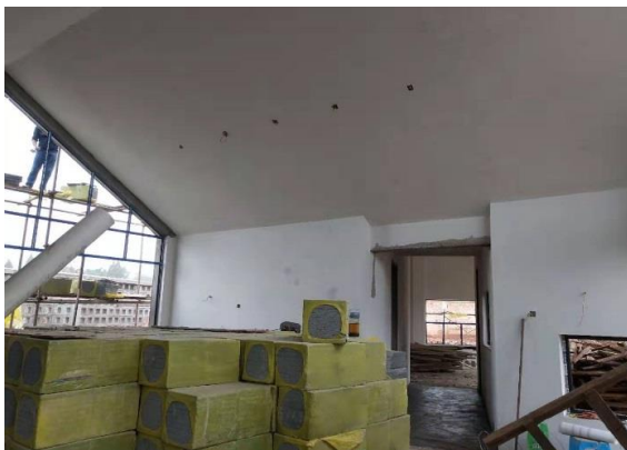
汉源县九襄镇枣林村幼儿园门窗二次结构浇筑