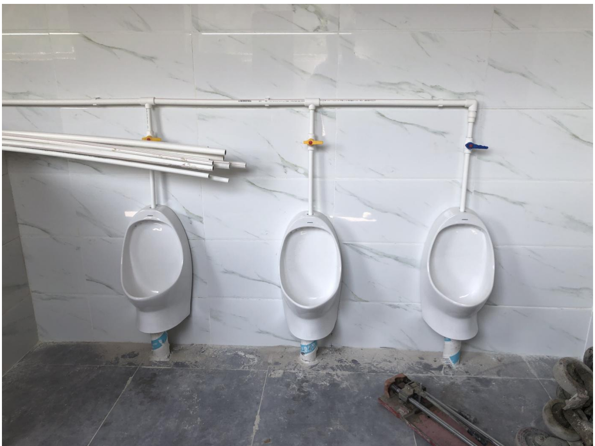
北坪小学安装完成的小便池