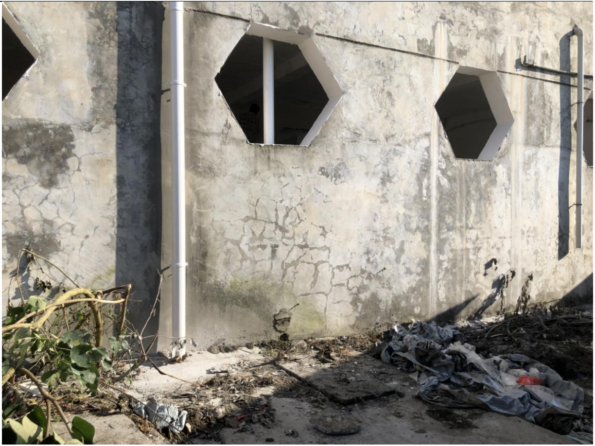
龙坪小学更换新的排污管道