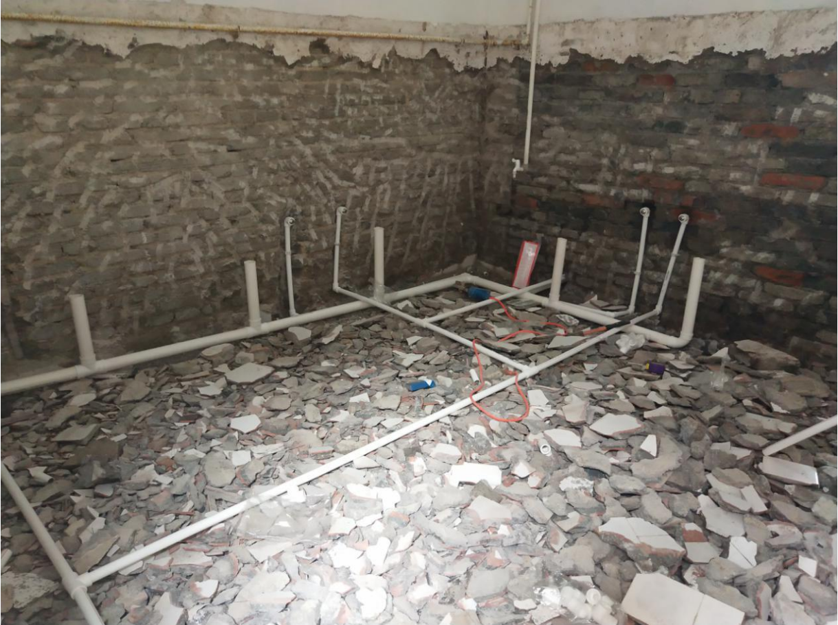
乌江小学厕所内部改造，重新设计蹲便器位置

① 乌江小学由于人数 941 人，学校学生公用一楼的厕所，厕所蹲位不够。学校原来二楼也设有厕所，但是由于原来的施工问题，排水及渗漏比较严重，所以关停。