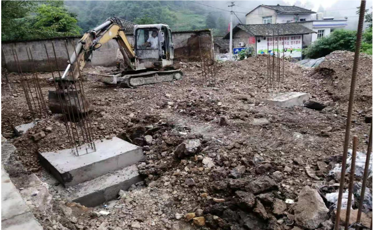
高王小学厕所完成地基的建设，正在进行地基回填

高王小学 8 月 5 日动工拆除原有厕所，修建新厕所。厕所建设的标准为 2 层，一楼是男女卫生间，二楼是男女的洗漱间。高王小学暑期受天气（暴雨）影响施工进度比价慢，目前为止（10 月 10 日）厕所修建主题已经完成，厕所内部墙砖施工完成，正在安装洁具，预计 10 月底投入使用。