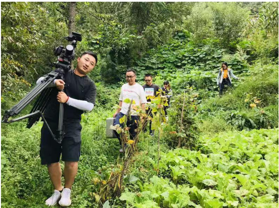
拍摄组手持设备穿梭林间小路，走访水源地