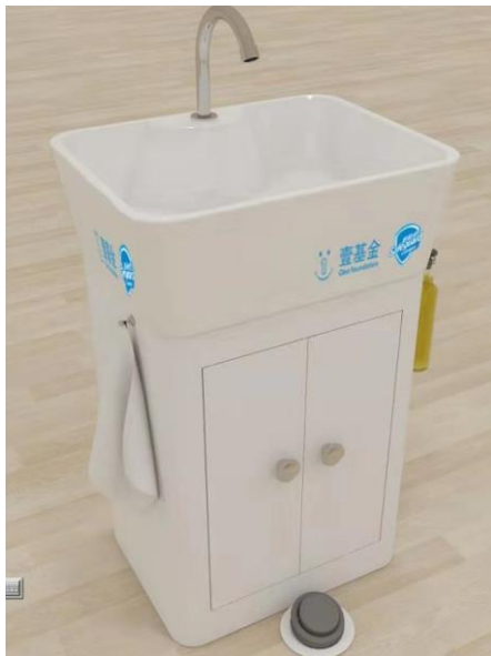
优化后的洗手台和样品 1