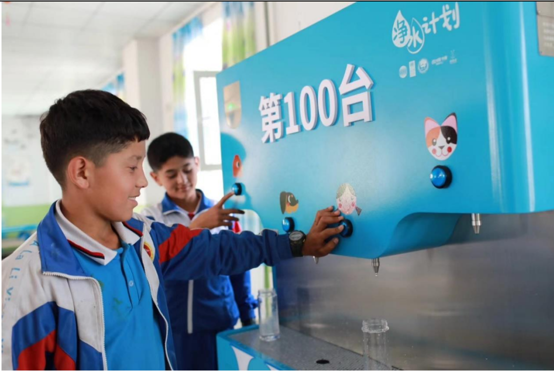
阿拉力乡中学的学生在第 100 台净水设备前接水