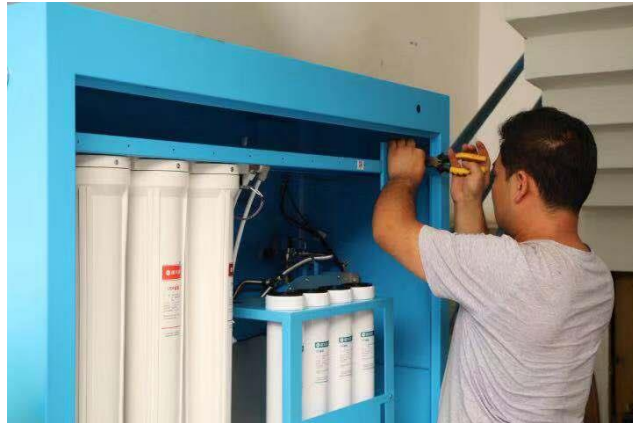
贵州省遵义市汇川区设备安装