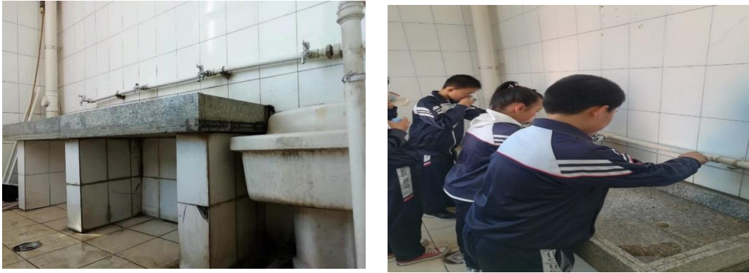
图 1：东港市黑沟学校现有洗手设备