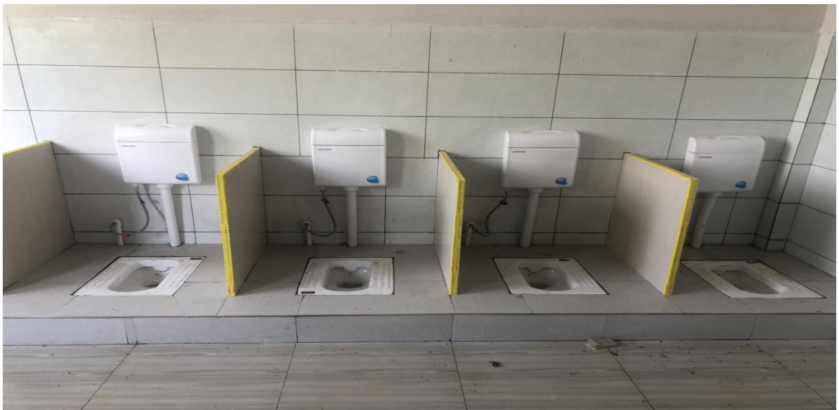
柿坪小学内部修建完成的照片

① 柿坪小学属于教育局厕所改建计划之内的学校，学校原有的厕所已经变更危房，不能够正常使用。壹基金支持工程经费，并获得教育系统配置资金，联合修建柿坪小学的厕所。目前，该工程主体基本已经完成，正在做内部的施工和墙体的施工（8月12日）。