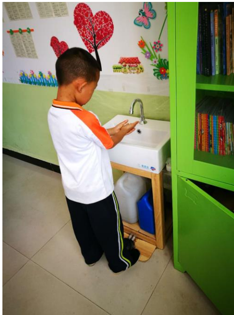
室内洗手台试用版