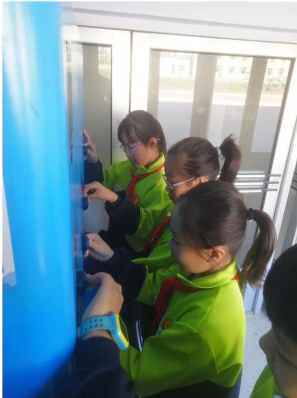
林甸县第四中学学生在饮水机前接水

今年九月一开学我们就发现校园里多了一台崭新的饮水机。大家开心得叫起来：“我们终于有干净的水喝了”。可是它是从哪里来的？带着这个疑问，我去问老师。老师告诉我，“这是壹基金免费给学校的饮水机。”