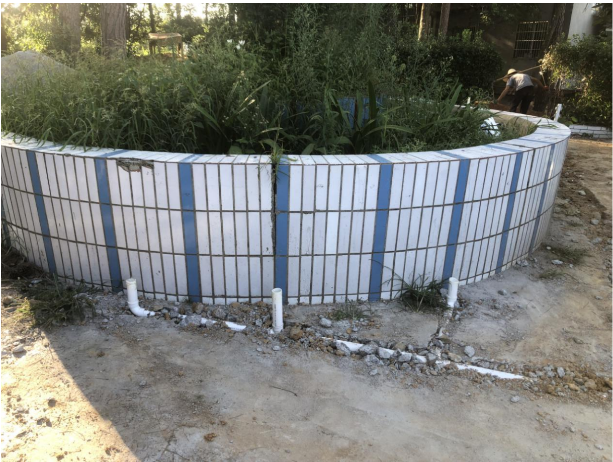
厕所门口洗手台安装位置

兴隆小学从8月3日动工开始修建厕所，施工从学校进门口的左边挖了三级过滤的化粪池，再从学校操场中间挖了深沟预埋了排污管道，将原来的厕所的粪便引入新的化粪池中过滤。9月2日完成厕所的改建工作，现在已经开始投入使用。