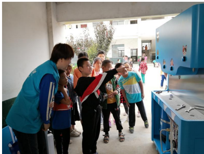
安徽砀山县项目学校课间时间孩子们好奇的围观安装现场