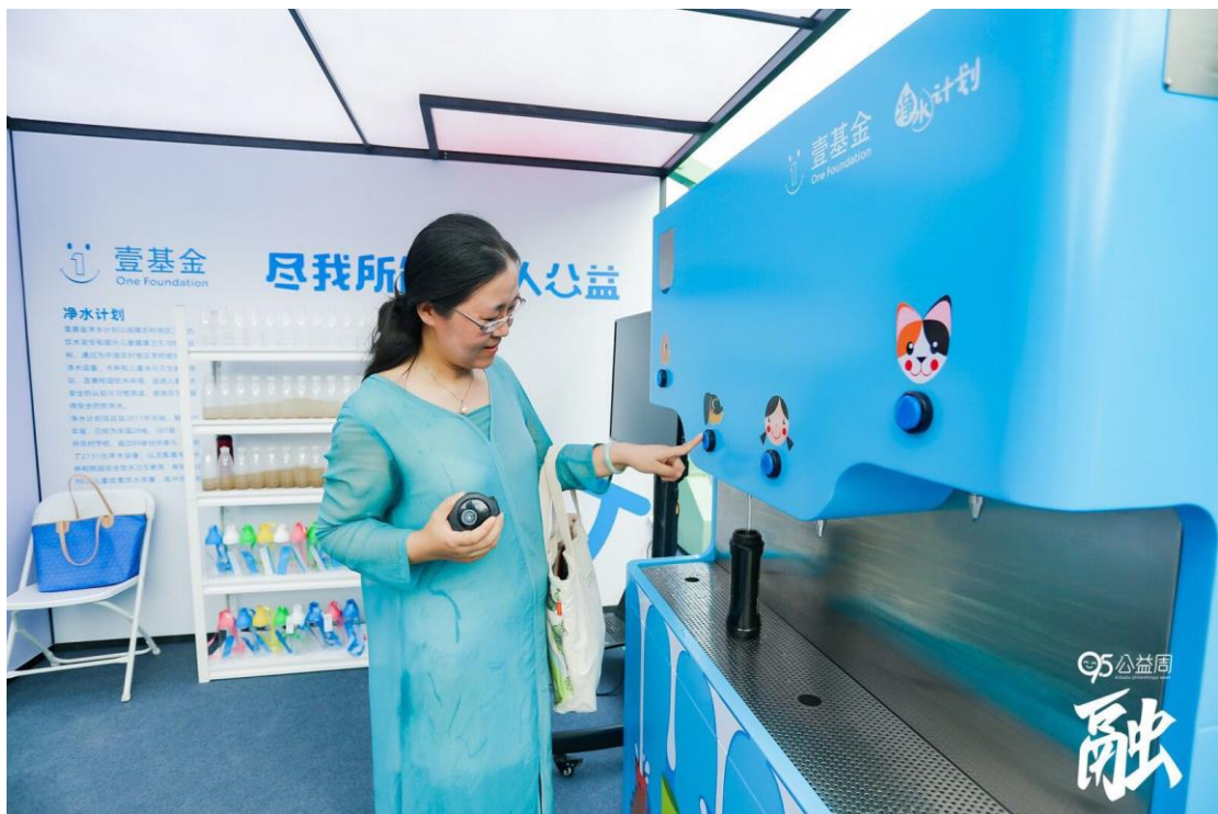
参会嘉宾从净水机接水喝