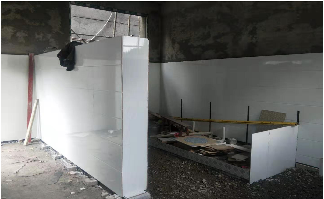
10月2日，高王小学厕所建设开始安装内墙瓷砖和蹲便器的安装

2、遵义市播州区龙坪小学，兴隆小学，大兴小学、乌江小学及乌江镇幼儿园厕所主要出现学生人数较多，学校原有厕所数量不够使用、学校粪便处理不合格、厕所设计不合理，对学生的正常使用