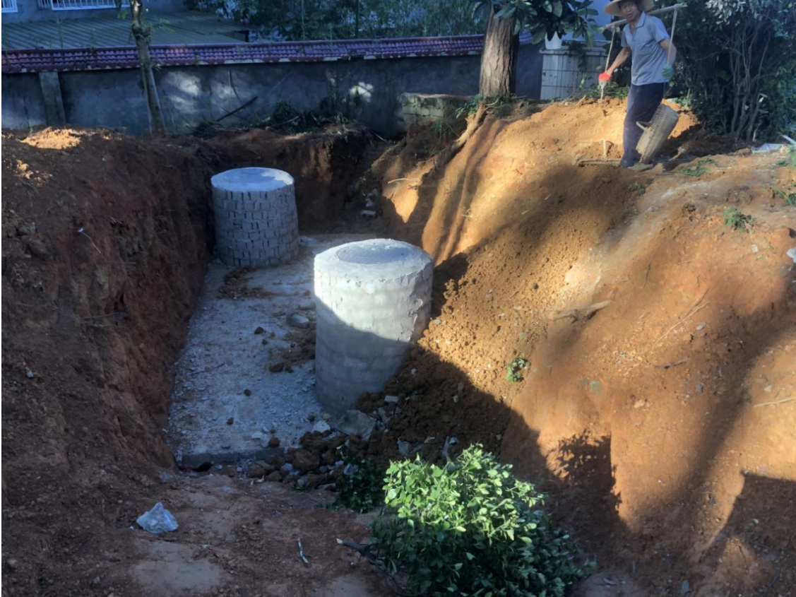
兴隆小学修化粪池

④ 兴隆小学与大兴小学一样，化粪池属于下渗式的厕所，没有专门过滤的化粪池，直接流入厕所背后的田地里面，影响学校周边的生态环境，学校食堂距离厕所较近，卫生存在一定的隐患。