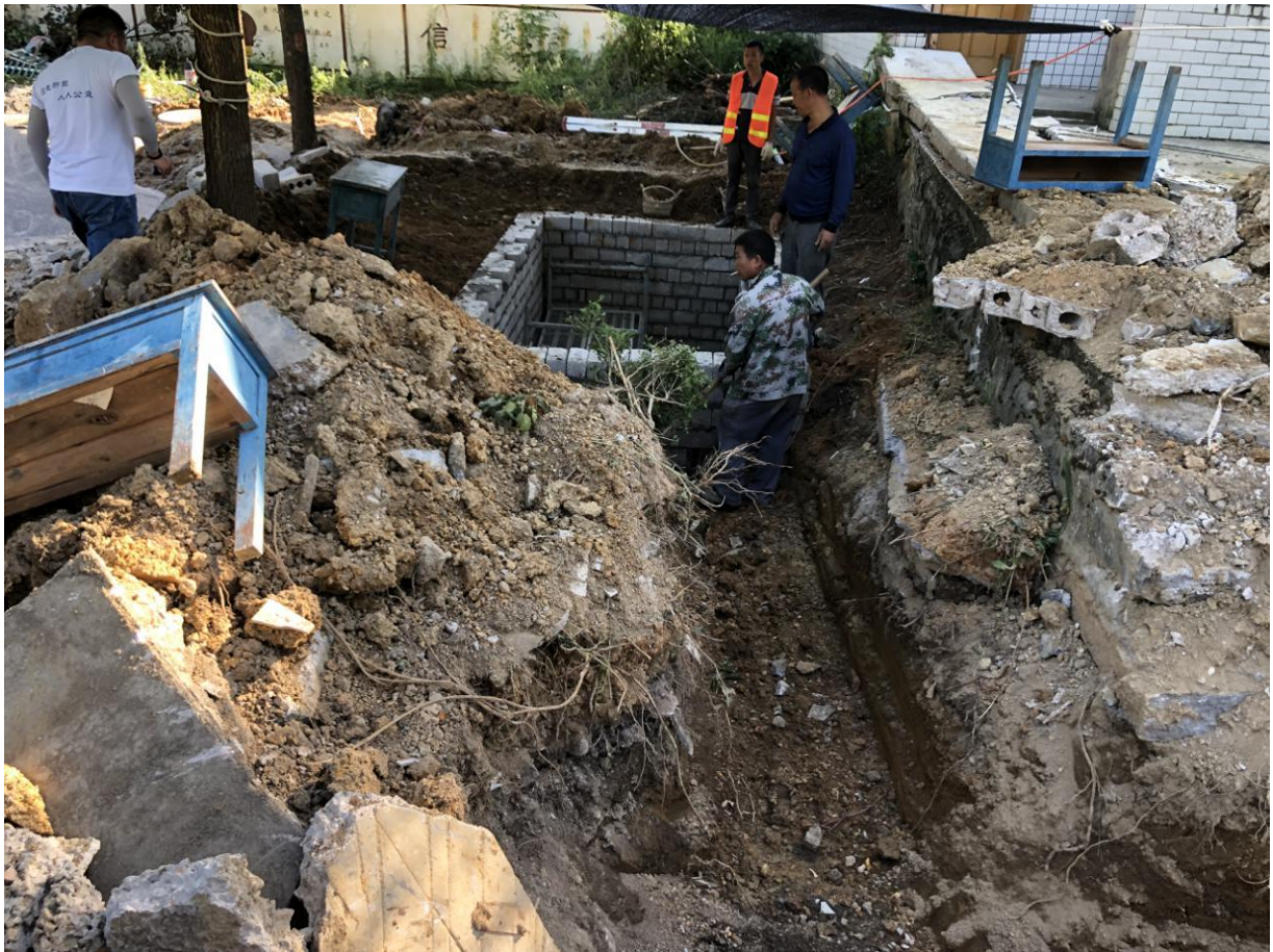
大兴小学重新修建化粪池，此处是二、三级过滤