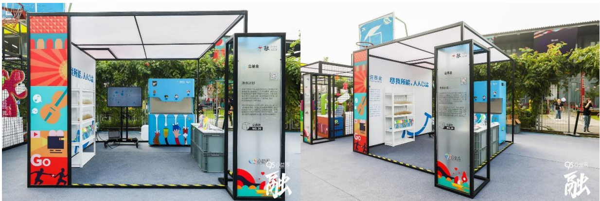
净水计划项目展位

9月5日阿里巴巴中华慈善周在杭州中国美术馆举行，净水项目作为壹基金线下参展项目将安装在学校的净水机在现场展示，很多参观嘉宾详细了解了净水项目的发展，喝到了甘甜的直饮水，对壹基金表示高度的认可与鼓励。