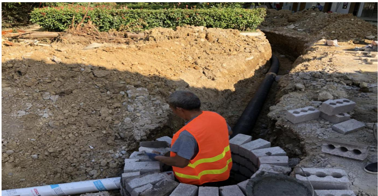
此处为化粪池的第一级过滤

大兴小学厕所从8月3日动工开始修建厕，从厕所旁边新挖了一个三级过滤的化粪池，将原来的