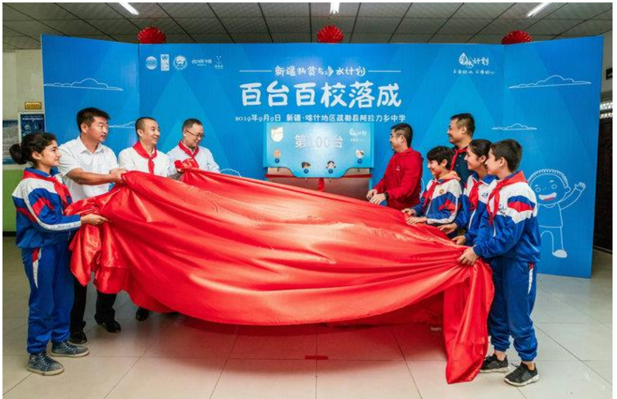
新疆扶贫与净水“百台百校”落成揭幕

2019年9月9日，新疆扶贫与净水计划“百台百校”落成仪式在新疆喀什地区疏勒县阿拉力乡中学举办。商务部中国国际经济技术交流中心、新疆维吾尔自治区扶贫办、可口可乐中国和深圳壹基金公益基金会等项目发起方，自治区教育厅、喀什地区政府、中粮可口可乐（新疆）饮料有限公司、深喀社工站等项目合作方代表共同出席了此次活动，与受益师生代表共同见证“百台百校”目标的实现。