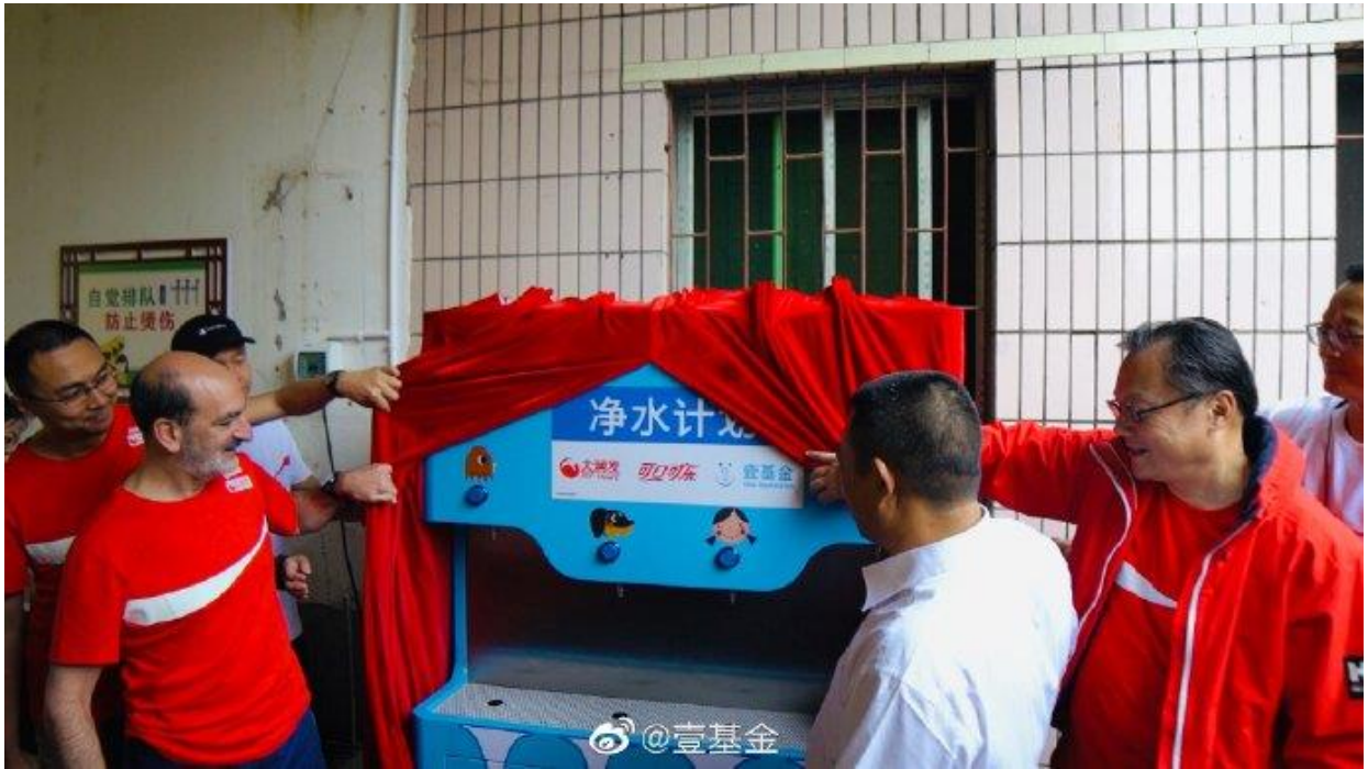
可口可乐和大润发的高层领导一起在重庆新立镇精华小学举行了净水设备捐赠仪式