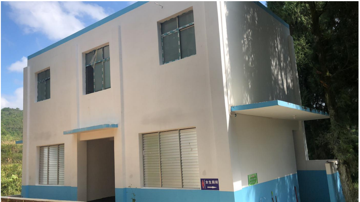
柿坪小学整体厕所图片

9月3日，柿坪小学的外墙已经粉刷完成，蹲坑等洁具已经全部完成，施工完成，等待教育局基建办与施工方的验收。