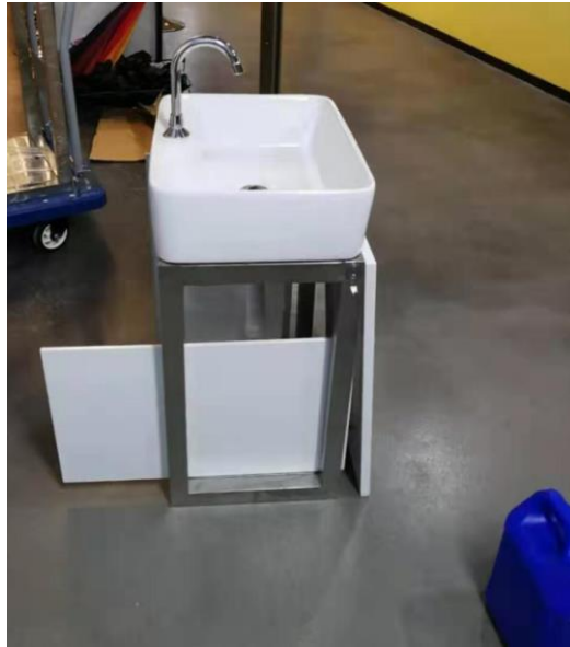
优化后的洗手台和样品 2