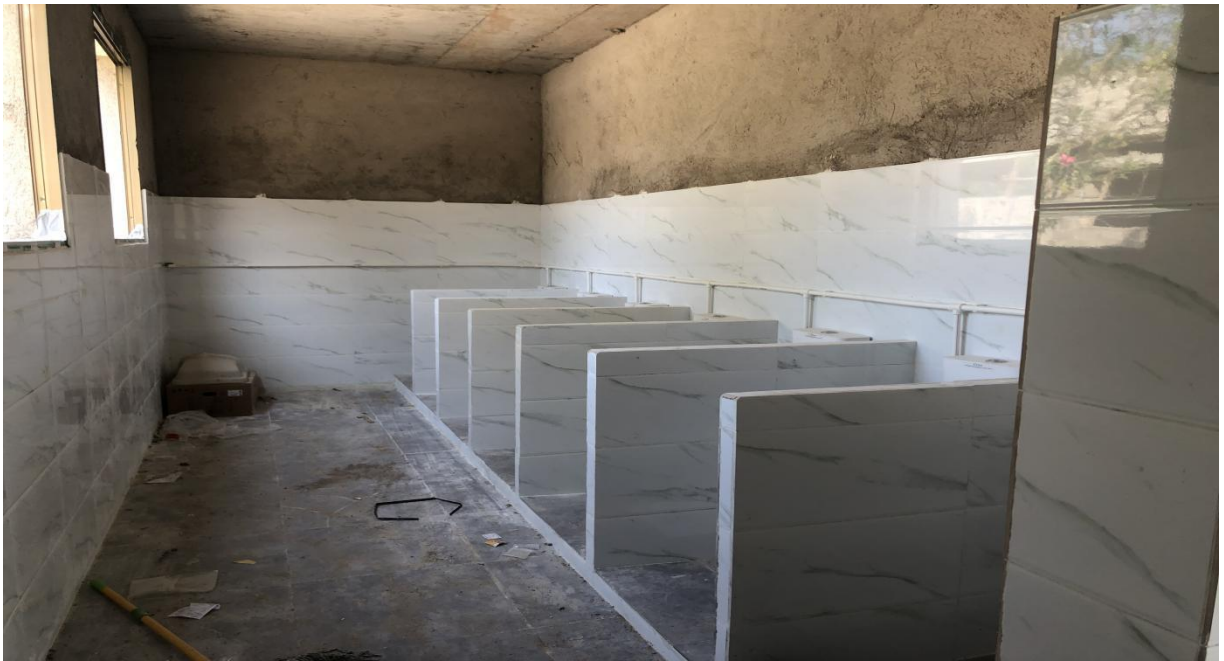
北坪小学厕所蹲位已经完成安装，墙壁还没有施工完成