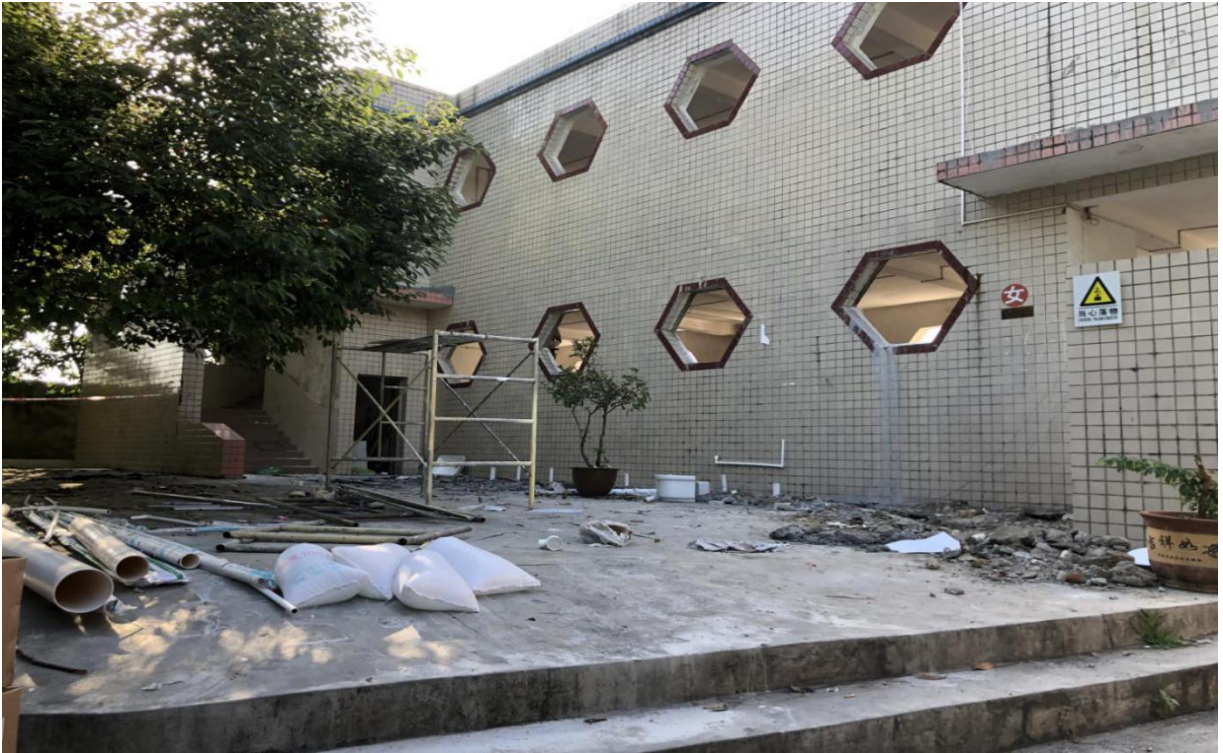
龙坪小学将洗手台放在一楼平台，便于如厕后洗手