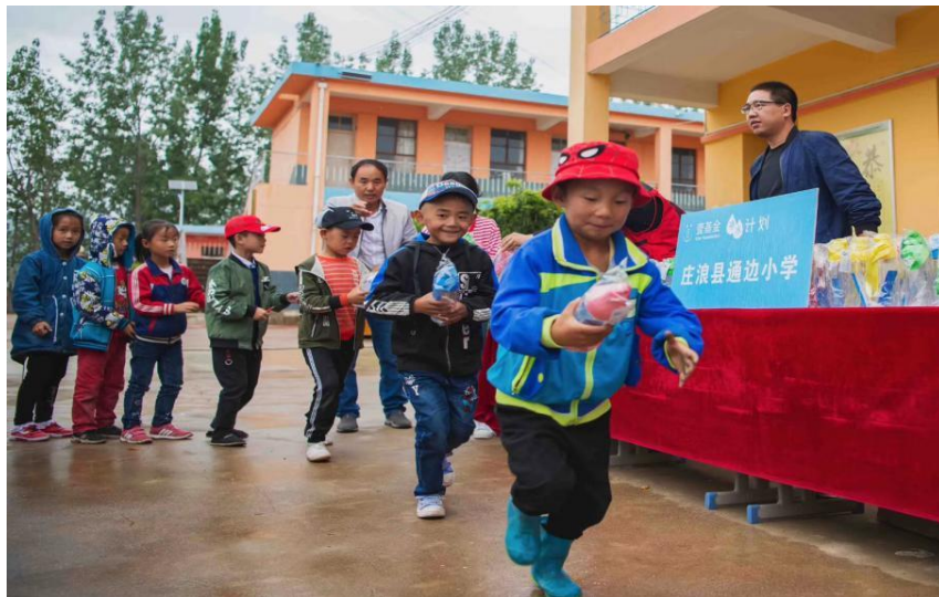
甘肃庄浪县项目学校水杯发放活动