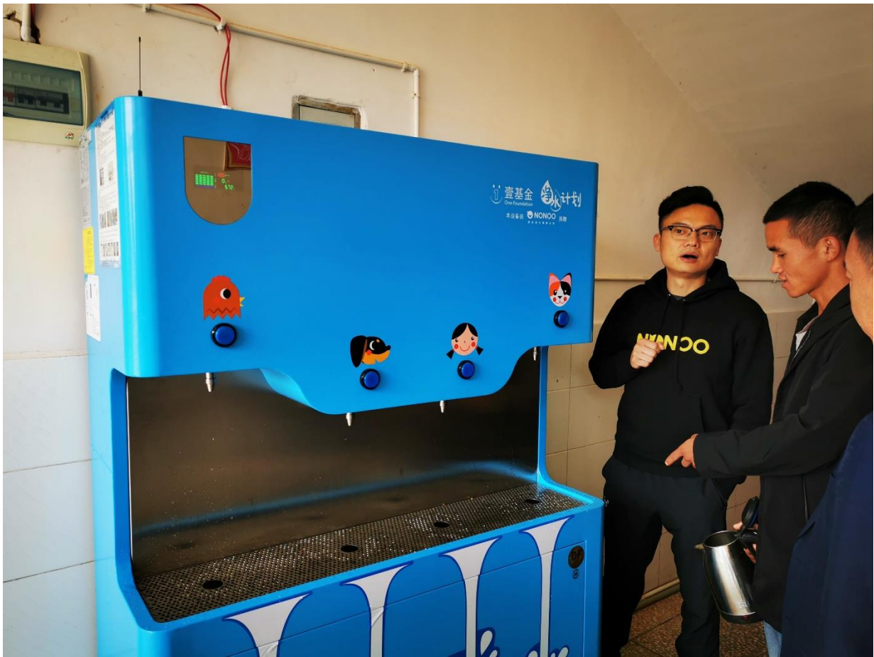
NONOO 探访云南曲靖项目校，企业 CEO 了解净水机使用情况