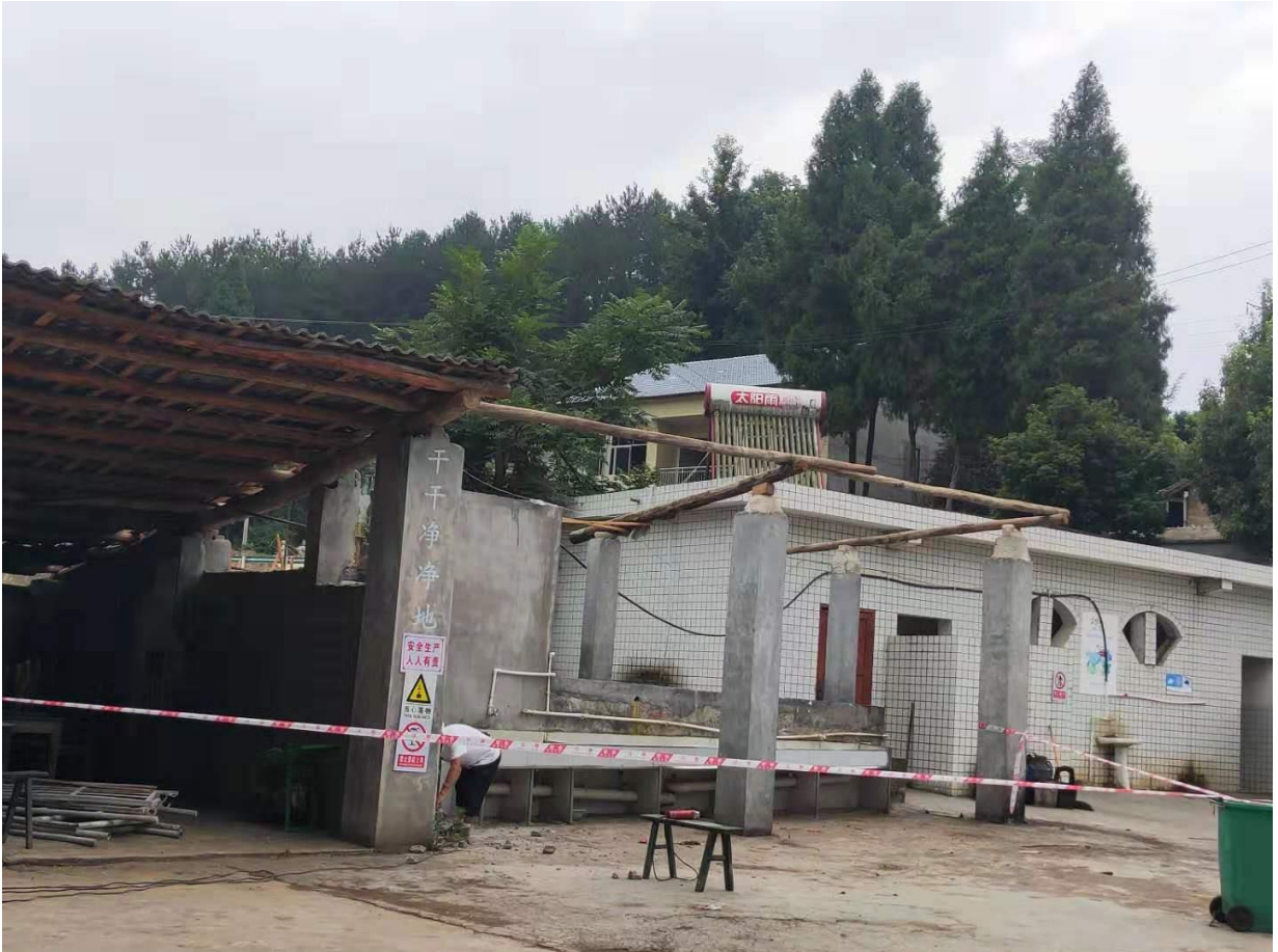
大兴小学原来的厕所

③ 大兴小学厕所化粪池属于下渗式的厕所，没有专门过滤的化粪池，直接流入厕所背后的渠沟里面，影响学校的卫生环境和校园周边的生态环境。学校没有专门洗手设施。