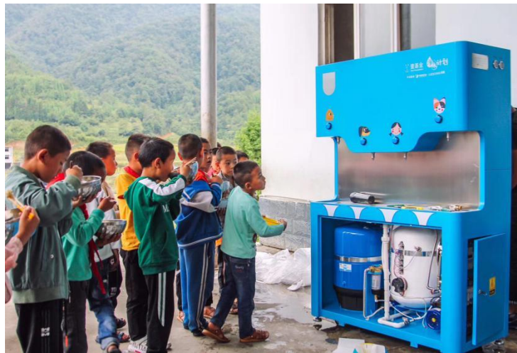
云南省腾冲市项目学校设备安装时孩子们端着午饭好奇的围观