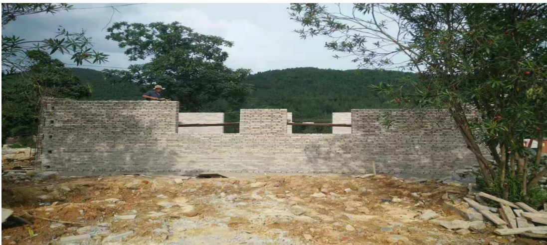
9月13日，北坪小学正在进行厕所主体的施工

北坪小学8月5日开始动工修建厕所，目前为止（10月10日）已经完成洁具的安装，化粪池已经修建完成，厕所内部墙砖与地砖已经施工完成，正在进行墙体内外的粉刷工作。预计10月底投入使用。