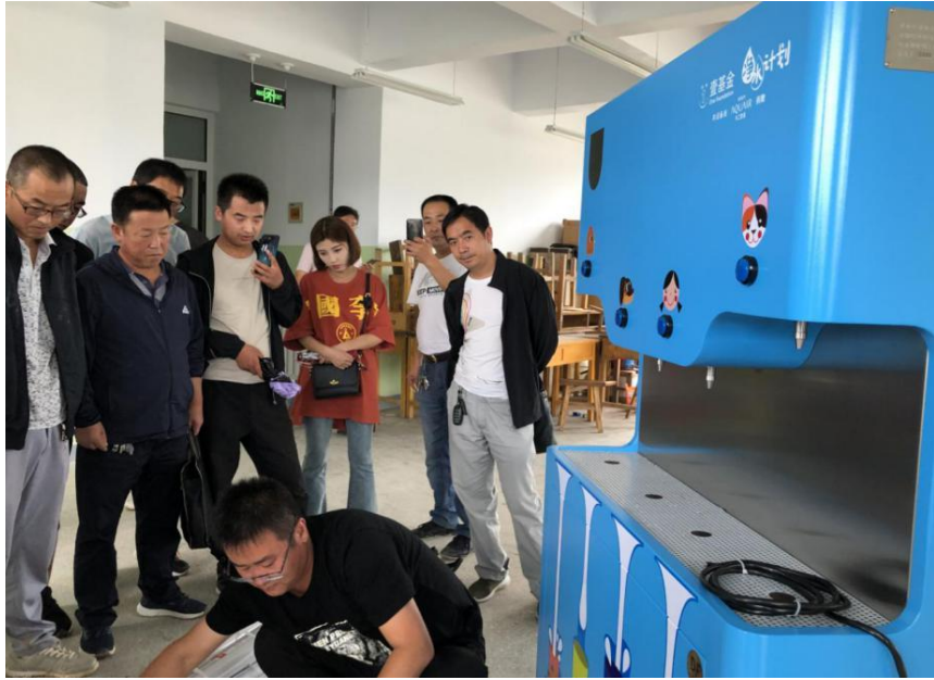
甘肃省秦安县项目学校设备安装