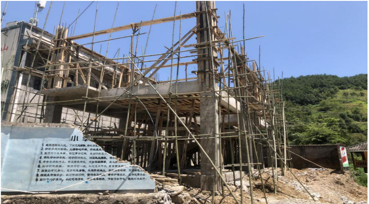
9月3日高王小学完成厕所主体的建设