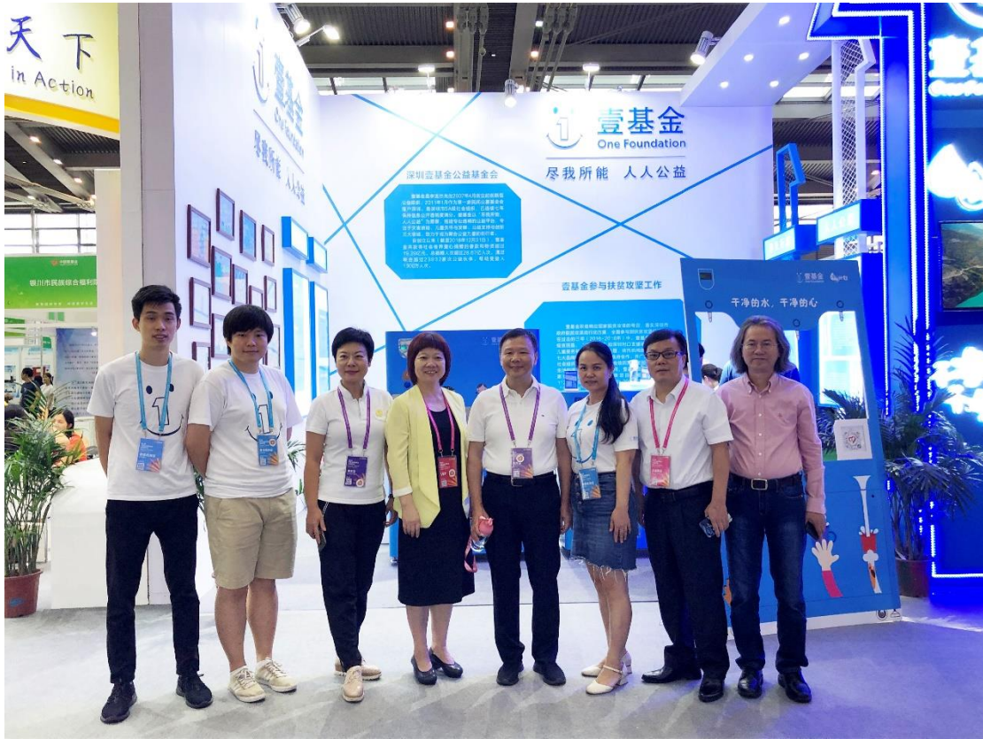
深圳市政协常务副主席、党组副书记、秘书长刘润华与壹基金工作人员亲切合影