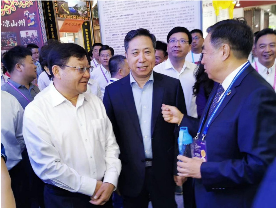
广东省委副书记、深圳市委书记王伟中（左一），民政部党组成员、副部长王爱文（左二），壹基金理事长马蔚华（右一）莅临壹基金展位

9月20-22日，第七届中国公益慈善项目交流展示会在深圳会展中心举行，壹基金净水计划参与此次慈展会，向公众展示净水计划的项目模式，并与到场观众进行了多种形式的项目体验与互动活动，呼吁更多人关注农村地区儿童的饮水安全卫生。