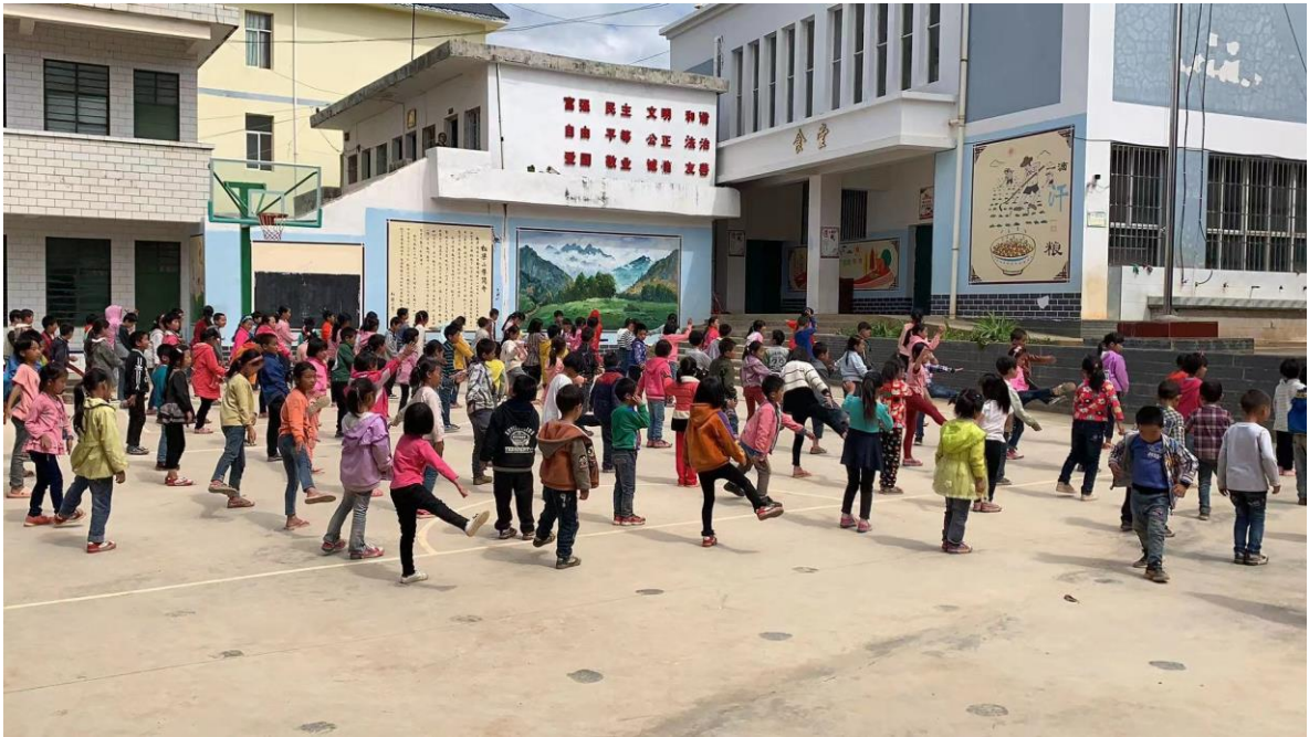
探访白鹤滩镇巧家营松梁小学，学生正在做课间操