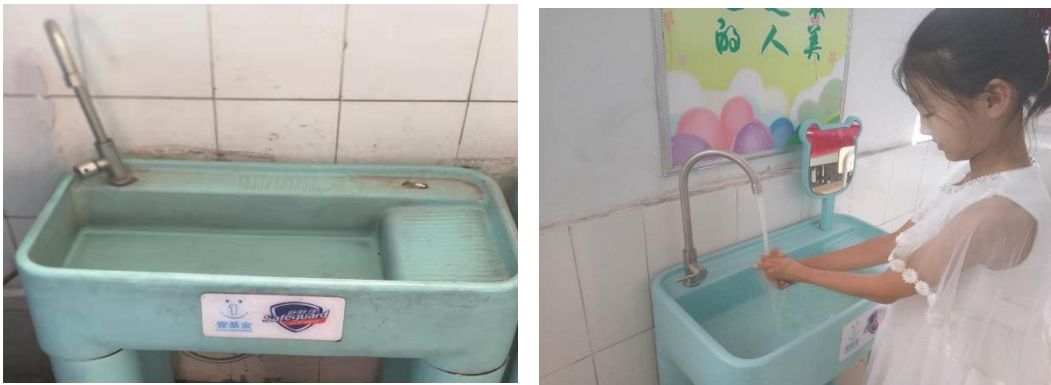
图 2：辽宁省喀左县六官营子镇中心小学现有洗手设备使用情况