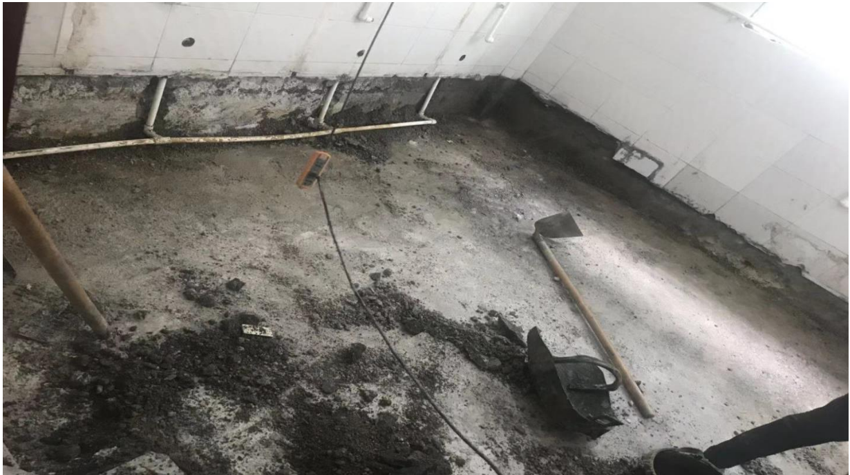
乌江镇幼儿园重新审计内部蹲便和坐便器的位置