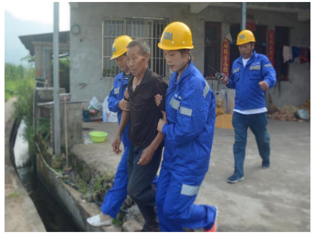
横溪村社区志愿者救援队进行应急演练