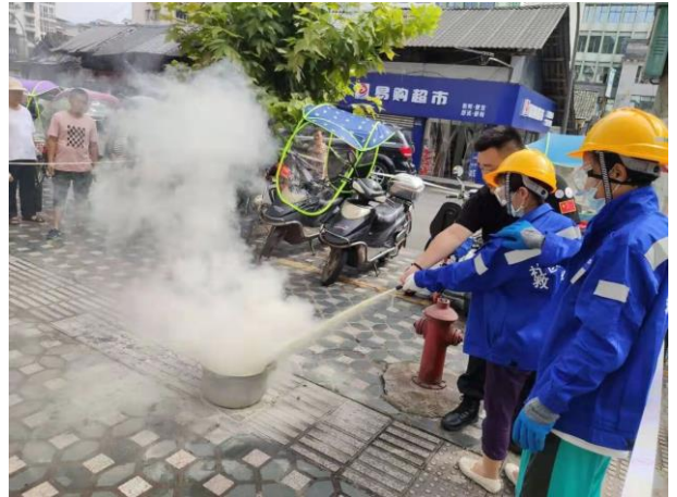
社区救援队员实操