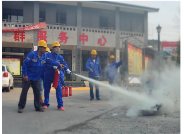
横溪村社区志愿者救援队进行消防复训