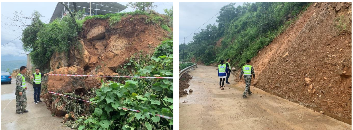
队员们对滑坡隐患点和滚石路段加强巡护，拉起警戒带

8 月正值雨季，经常有暴雨、地质灾害等预警信息发布，四川省雅安市汉源县马落村等 2 个项目点的社区志愿者救援队加强了灾害隐患点的巡护工作，尤其在“8·22”洪灾期间虽然汉源县没有太受影响，但队员们还是加强了巡护了备勤工作。