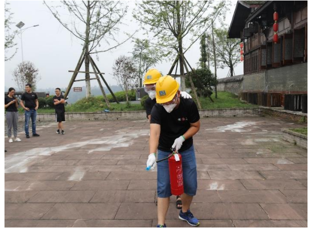
学员分组参与了为期 2 天的参与式培训