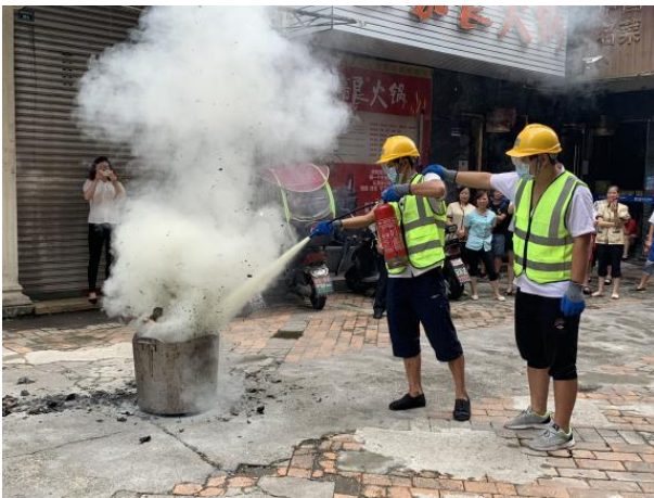
分组进行灭火操作