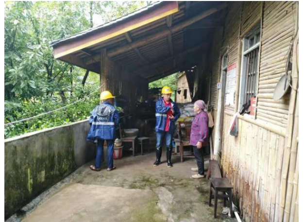
劝说疏散脆弱人群