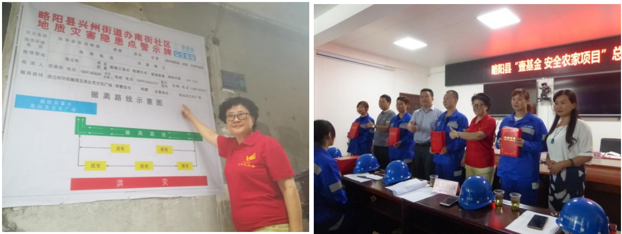
街道办领导为壹基金安全家园项目 4 支优秀志愿者救援队优秀、志愿者代表颁发奖牌、荣誉证书