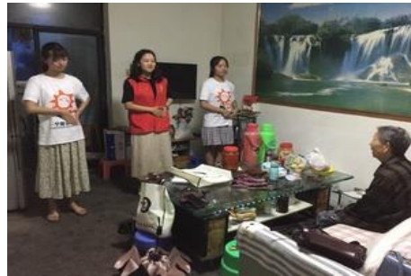
一个观众的剧场入户