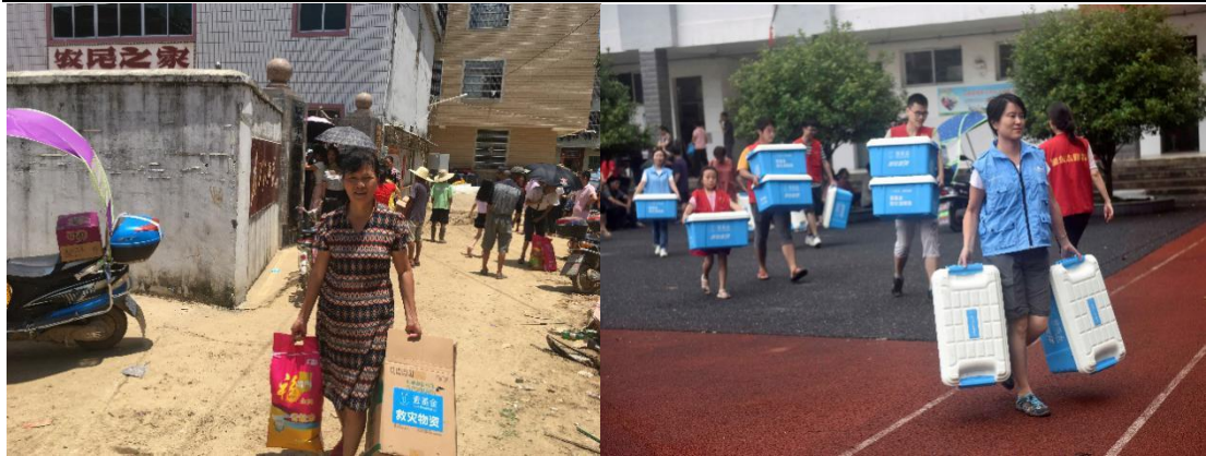
(左图：江西坝溪村物资发放；右图：壹基金志愿者在江西湘东小学)