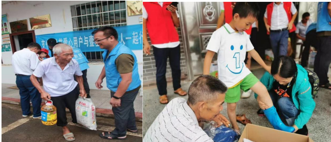
（左图：湖南受灾老人领取粮油；右图：受灾儿童试穿温暖包雨鞋）