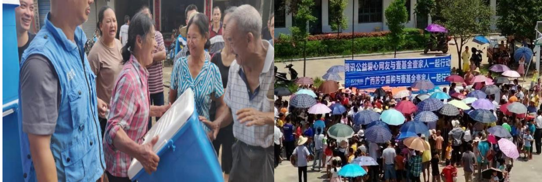
（上图：壹基金伙伴在广西柳州响应救援）