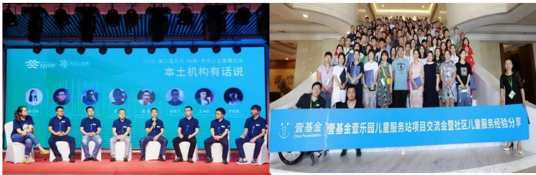
（上图：东三省论坛分享现场）

2019年7月6日，壹基金能力建设项目吉林伙伴在吉林长春举办第三届东北（长春）青年公益发展论坛，本论坛共有东北地区三省161家机构，220位公益组织伙伴参与。论坛会分主论坛和平行论坛，主论坛上就区域链接与本土融通创新、基金会视角看东北儿童项目发展、助力草根公益成长、筹款人的自我修养、县域社会组织助推公益事业的本土化和持续化发展等议题进行了探讨。平行论坛议题主要围绕“项目背景下的儿童伤害预防与保护、东北公益组织的成长，公益组织能力建设、信息化工具应对项目财务审批、盘活有限资源设计o2o筹款活动等议题进行探讨。