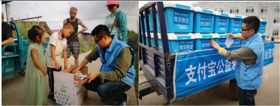
（左图：壹基金伙伴向孩子展示温暖箱物资；右图：支付宝公益救援物资到达灾区）