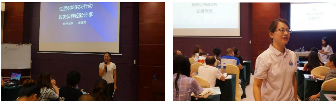
（左图：救灾行动伙伴经验分享；右图：南昌儿童平安讲师志愿者演示交通安全课程）

7月21至26日，2019年壹基金江西公益伙伴游学计划在南昌开展，壹基金江西公益伙伴实地参访壹基金雅安项目基地，就组织治理、项目管理、筹资、机构发展开展学习交流。据统计，共有85个社会公益组织的107名工作人员参与了本次江西联合救灾项目。