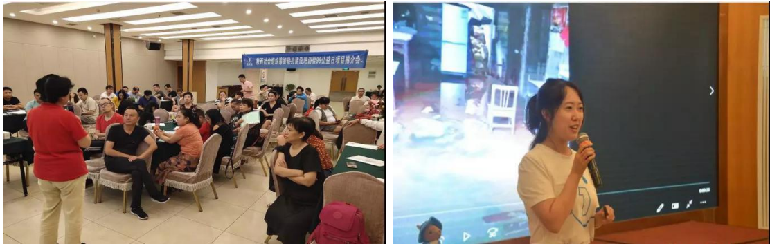
(上图：培训会分享现场)

项目计划，用更多的公益项目去服务不同的更多的人群，为社会的发展与前进做出公益机构应有的责任与使命。