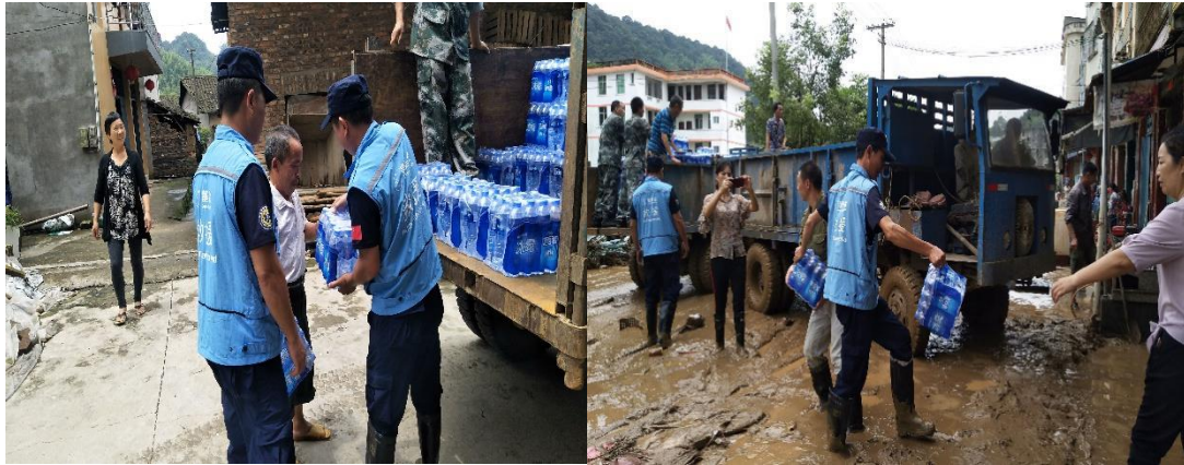
（上图：壹基金当地伙伴在福建灾区发放可乐冰露水）

参与行动的一线伙伴： 浦城县小丹桂青少年社会工作服务中心、福建省中安防减灾服务中心、漳平市曙光救援协会