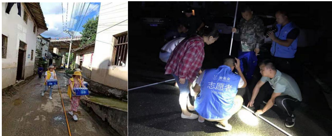
(左图：志愿者搬发放可乐冰露水；右图：壹基金当地伙伴连夜搭建帐篷)