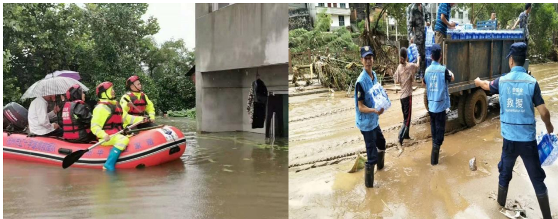
（左图：江西瑞金水灾救援行动；右图：福建顺昌水灾救援行动）

2019年7月救援联盟项目开展救援行动4次，分别为江西瑞金水灾救援、广西桂林灵川洪灾救援、福建顺昌水灾救援、湖南株洲天元洪灾救援。