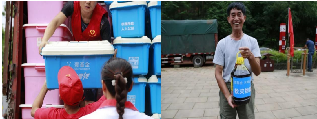
（左图：救灾箱在四川乐山卸货；右图：领到救灾物资-食用油的村民）

参与行动的一线伙伴： 四川原点公益慈善中心、成都新秋减防灾公益服务中心、达州市众爱社会工作服务中心、乐山善诚志愿者协会