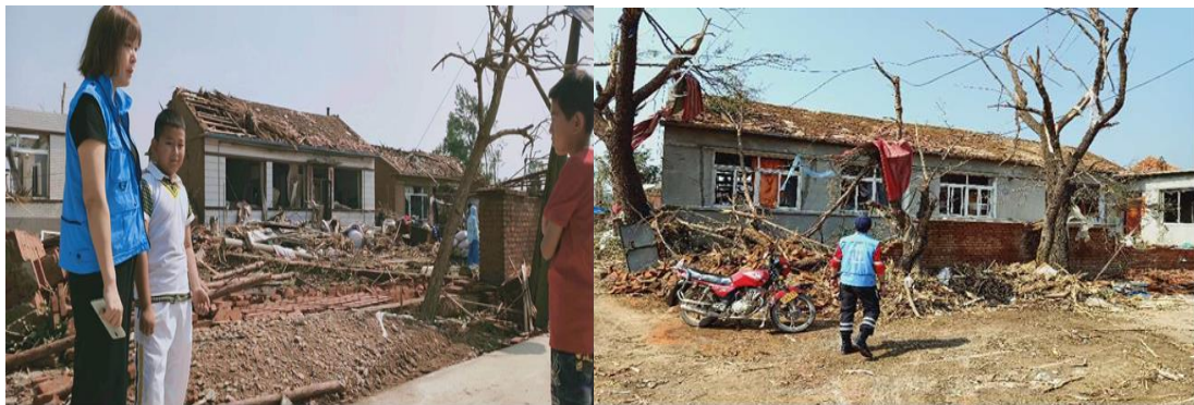
(上图：壹基金联合救灾项目辽宁伙伴评估灾情)

参与行动的一线伙伴： 沈阳市利州公益事业发展中心、沈阳市守护者应急救援队、开原红十字救援队、辽宁利州志愿者联盟、本溪弘益社会工作发展中心、沈阳市皇姑区非公党建促进会、沈阳市天优公益服务中心、沈阳市和平区英紫社会工作服务中心、铁岭阳光慈善爱心义工团。