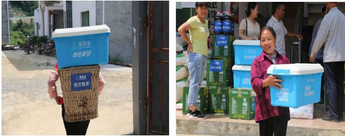
（上图：领取救灾物资的遵义村民）

进行评估，并为受灾区域群众回应大米 50 袋，食用油 100 桶，食用盐 250 袋、救灾温暖箱 98 个和壹基金温暖包（夏季适用）11 个。