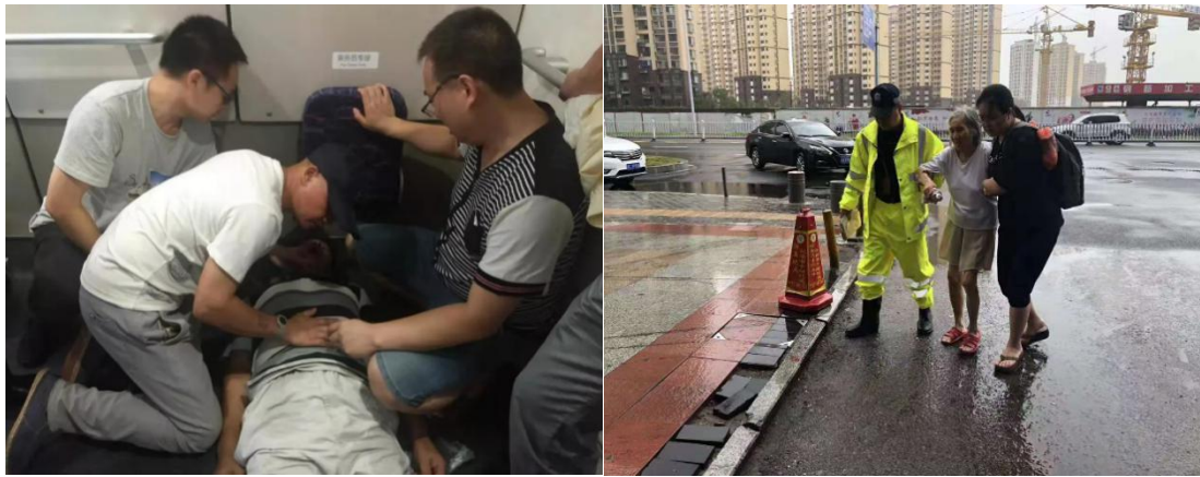
（左图：广东中山动车乘客紧急救援；右图：江西暴雨积水转移受灾老人）

另外，本月壹基金救援联盟项目开展 8 次培训活动，地区涉及海南、广西、江西、湖南、山西、河北、河南 7 个省份。