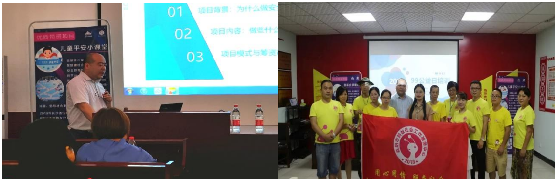
(左图：岳阳培训现场解读儿童平安小课堂；右图：益阳培训会合影)

7 月 17 日、28 日，“腾讯 99 公益日”筹款专题培训分别在湖南岳阳、益阳召开，来自湖南省民间联合救援机构的 16 家社会组织、75 位志愿者协会相关负责人参加培训。培训会介绍了壹基金温暖包、儿童平安小课堂、儿童服务站项目，还对 2019 年腾讯 99 公益日规则进行了解读，协助各社会组织入驻腾讯公益平台、发布项目，并教会大家如何发起子计划、引入企业配捐、开展线上线下筹款活动。