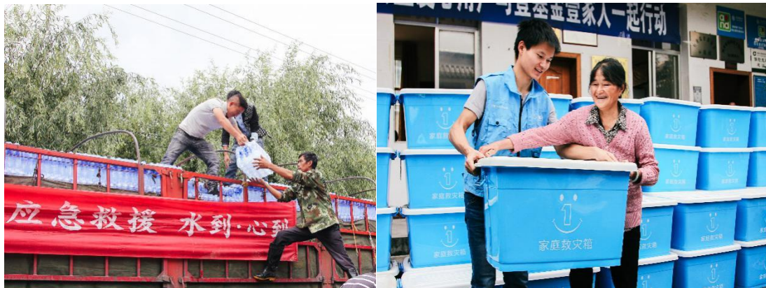
（左图：冰露水在猴桥镇卸货；右图：受灾群众领取救灾物资-家庭救灾箱）