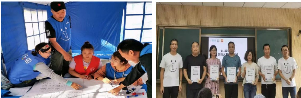
（左图：社会组织成员制定救灾预案；右图：第三届甘肃公益创投大赛获资助机构合影）

7 月 21 日，为迎接第五个腾讯 99 公益日的到来，由壹基金支持，甘肃一山一水环境与社会发展中心主办，天水市陇右环境保育协会承办的甘肃公益伙伴筹款动员大会在天水市麦积镇举行，来自全省 12 市（州）的 44 家社会组织 53 位工作人员参与。大会针对 2019 年 99 筹款新规则做了详细解读，推进伙伴了解 99 筹款的新动向，及时制定筹款方案。一山一水项目官员还对壹基金品牌项目儿童平安小课堂、壹乐园儿童服务站、壹基金温暖包、净水计划的背景、内容、筹款颗粒、项目效果等进行全面的介绍。