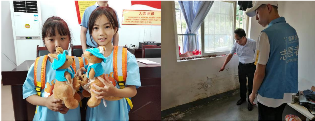
（左图：陕西的孩子和温暖箱小袋鼠；右图：壹基金当地伙伴评估受灾情况）