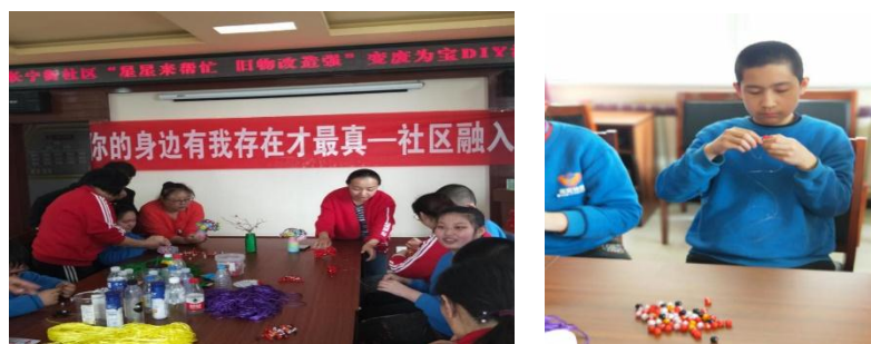
图为 4 月份社区融合活动