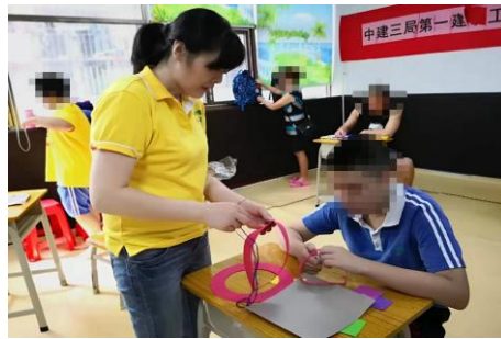
老师教孩子们如何连接各个部分