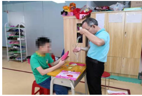
老师教孩子们如何穿针引线