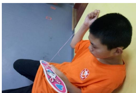
回到学校后，动手小标兵在为大家示范呢！