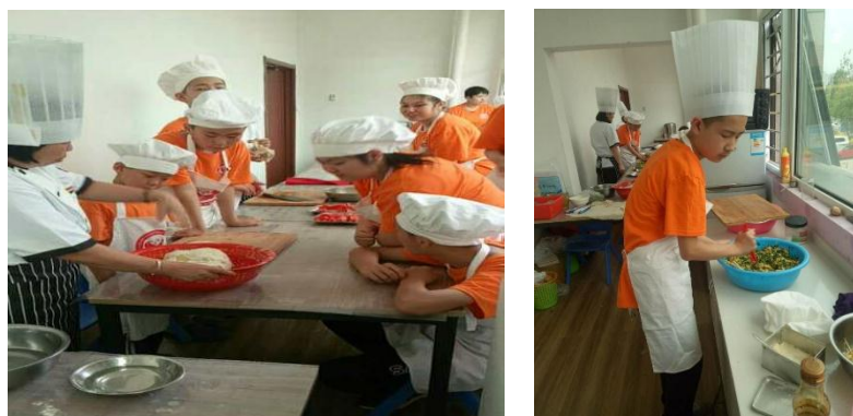
孩子们在学习如何和面、调菜馅