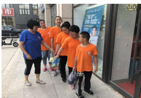
购买食材，准备开工

针对大龄孩子们，开展了培养生活技能的活动。从买菜、洗菜到做饭，在专业老师的指导下，让孩子们学着独立完成。每周购买相应的食材，让孩子们学习洗菜、切菜、炒菜，掌握一门必要的生活技能。在上次包完饺子后，孩子们一直希望学习包包子。看，我们的小厨师们，已经开始行动了。