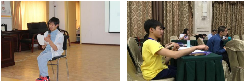
兰生在志愿者培训中做分享以及外出参加学习