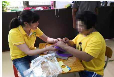
制作出属于自己的帽子，孩子们特别开心。