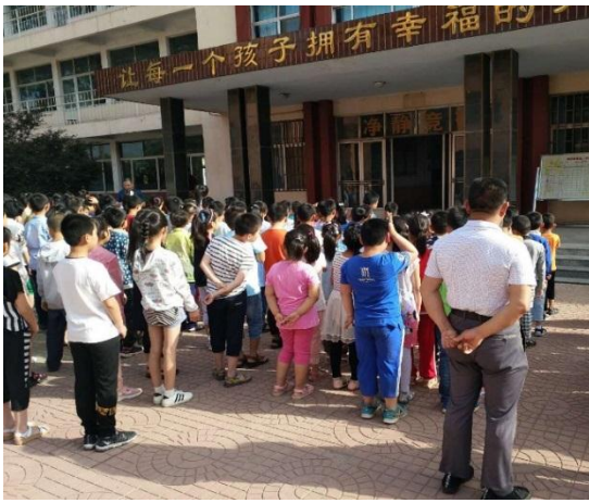
寿光市李营村开展儿童平安小课堂应急演练