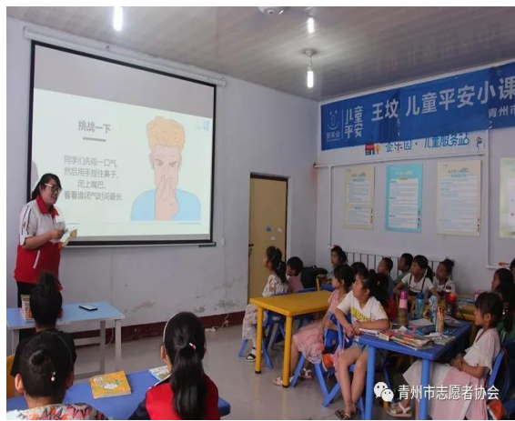
青州市王坟村开展儿童平安小课堂活动