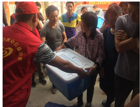
湖北伙伴在当地发放夏季温暖包和救灾温暖箱