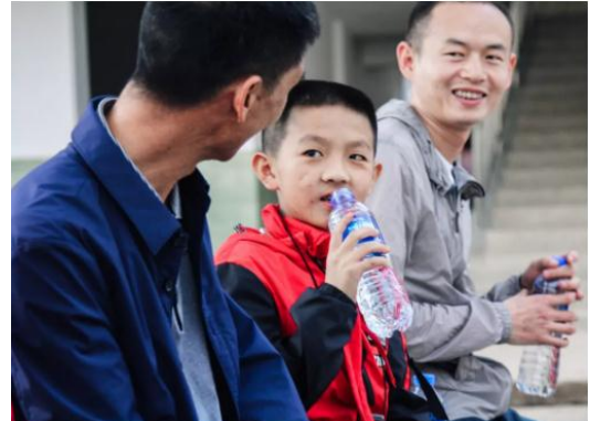
可乐净水 24 小时到达学校