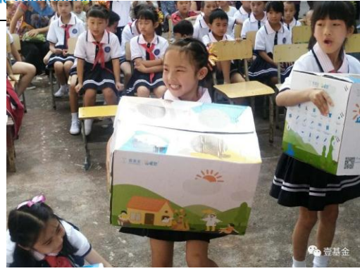
在桂林市资源县中峰镇大田庄村及大田庄小学发放救灾温暖箱和壹基金温暖包