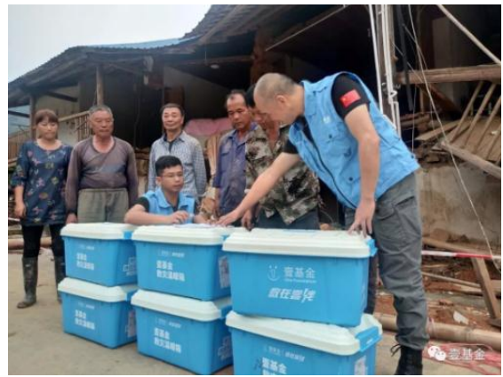
福建救灾小组将救灾温暖箱送到受灾居民家里