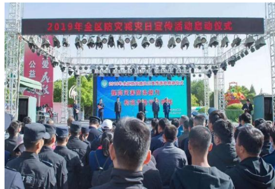
右图：宁夏防灾减灾日活动现场