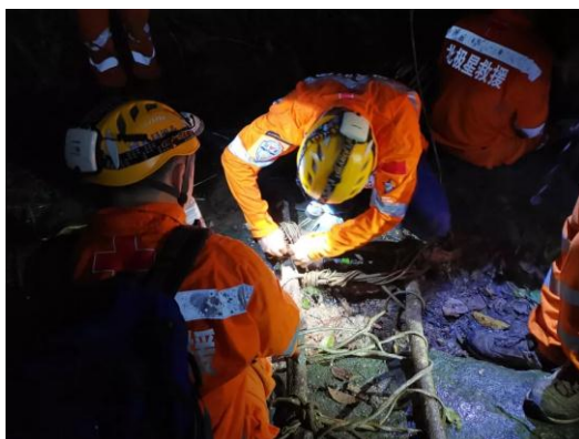
厦门蝴蝶谷搜救行动

2019 年 5 月，救援联盟共计开展了 4 次救援，分别福建厦门同安蝴蝶谷搜救行动、福建厦门万佳酒店后山迷路搜救、湖北武汉车辆事故救援和福建三明洪灾救援。为救援联盟加盟队伍开展 11 次培训活动，地区涉及、海南、厦门、广西、河北、河南、四川 6 个省。