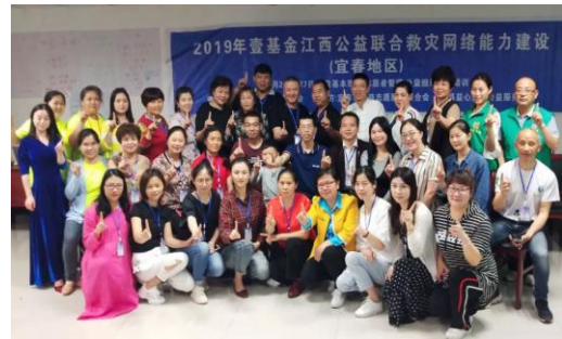
江西上饶地区及宜春地区能建培训现场