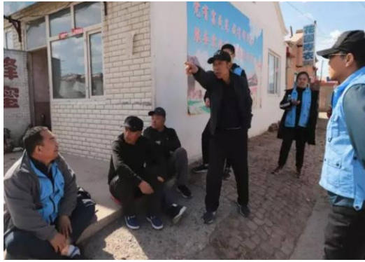
左图：东北联合救灾演练志愿者到村里走访

2019年5月25日至26日，壹基金联合救灾江西伙伴开展了公益项目传播及2019腾讯公益项目的传播学系列主题培训，培训共有来自53家次社会组织的70名工作人员及志愿者参与。