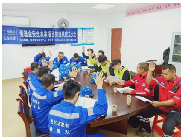
举手表决通过队伍章程