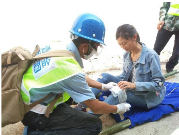
应急演练中开展院前医疗包扎

【福建漳平】漳平市曙光救援协会完成了社区志愿者救援队的组建，召开了成立大会，并开展了队伍章程讨论、搜救培训等活动。