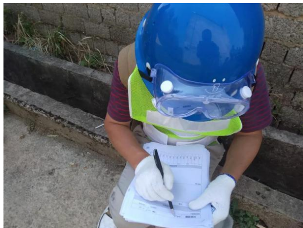
应急演练中信息员负责行动信息记录