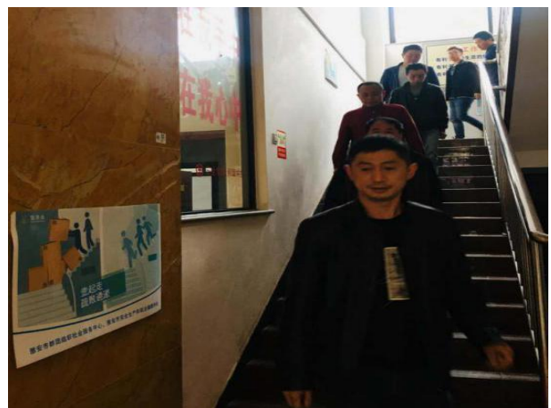
社区志愿者救援队复训并在此在双石小学开展应急演练活动 雅安市安全生产协会组织员工参与“壹起走疏散通道”