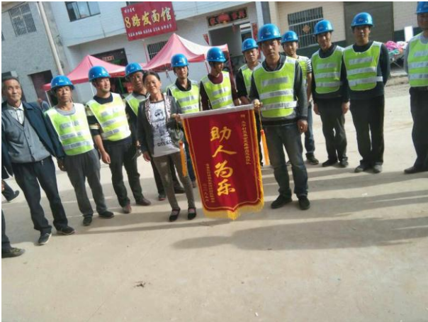
被骗老人向社区志愿者救援队赠送锦旗

【陕西富县】富县鄜州雨露志愿服务中心的志愿者协助寺仙镇太平社区的志愿者救援队在社区风险排查的基础上，完善了社区应急预案，并根据调查需求为社区新增了 14 块应急标识牌。5 月份，这支队伍受邀参与了一年一度的“李自成文化艺术节”大型庙会活动的安保工作，期间队伍收到一位老人的求助，原来他在购物时被骗收了假币，在志愿者救援队帮助下老人成功挽回损失，老人特地给救援队赠送了锦旗，队员们大受鼓舞。