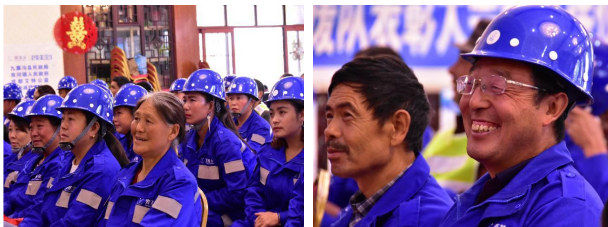
参加交接仪式和表彰的救援队队员

【双河镇】双河镇社区志愿者救援队表彰大会和交接仪式，同时表彰优秀社区志愿者救援队队员。社区志愿者救援队正式移交双河镇人民政府和村两委，交接仪式由镇政府主持，社区救援队队员和四个项目村干部、乡镇干部共计 120 人参加。