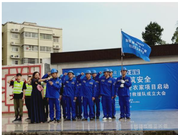
社区志愿者救援队在启动仪式上宣誓加入队伍

【广东韶关】韶关乐善义工的志愿者在田螺冲两面山社区通过公开招募的形式，成立了社区志愿者救援队，讨论确定了队伍章程，并召开了项目启动仪式，举办了消防等培训活动。