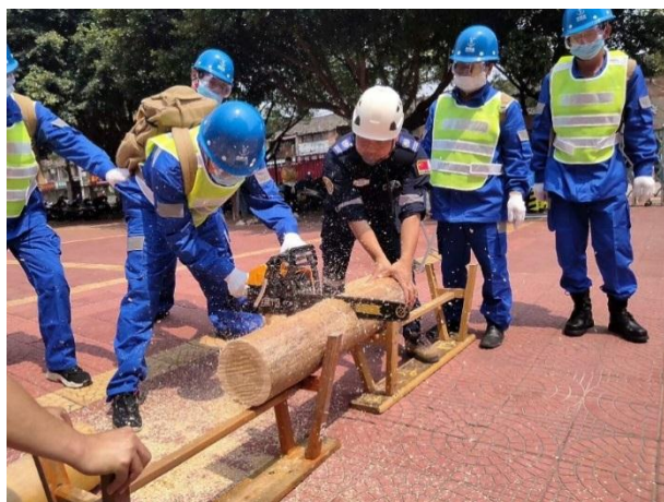
队员在练习使用油锯

【福建漳平】漳平市曙光救援协会完成了社区志愿者救援队的组建，召开了成立大会，并开展了队伍章程讨论、搜救培训等活动。