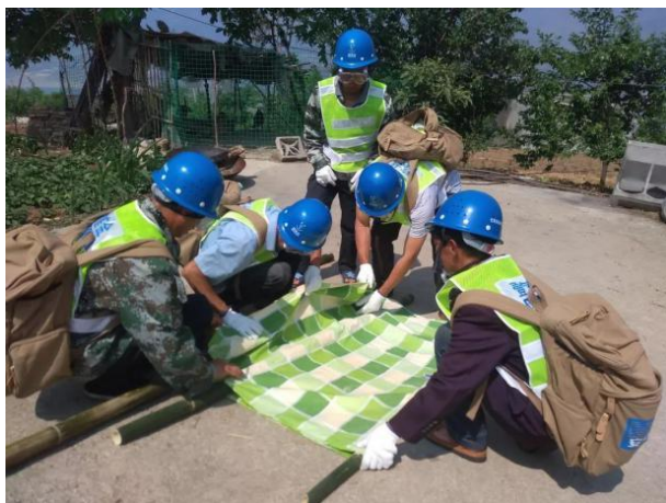
应急演练中制作简易担架