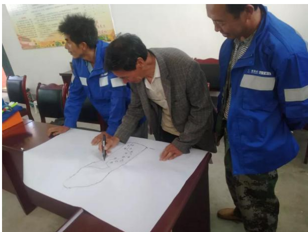
绘制社区风险资源图草图