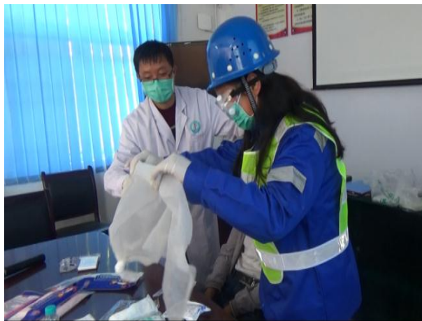
社区志愿者救援队队员在灾难医疗培训课上练习临时包扎

【陕西略阳】陕西省红凤工程志愿者协会在略阳县 4 个项目点完成了物资发放、消防-地质灾害-灾难医疗等培训活动，并组队参与了略阳县多部门组织的 512 防灾减灾日大型科普宣传活动。