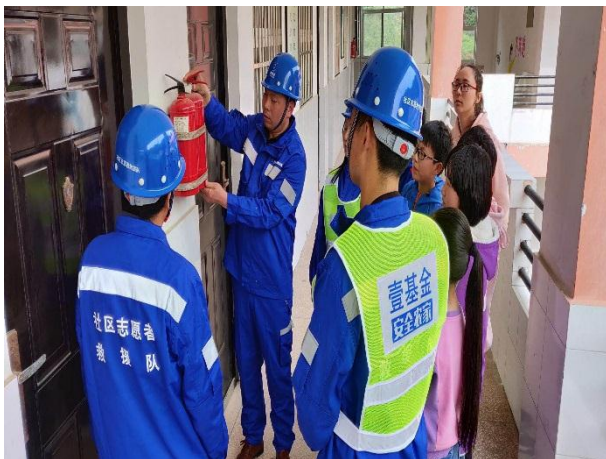
社区志愿者救援队到学校协助检查疏散通道和应急设施

【陕西勉县】西安市未央区环保志愿者协会协助定军山镇的社区志愿者救援队在 512 期间开展了“社区+学校”联合应急演练/宣传活动，充分发挥了社区志愿者救援队服务社区和学校的职能。