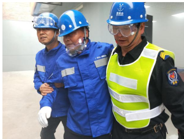
分组应急演练中转运“伤员”

【安徽芜湖】芜湖阳光爱心协会在 5 月完成了项目点应急物资配送与社区志愿者救援队成立大会，作为当地第一支社区志愿者救援队伍，受到了地方政府的高度重视。