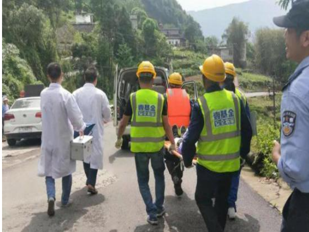
陆王村社区志愿者救援队与镇卫生院、派出所等联合开展应急演练