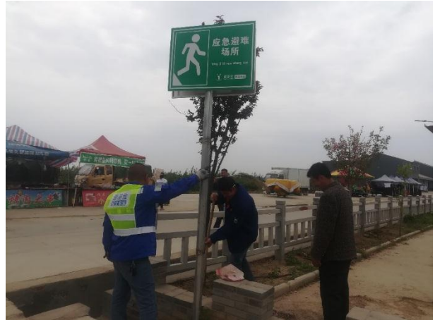
太平社区志愿者在社区安装新增的应急标识牌

【陕西略阳】陕西省红凤工程志愿者协会在略阳县 4 个项目点完成了物资发放、消防-地质灾害-灾难医疗等培训活动，并组队参与了略阳县多部门组织的 512 防灾减灾日大型科普宣传活动。