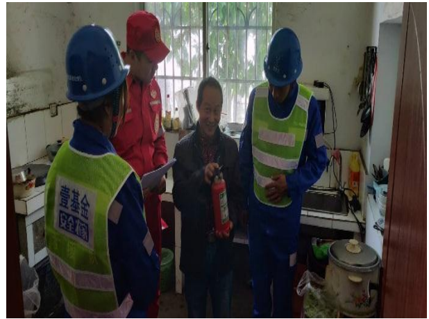
社区志愿者救援队深入农户开展风险排查和消防宣传活动