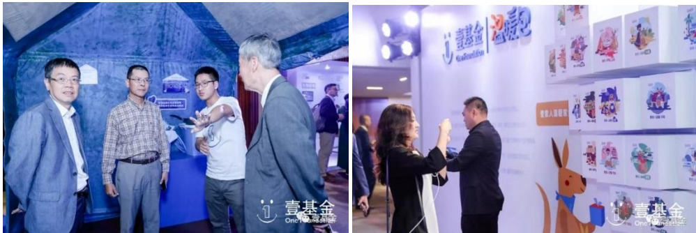
左图：工作人员介绍壹基金救灾物资；右图：爱心嘉宾参观温暖包展区

在活动现场，通过一件件救灾物资和温暖包内含物品向与会人员的介绍，展示壹基金在救灾工作领域的专业度，其中包括救灾帐篷、壹基金家庭救灾箱、壹基金温暖包等。另外，“用行动换回生活”灾区物品展也同样地呈现出灾区的不易，以“失物招领”为主题，用一个个从受灾到救灾的触动人心的真实故事和灾区现场物件展示，呼吁社会更多关注中小型灾害。