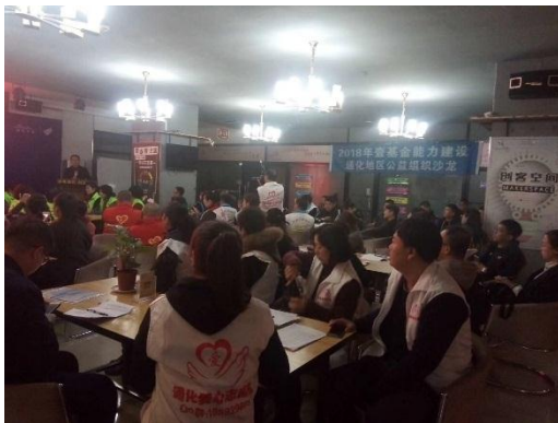
左图：通化地区沙龙现场；

10月23日，2018年壹基金能力建设项目—通化地区公益组织沙龙在吉林省通化市举行，活动主要针对目前通化地区各组织存在的问题开展专题沙龙讨论，包括将志愿者活动转化为项目长期发展和各公益组织未来发展方向规划等。10月27日，白山地区公益组织沙龙在白山市举行，活动也涵盖了各社会组织介绍发展工作成果、项目介绍以及项目筹款方式等内容。通过这两次活动，让各公益组织了解了壹基金的项目，志愿者活动如何与项目结合，也让各公益组织团结起来共同发展。