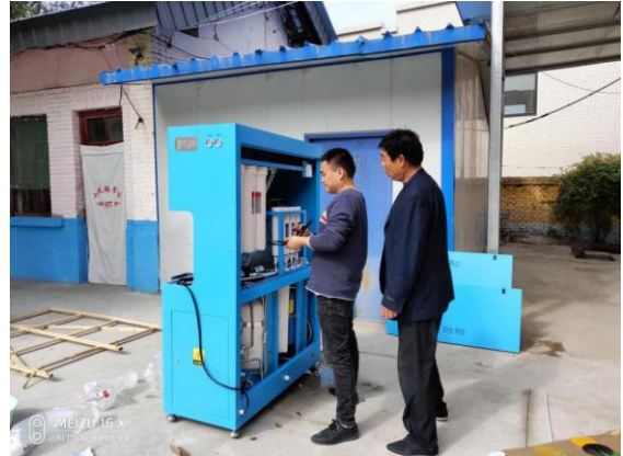
陕西省潼关县收到设备，安装完毕