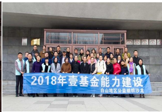
右图：白山地区会后合影