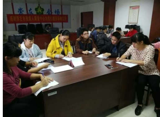
崇左市家长组织 - 家长讲座