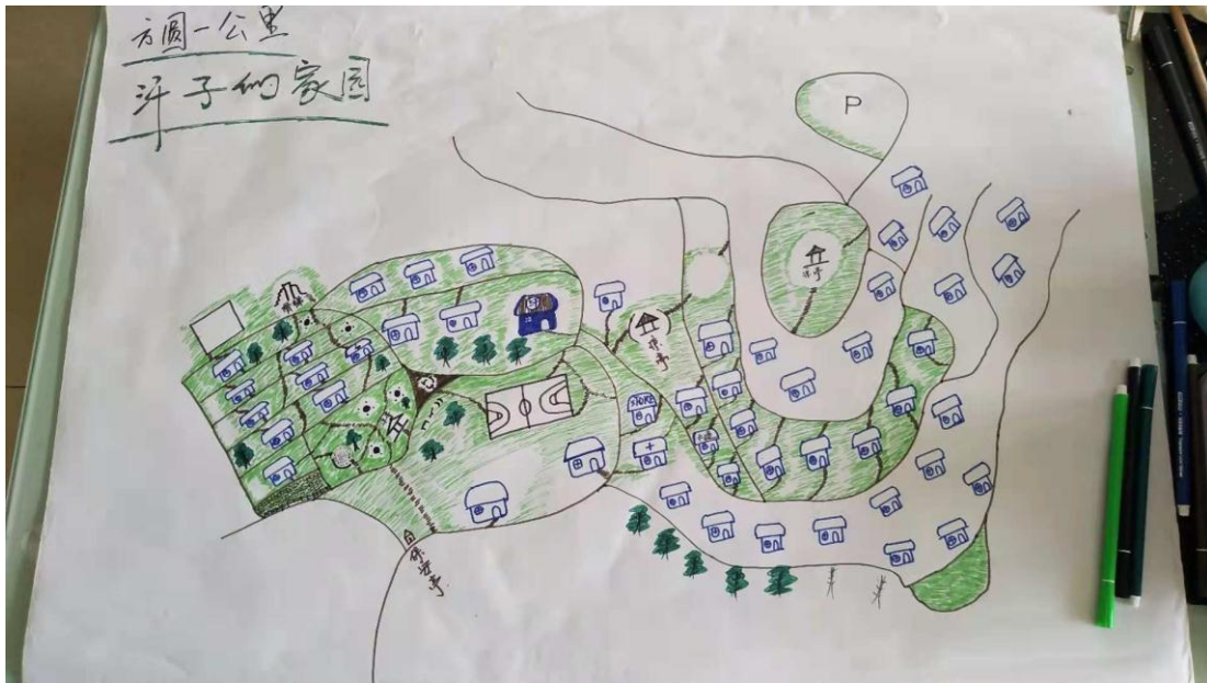
走读社区“方圆一公里”