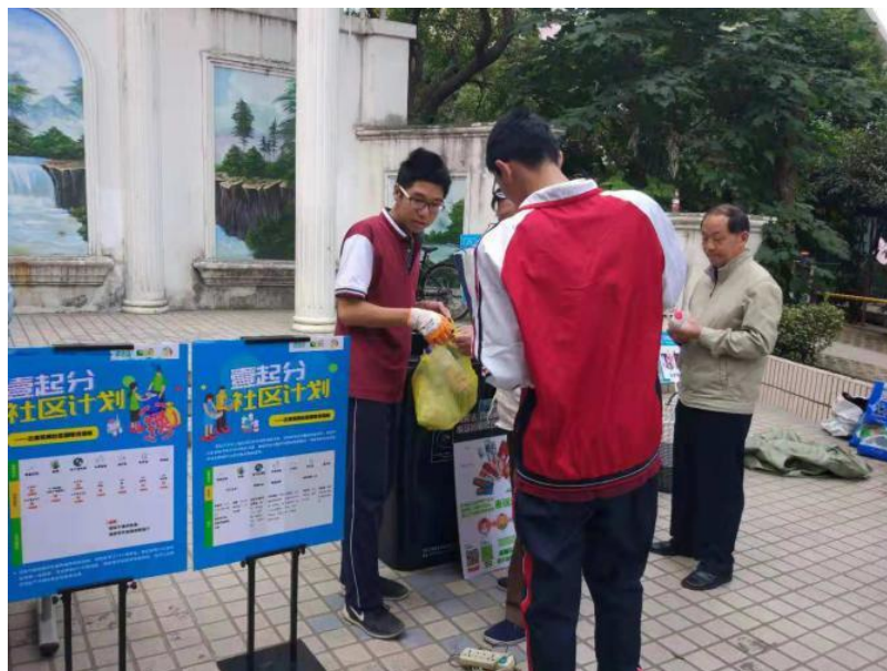
青岛你我创益社会工作服务中心建设了厨余垃圾回收与共建社区花园

10月13日,上海爱芬环保在三宝花苑开展壹起分社区回收日宣传活动。的现场不少居民都养成了在家收集可回收物和分类有害垃圾的习惯,但是也仍有许多居民不清楚有害垃圾种类。为了加强有害垃圾宣传力度,本次回收活动增加宣传部分,把有害垃圾知识带入更多小区,扩大宣传覆盖面。