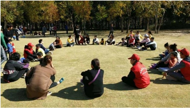
重庆汇爱家长组织 - 亲子活动