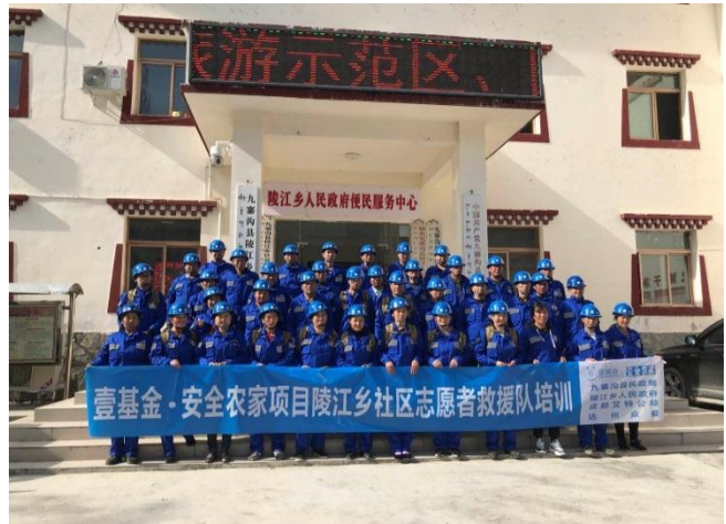
陵江乡救援队合影