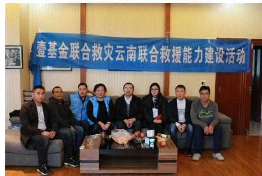
左图：活动现场；右图：会后合影