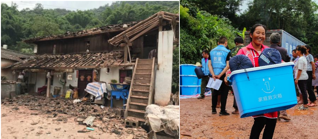
左图：房屋因地震受损；右图：受灾群众领取壹基金救灾物资后感到喜悦