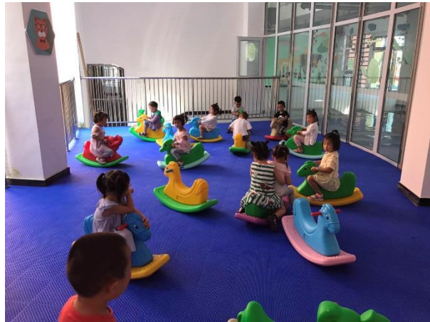
碧峰峡幼儿园开园