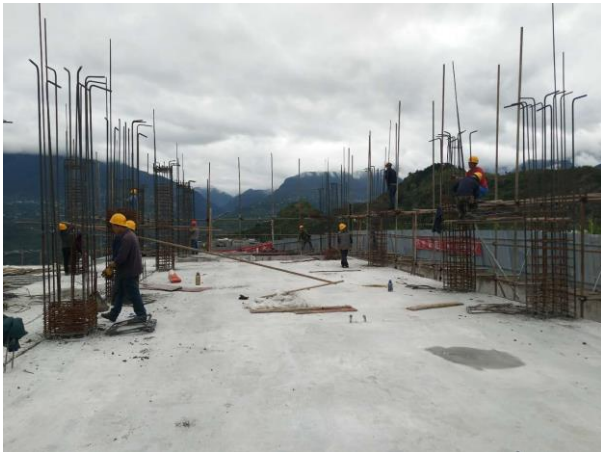
永和幼儿园主体施工

10 所幼儿园（河西、唐家、大川、团结、草科、新场、烟竹、民建、石龙、碧峰峡）建设项目正常使用，审计阶段，工程结项工作，尾款支付；2 所幼儿园（永和乡中心幼儿园 一层主体钢筋施工完成，进入二层主体施工阶段；乌斯河中心幼儿园项目 主体施工完成，进入装修施工阶段）；2 所幼儿园（大坪乡审图已完成，招标完成，正在招标结果公示阶段；枣林前期开工手续办理完毕，审图工作完成，挂网招标阶段）2 所新增幼儿园（石棉县安顺乡中心幼儿园规划通过，地勘已完成，取得地勘报告，正在施工图设计；雨城区草坝新区幼儿园通过规委会，正在地勘施工，进入施工图设计阶段）。