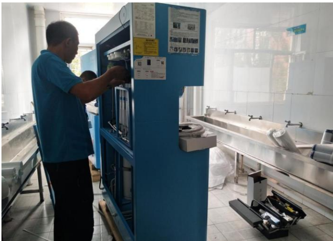
3) 云南大关县净水设备已安装