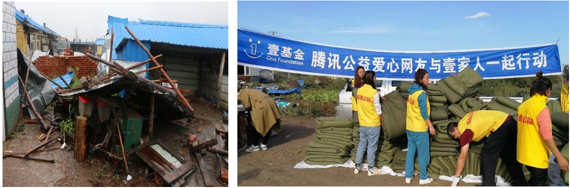
左图：受灾现场；右图：壹基金救灾物资发放现场