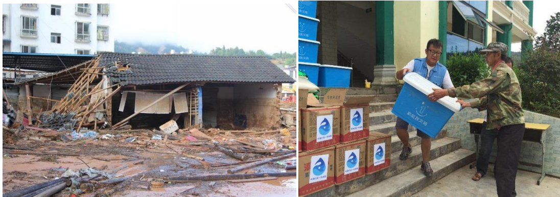
左图：受灾地区房屋倒塌；右图：受灾群众领取壹基金家庭救灾箱

云南文山州麻栗坡县 902 泥石流灾害救援行动： 2018年9月2日凌晨，麻栗坡县猛硐乡、麻栗镇、天保、下金厂、八布、六河、铁厂和董干 8 个乡镇 15 村委会 126 个村小组境内遭受强降雨袭击。截至 9 月 3 日，灾情已造成 5,412 人受灾，因灾失踪人口 15 人，因灾伤病人口 7 人；倒塌房屋 52 间，严重损坏房屋 150 间，紧急转移安置人口 315 人，造成经济损失 147,089 万元。灾情发生后，壹基金联合救灾项目-云南伙伴立即赶赴灾区开展救援行动。在通过灾情勘查和需求评估后，9 月 6 日，壹基金救灾物资陆续在受灾严重的猛硐乡发放，物资包括 430 个壹基金家庭救灾箱、30 个睡袋、21,000 公斤大米、4,200 升食用油、745 个壹基金夏季温暖包。本次行动总受益人次为 9,215 人次，物资总金额为 594,325 元。