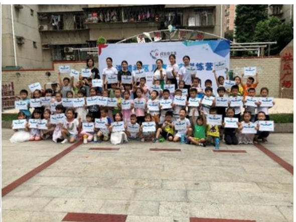
9月28日 洪湖社区居民体验活动