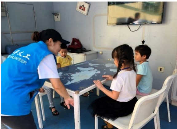
9月30日新乐社区儿童体验训练营活动