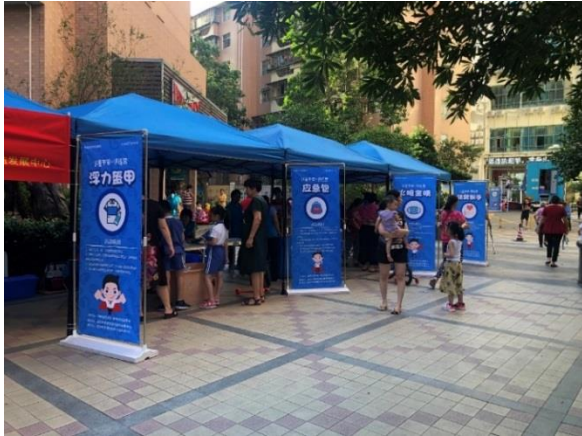
9月18日，渔民社区居民参与体验活动

9月，和粤公益和壹基金共同申报的壹基金儿童平安训练营项目在第四届鹏城慈善奖评选活动中评为“鹏城慈善典范项目”，本次获奖也是政府和公众对儿童平安训练营的肯定和认可。