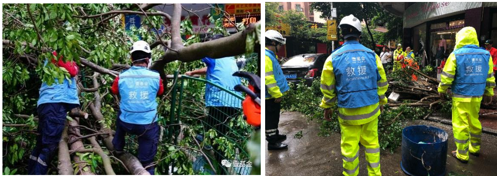
左图：深圳救援队清障行动；右图：江西救援队清障行动

台风“山竹”救灾行动： 截至9月17日，“山竹”台风造成深圳、珠海、江门、湛江、阳江等14个市紧急避险转移和安置95.1万人，4人因灾死亡（广州3人因树木倒压所致，东莞1人因构筑物倒塌所致）。在收到相关天气信息后，壹基金救援联盟多队进行灾前备勤。台风过后，壹基金救援联盟-深圳公益救援队共召集16个梯队657人次在深圳全市53个作业点投入城市清障行动。此外，珠海民安救援队、江西雄鹰救援队分别在珠海及佛山两地开展路面清障行动，多日连续作战，在市内多地清理道路交通，帮助群众安全顺畅出行。