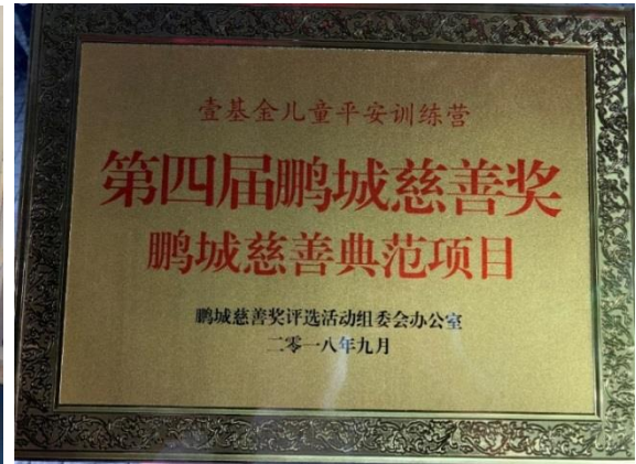
儿童平安训练营项目评为“鹏城慈善典范项目”