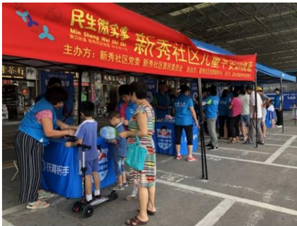
9月26日 新秀社区居民参加体验活动