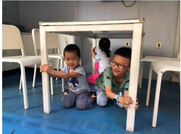
9月22日玉龙社区居民体验活动