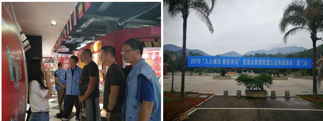
左图：救援联盟队伍一行参访厦门可口可乐公司；右图：演练现场

8月25日，2018“人人减灾，救在身边”壹基金救援联盟公益救援演练（厦门站）在厦门天竺山森林公园完成。上午，救援联盟队伍一行参观了厦门太古可口可乐饮料有限公司，了解“净水24小时”灾害应急饮用水救援机制。下午，进行演练。本次演练主要针对通讯快速搭建、指挥调度演练以及图文数据传送三大内容进行实践操作，此外，无人机、慢扫描电视（SSTV）和无线电通讯设备都运用到了此次演练中。相信通过这次演练和经验总结，壹基金救援联盟能在灾害救援行动中贡献更大力量。