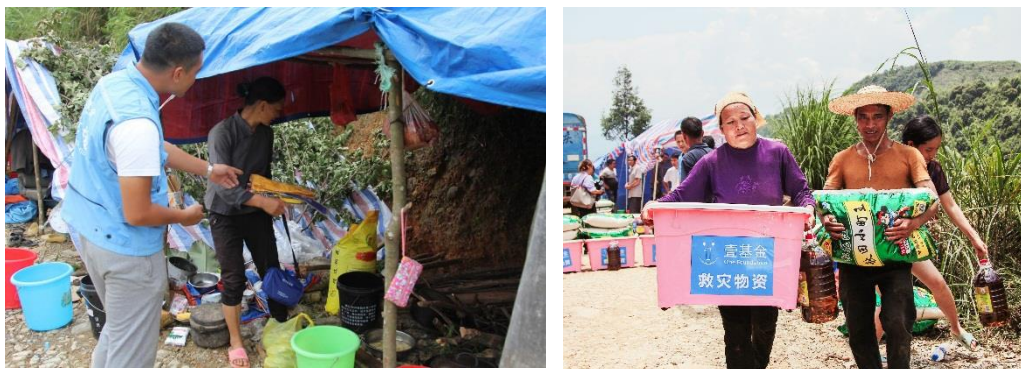
左图：8 月 17 日救援队员正在进行搜救行动；右图：村民正在发放点领取壹基金救灾物资

广东省茂名市信宜县 811 洪灾救援行动： 8 月 10 日至 12 日，茂名市北部、东部和南部沿海地区持续出现暴雨到大暴雨局部特大暴雨，其中信宜 5 个乡镇受灾，倒塌房屋 23 间，受灾人口 4.6 万人，紧急转移安置危险区域人员 7,802 人，失踪人员 2 人，思贺、平塘、新宝三镇供水管道摧毁，饮用水源中断。茂名市江河水位普遍上涨，信宜思贺河、平塘河、白龙河，思贺河思贺站曾出现超警戒水位的情况，全市直接经济损失约 2.3 亿元人民币。鉴于防汛形势严峻，茂名市防汛防旱防风指挥部将防汛Ⅲ级应急响应提升为防汛Ⅱ级应急响应，并启动防风Ⅳ级应急响应。灾情发生后，壹基金救援联盟-深圳公益救援队立即赶赴一线，在受灾最为严重的新宝镇、平塘镇和思贺镇开展灾情勘查、救援搜救及医疗转运等工作。另外，壹基金联合救灾项目-广东伙伴也在 12 日上午抵达受灾现场，通过实地了解到当地处于停水停电的状态以及无法恢复灾后生产生活情况后，壹基金联合救灾项目-广东伙伴回应了受灾最为严重的平塘镇、思贺镇和新宝镇的需求，共发放了 24,000 瓶冰露水、大米 4,500 公斤、食用油 1,500 升、壹基金家庭救灾箱 300 个、壹基金夏季温暖包 150 个。物资总金额为 188,250 元，总受益人次为 6,750 人次。