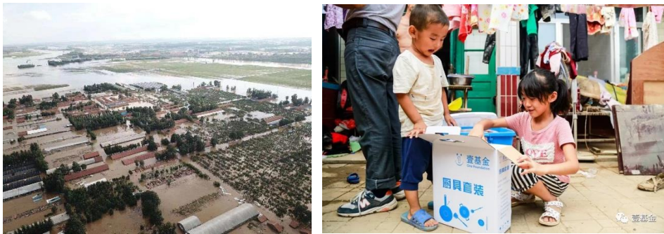
左图：灾情现场；右图：孩子们在家里领取到壹基金家庭救灾箱后的喜悦

通过深入走访评估灾情和需求调研，辅之以壹基金救援联盟-河南救援队在受灾地区进行了为期一周的防疫消杀，一线伙伴最终以48,000瓶冰露水、2,498个壹基金家庭救灾箱、2,644个壹基金夏季温暖包、62,450公斤面粉、12,490升食用油回应了受灾地区群众累计35,620人次的需求，本次行动总金额为2,205,630元，累计受益人次达36,620人次。