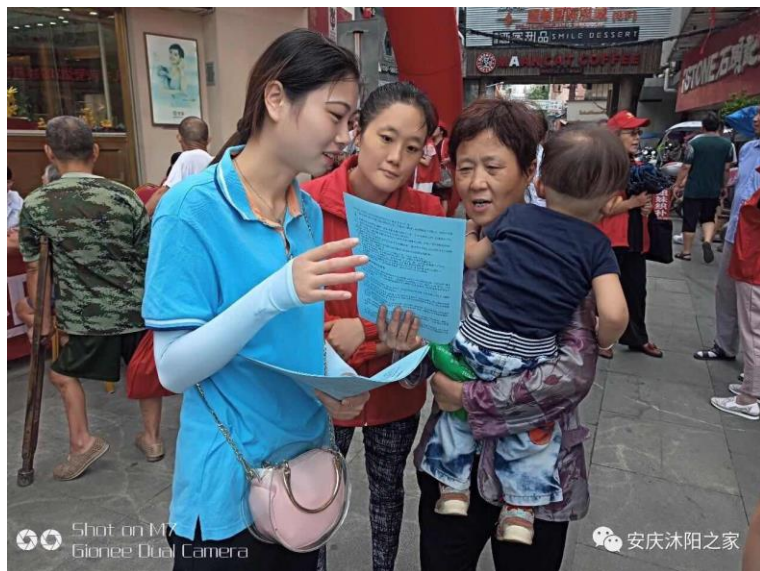
左图：肇庆市自闭症互助会举行家长培训