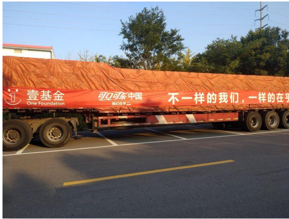
左图：冰露水装货上车完毕，准备出库

下物资：壹基金夏季温暖包 90 个、冰露水 75,792 瓶、12 平米帐篷 2 顶，累计受益人次为 6,414 人次，本次行动物资总金额为 112,442 元。