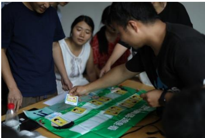
茂县安全农家培训第二期

茂县安全农家项目与2018年4月正式启动。8月,黑虎乡、太平镇6个村的6支社区志愿者救援队开展了团队建设、制度定力工作。