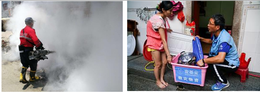
左图：救援队正在进行防疫消杀；右图：志愿者在给受灾群众介绍家庭救灾箱

广东省茂名市信宜县 811 洪灾救援行动： 8 月 10 日至 12 日，茂名市北部、东部和南部沿海地区持续出现暴雨到大暴雨局部特大暴雨，其中信宜 5 个乡镇受灾，倒塌房屋 23 间，受灾人口 4.6 万人，紧急转移安置危险区域人员 7,802 人，失踪人员 2 人，思贺、平塘、新宝三镇供水管道摧毁，饮用水源中断。茂名市江河水位普遍上涨，信宜思贺河、平塘河、白龙河，思贺河思贺站曾出现超警戒水位的情况，全市直接经济损失约 2.3 亿元人民币。鉴于防汛形势严峻，茂名市防汛防旱防风指挥部将防汛Ⅲ级应急响应提升为防汛Ⅱ级应急响应，并启动防风Ⅳ级应急响应。灾情发生后，壹基金救援联盟-深圳公益救援队立即赶赴一线，在受灾最为严重的新宝镇、平塘镇和思贺镇开展灾情勘查、救援搜救及医疗转运等工作。另外，壹基金联合救灾项目-广东伙伴也在 12 日上午抵达受灾现场，通过实地了解到当地处于停水停电的状态以及无法恢复灾后生产生活情况后，壹基金联合救灾项目-广东伙伴回应了受灾最为严重的平塘镇、思贺镇和新宝镇的需求，共发放了 24,000 瓶冰露水、大米 4,500 公斤、食用油 1,500 升、壹基金家庭救灾箱 300 个、壹基金夏季温暖包 150 个。物资总金额为 188,250 元，总受益人次为 6,750 人次。