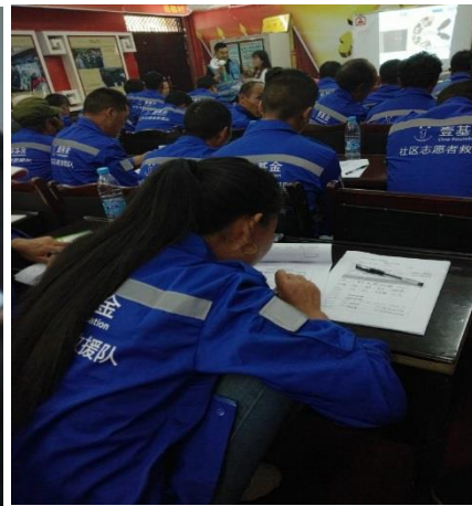
茂县黑虎乡社区志愿者救援队制度建设