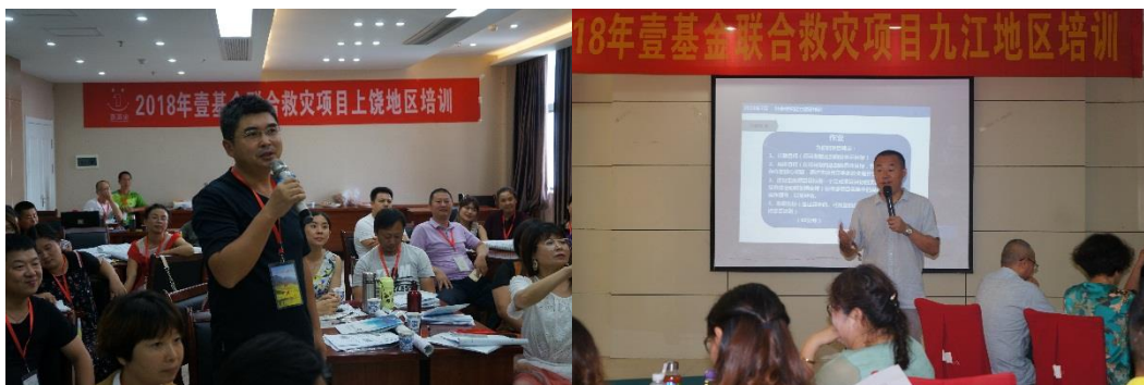
左图：江西伙伴在会议上交流；右图：讲师正在向伙伴进行培训

7月28日至8月3日，由壹基金、南昌益心益意公益服务中心联合主办的“壹基金联合救灾项目2018年能力建设培训”分别在江西九江、上饶和景德镇。培训主要涵盖了壹基金项目及介绍、联合救灾项目设计与管理、财务管理以及志愿者组织管理等议题。通过这几次会议，伙伴更加充分地认识到了壹基金的项目，也对项目的运作和管理有了深刻的认识。相信在未来，江西伙伴的公益项目会在专业化的道路上越走越远，越来越好。