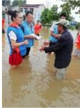
右图：一线伙伴实地了解灾情和需求

安徽宿州埇桥区 818 洪灾救援行动： 8 月 18 日，受第 18 号台风“温比亚”对安徽省造成的强降雨影响，且由于大部分村庄地势低洼，且有多个村庄位于塌陷区，降雨集中，宿州埇桥区也同样出现严重的洪涝灾情。20 日上午，壹基金联合救灾项目-安徽伙伴前往桃园镇东坪集村、符离镇黄桥村、三山子村，汴河街道唐河小区做灾情评估。在通过对灾情和需求的研判后，一线伙伴以物资形式作为行动回应，救灾物资于 22 日抵达。本次行动物资包括 141 个壹基金夏季温暖包、50,016 瓶冰露水和 2 顶 12 平米帐篷，累计受益人次为 4,349 人次，物资总金额为 105,281 元。