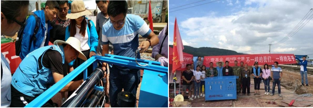
左图：培训人员正在实操学习净水车安装；