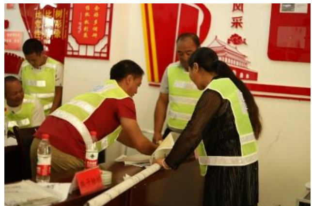
白河乡社区志愿者救援队团队建设培训