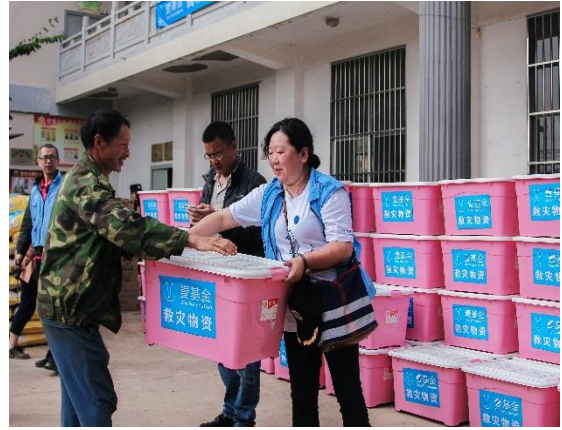
左图：村民领取冰露水；右图：村民领取壹基金家庭救灾箱