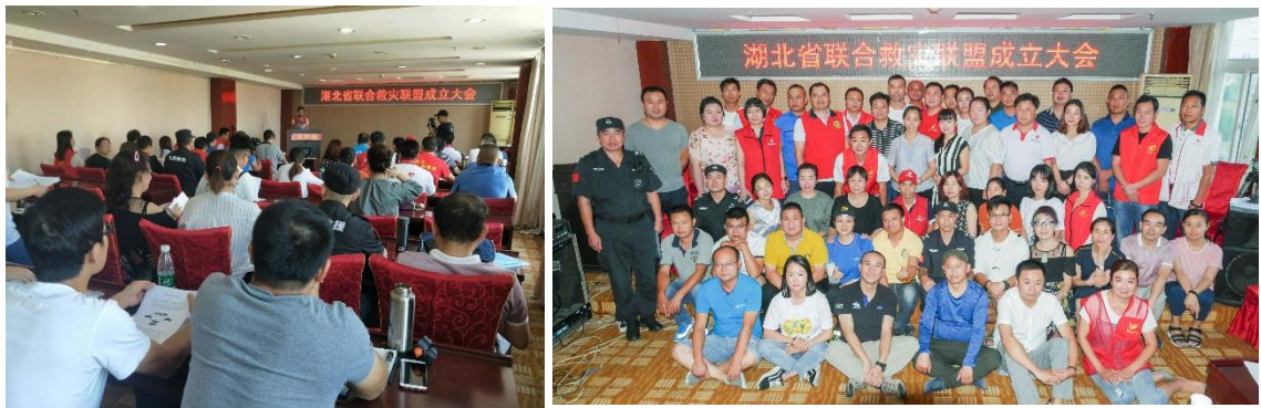
左图：湖北联合救灾联盟成立大会现场；右图：会后合影

除此之外，7月21日至8月26日，湖北省2018壹基金联合救灾第四期能力建设沙龙在咸宁市卫生局卫生宾馆举行，参与此次会议的有来自咸宁、黄石、鄂州、黄冈和武汉地区的公益组织负责人及项目专员30余人。湖北伙伴们就联合救灾、儿童服务站、平安小课堂、儿童温暖包及安全农家项目进行了深度交流。通过四期下来的交流学习，已加入项目的机构伙伴更清晰的了解到目前网络内的项目细节，也吸引了尚未加入的机构伙伴申请执行项目。