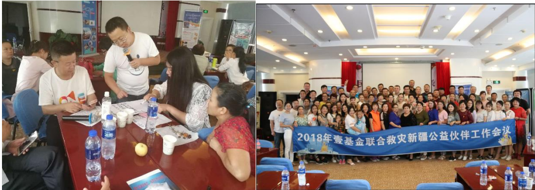
左图：新疆网络协调人和伙伴交流互动；右图：会后合影

8月19日，2018年壹基金联合救灾新疆公益伙伴工作会议在壹基金的支持下，在新疆志愿公益救援联盟的主办下圆满成功。该培训就项目推广、温暖包动员和99公益日筹资动员等方面使伙伴展开深度讨论。会议过后，伙伴们表示收获满满，自身对筹资和传播的认识得到了较大程度的提升，同时也对今年的99公益日筹资充满信心。