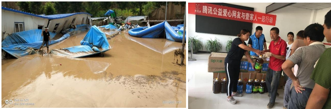
左图：灾情现场；右图：受灾群众领取壹基金救灾物资

陕西绥德县义和镇 807 洪灾救援行动： 8 月 7 日凌晨，绥德县部分乡镇遭受强降水袭击，其中在义合镇降水量最大，受灾尤为严重，洪水漫过镇区街面，高达 2 米之多，导致街面淤泥堆积、门市和房屋进水受损、供电中断。据初步统计，洪灾造成全县 25,497 人受灾，7,870 人紧急转移安置，直接经济损失达 7,351.8 万元，其中义合镇约 6,000 万元。8 月 7 日晚，壹基金联合救灾项目-陕西伙伴连夜赶赴受灾地区一线。8 月 9 日，一线伙伴前往受灾严重的义和镇，通过走访评估灾情和需求调研，壹基金联合救灾项目-陕西伙伴对义和镇回应了面粉 6,375 公斤、食用油 1,315 升，本次行动累计受益人次为 2,104 人次，物资总金额为 39,187 元。