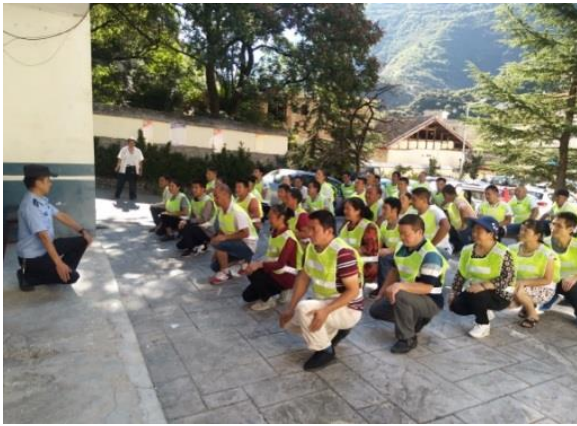
白河乡社区志愿者救援队成立大会-减灾操现场

经过了7月暴雨山洪泥石流季节,九寨沟县各乡镇大多出现了道路损毁、山体滑坡的灾情。8月,九寨沟安全农家项目执行机构便陆续开展了“社区志愿者救援队见面会”、“社区志愿者救援队成立大会”、“社区志愿者救援队物资捐赠仪式”。截止8月25日,已经入村开展见面会16场,确定救援队成员16支,举办了2个乡镇9支队伍的建立大会合计120余人参会,完成9支社区志愿者救援队的正式建立,开展社区志愿者救援队团队建设活动1场共4支队伍参与,发放社区志愿者救援队公共应急物资8个村,发放社区志愿者救援队个人救援装备。