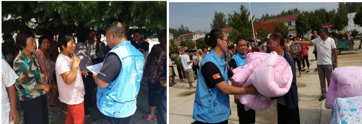
左图：一线伙伴在向受灾群众了解灾情；右图：村民领取棉被救灾物资

瓶冰露水和 650 床棉被缓解了受灾地区需求，物资总金额为 89,000 元，累计受益人次为 4,600 人次。