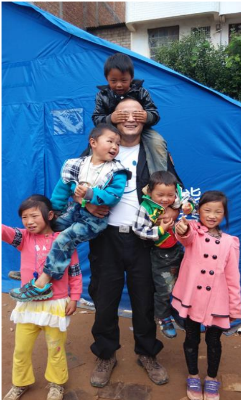
图为鲁甸县龙头山镇儿童服务站

针对灾区的特殊需求，壹基金将鲁甸地震过渡安置工作集中在 温暖包 发放和建立 儿童服务站 两个方面：一方面，鲁甸属高海拔地区，冬季极为寒冷。地震后的第一个冬天，壹家人将 15440 个温暖包送到了灾区孩子的手中，为他们带去温暖、健康和关怀。另一方面，壹基金携手公益伙伴，在灾区安置点及乡村设立了壹乐园-儿童服务站。截至 2015 年 3 月 31 日， 20 个壹乐园-儿童服务站共为鲁甸灾区的 13713 名儿童提供了 105925 人次的服务，其中 6 个开展专项服务的站点伙伴共走访超过 30 个社区，为近 300 名留守儿童提供了 2000 多人次的服务。