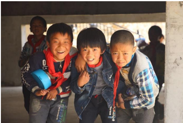
图为课间玩耍的孩子

壹乐园-运动汇项目以儿童发展为核心，通过建设儿童游乐设施或多功能运动场、配备体育教学器材、开发趣味互动课程、提供体育教师专业培训，以及倡导乡村体育教育和乡村儿童发展议题，提高乡村学校的体育教育质量，促进儿童的身体发育、情感发展和社会交往，帮助乡村儿童在快乐中发展潜能。