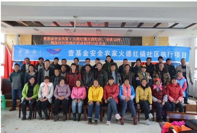
图为壹基金安全农家火德红镇社区执行项目大会现场