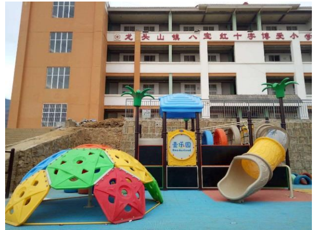
图为项目学校龙头山镇博爱小学的壹乐园-运动汇游乐设施