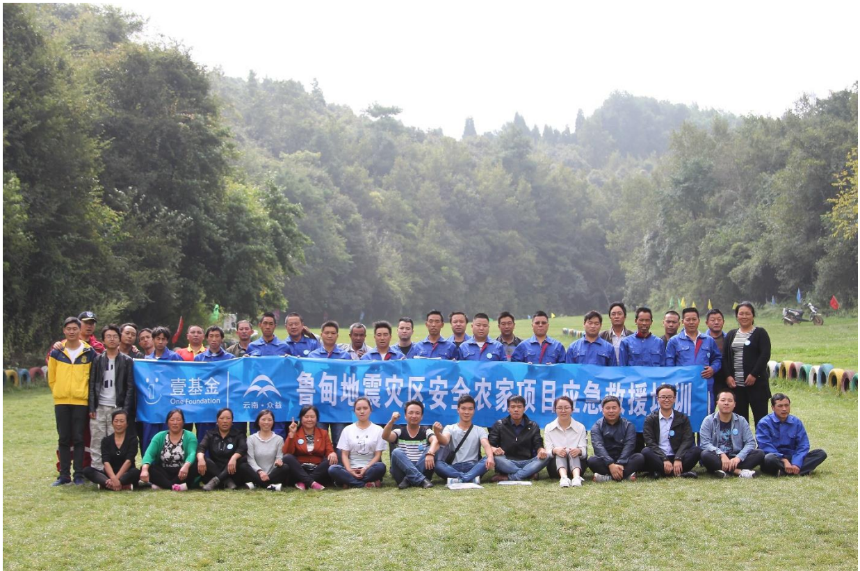
图为2017年9月壹基金安全农家项目应急救援培训合影

截至2017年7月底，壹基金云南鲁甸地震灾后重建中的“硬件”项目已全部完成，“软件”培训及能力提升项目正在实施中，鲁甸地震灾后重建工作计划于2018年完成。