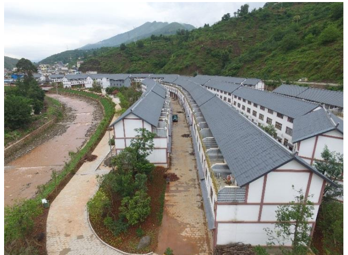
图为壹基金援建龙头山镇沙坝村钢结构抗震农房安置点