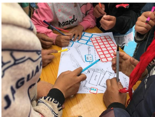
图为孩子们在手绘风险资源图

鲁甸减灾示范校园项目于2017年3月启动，共在乐红镇中心小学、对竹小学、官寨小学、红布小学、垮山小学、龙家湾小学等14个项目学校开展为期一年的项目，在14个项目学校共开展了：减灾主题活动20场；应急演练20场；安全教育课800节次；开展风险排查2次；举行项目启动会、校长培训会及项目总结会共计3次，培训学校校长及骨干教师80余人次；开展1次安全教育课教师培训和1次公开课展示，培训教师54人次；开展了1次安全教育课赛课活动，6所项目学校7名安全教育课教师参赛；组织1次鲁甸项目学校老师及教育局领导与雅安市项目学校进行安全管理、安全教育等方面的学习交流；发放校园应急设备14套，校园应急箱20个，校园应急疏散示意图10幅，儿童应急包5220个，减灾教育笔记本5220本，项目手册900套，共计受益老师300余人次，受益学生5220人。