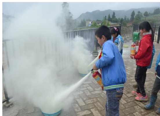
图为孩子们在学习灭火器的使用