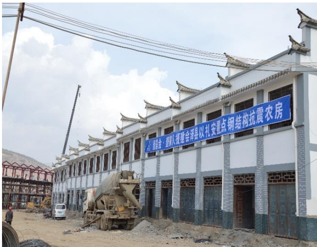
图为壹基金援建会泽县以礼安置点钢结构抗震农房