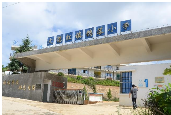
图为壹基金援建的鹊落小学