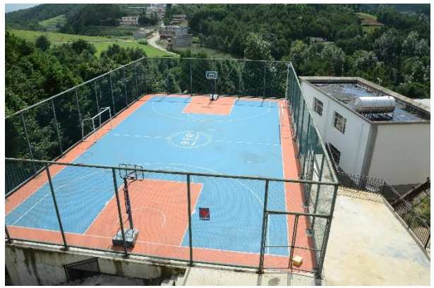
图为鹤落小学壹乐园运动场

2016年10月起，壹基金壹乐园-运动汇项目开始在鲁甸灾后地区开展，主要在鲁甸县、会泽县和巧家县的75所学校配备了运动汇-游乐设施或多功能运动场，其中在鲁甸县40所小学分别配备了18套游乐设施和30座多功能运动场，在会泽县15所学校配备了15座多功能运动场，在巧家县12所学校配备了12座多功能运动场，共有75所学校的48915名儿童受益；同时在专业培训师的支持下，在鲁甸县、会泽县、巧家县开展体育教师培训三场，共有131名体育教师从中受益。