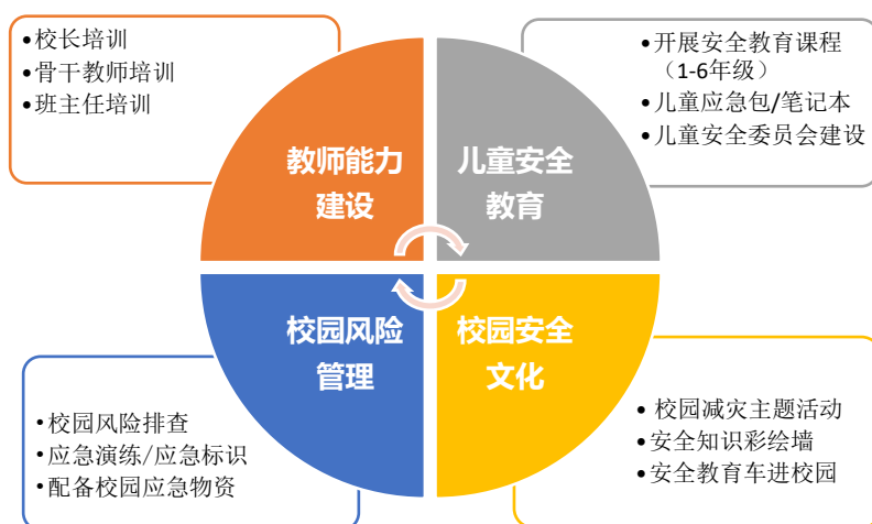
图为减灾示范校园项目框架

减灾示范校园项目计划通过教师减灾能力建设培训、配发安全教育手册、推动安全教育课开展、举办快乐有趣的减灾主题活动，以及配备应急包和减灾笔记本，提升鲁甸地区儿童自身应对灾害的能力；通过校园安全风险排查、应急疏散演练、配备应急设备与物资、应急标识，提升校园对儿童的保护能力。