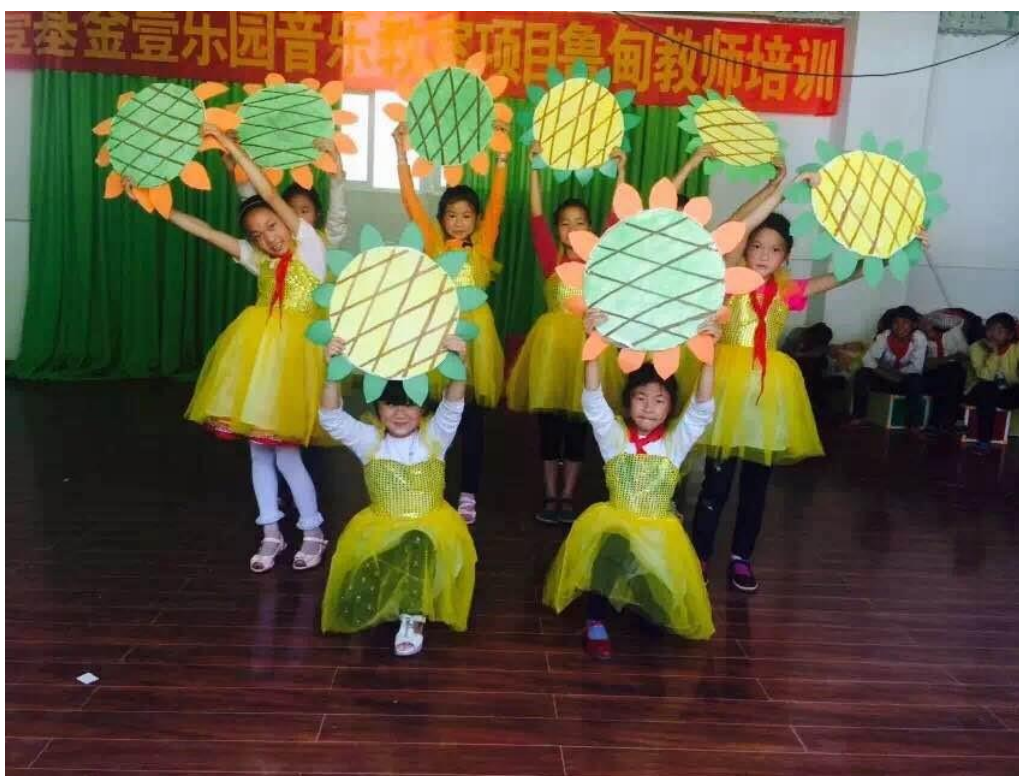
图为项目学校老师带着孩子们在音乐教室彩排节目

壹乐园-音乐教室项目于2015年1月开始启动，截至2017年7月底，已在鲁甸县龙头山镇、火德红镇、乐红乡等5个受灾乡镇的10所学校建设完成10间壹乐园音乐教室，已有10009名儿童受益；并对10所学校的13名音乐教师开展了专业教学培训，帮助项目学校的儿童获得更高质量的音乐教育。