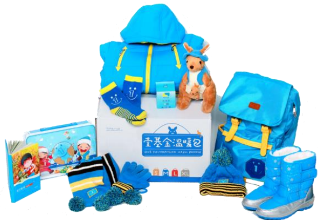
图为 2014 年温暖包内物品