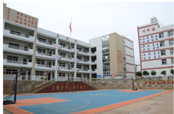
图为壹基金援建的光明小学