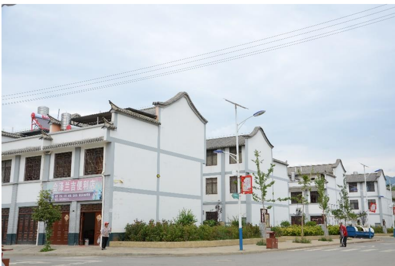
图为以礼社区安置点新居

何兴华书记介绍说，以礼社区志愿者救援队35个人，很大部分是由当地村干部组成，平时不会出外打工，随时可以行动。以礼社区临近以礼河，每年防灾重点是冬春火灾、夏季水灾。今年春节时就发生了一起火灾，一个患有精神疾病的村民用草引火点烟，导致火灾。巡山的护林员发现后，立即发出消息，队员紧急集合，抵达火灾发生地，分组分片灭火。费了一天一夜终于把火彻底熄灭。