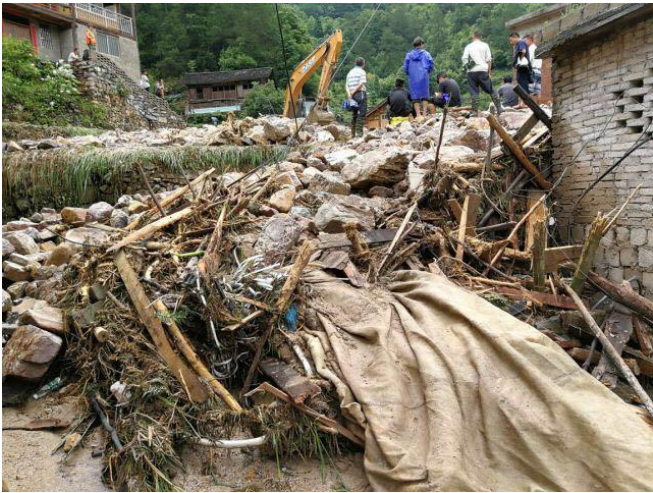
洪水过后，一片狼藉

参与响应伙伴机构：六盘水义工联合会、贵阳市红十字会志愿者协会、黔南州尚善公益协会。