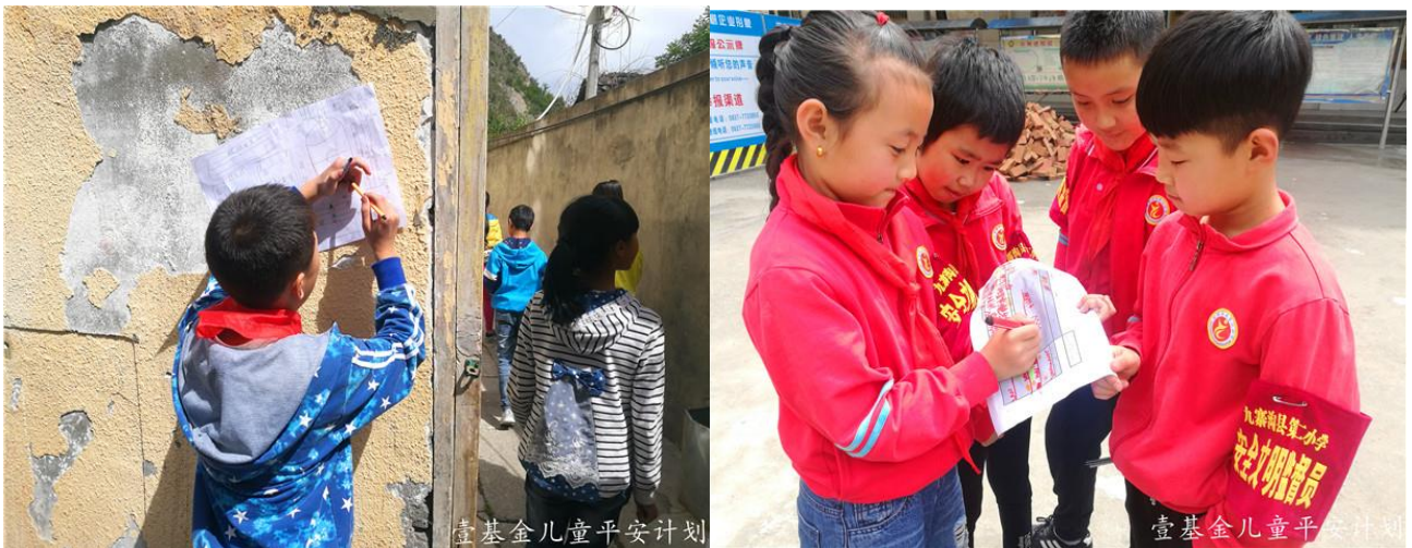
图：学生们组成儿童安全小组，定期排查校园风险，并记录提交校长后整改

6月6日，九寨沟减灾示范校园项目的应急物资物资到货，共配送8套应急设备、1600个校园应急包和1600本减灾教育笔记本。