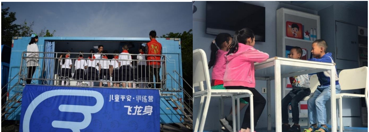
芦山县芦阳三小的学生在参加儿童平安训练营体验活动

受雅安市教育局邀请，自5月20日起儿童平安训练营将在雅安8个区县为减灾示范校园项目学校开展活动，为雅安灾后农村小学带去寓教于乐的防灾减灾体验活动。目前项目累计在雅安范围内开展项目活动15场，累计4799人参与体验。训练营项目旨在提升儿童、家长和其他公众对儿童安全教育的意识和能力。基于在城市社区和公共媒体上的倡导和宣传活动，加强针对儿童家长人群的宣传倡导工作，并推动社会公众参与儿童安全教育。