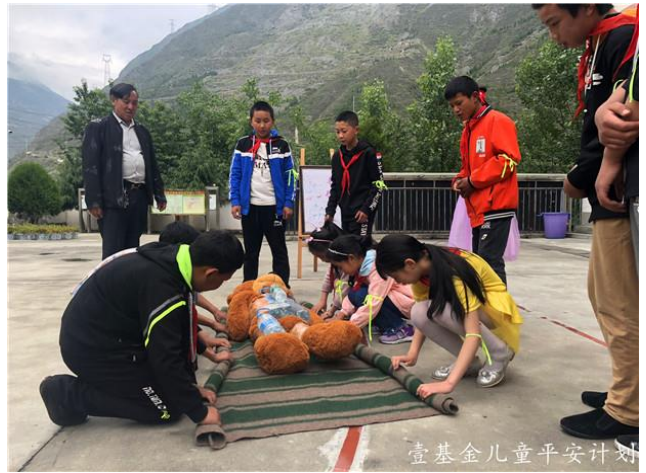
图：学生们通过防灾减灾主题活动学习如何使用千斤顶救人/制作担架运送伤员