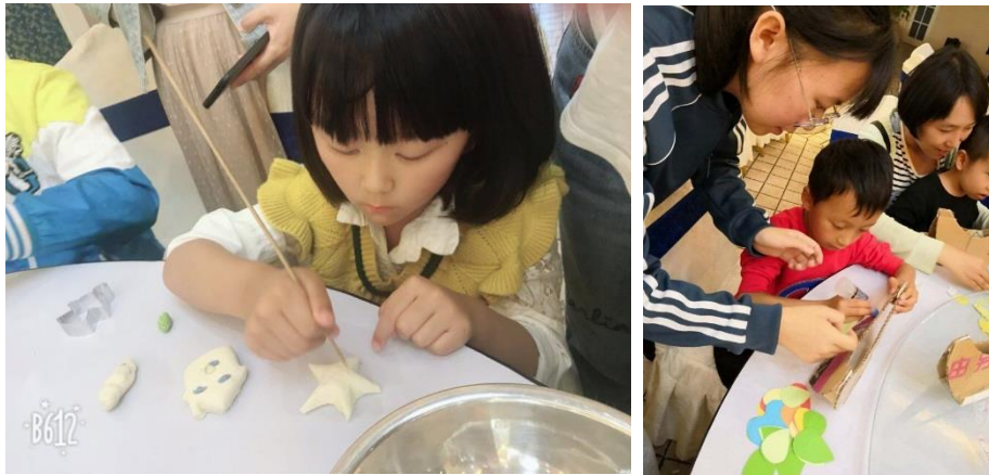
云南暖心家长互助会活动现场

此外，6月23日-24日，全国守望心智障碍者家长组织联盟“共商. 共建. 共享”主题研讨会在兰州举办。来自全国33个省、自治区的94家家长组织参与研讨会。