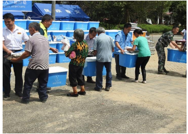
发放物资场，村民们有序接收物资

6、四川乐山夹江 626 洪灾救援行动： 持续降雨造成乐山夹江部分水稻、玉米、蔬菜等作物和林木吹倒、部份基础受损，部份房屋受损。造成 17 乡镇 118 个村 12240 人受灾，需救助 2101 人，紧急转移分散安置 1425 人，农作物受灾 367.96 公顷、受灾成灾 197.27 公顷、绝收 26.33 公顷。农户房屋倒塌 1 户 2 间、严重损坏 1 户 4 间、一般损坏 102 间 78 户，部分房屋内涝，直接经济损失 955.49 万元（农业损失 362.97 万元、基础损失 483 万元、家庭损失 109.52 万元）。灾情最严重为麻柳，歇马，华头，龙沱四个乡镇。