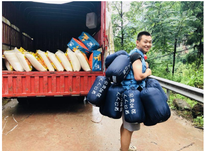
路断了，志愿者把物资背上山