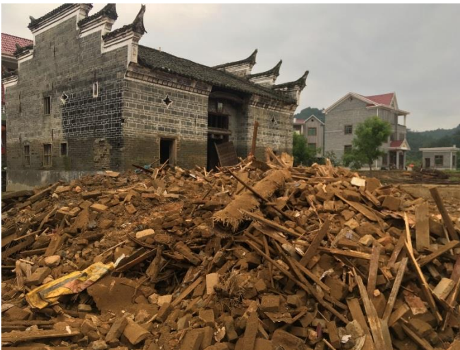
灾后高陂镇沔坑村的颓垣败瓦

参与响应伙伴机构：南昌益心益意公益服务中心、遂川志愿者协会、遂川县红十字会、万安县韶口乡守望留守儿童关爱服务中心、泰和爱心协会、万安县志愿者协会。