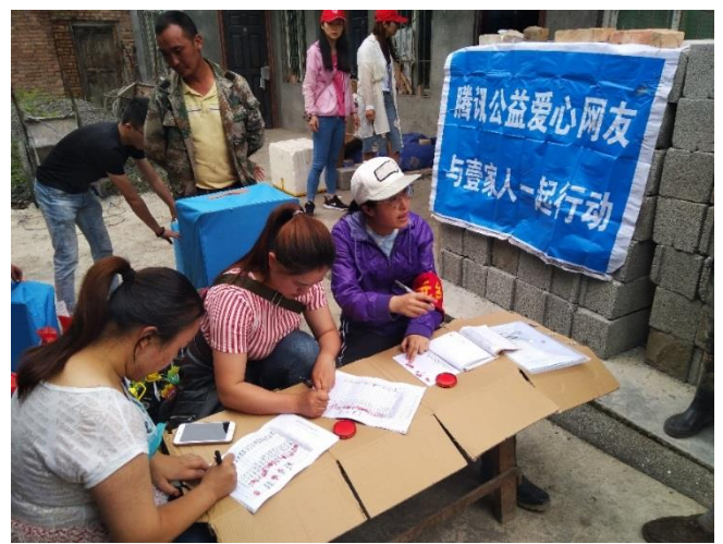
物资在九寨沟郭元乡沟里村签收发放

2、江西吉安 608 洪灾救援行动： 受第4号台风“艾云尼”外围云系影响，江西省吉安遂川县、泰和县、万安县、井冈山市等地出现大暴雨，造成部分乡镇交通中断、农田受淹、房屋受损。其