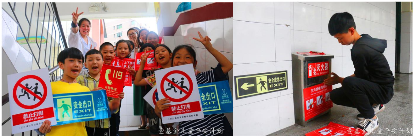
图:项目工作人员带领孩子们粘贴校园安全标示

小课堂项目学校共开展15次校园安全主题活动和演练,主要是校园安全演练和安全排查等活动,参与学生共2587人次。99项目学校开展25次安全主题活动,共2389人次参加。