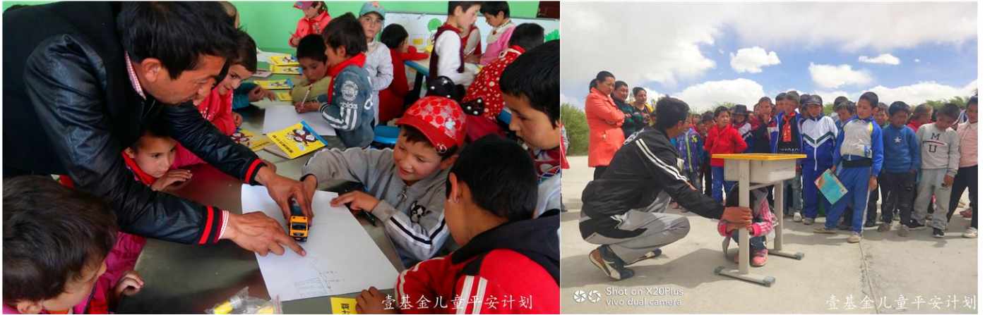
图:新疆喀什地区的儿童平安小课堂项目学校在上交通安全和地震安全的课

6月,小课堂项目学校安全教育课授课697节课,99公益项目学校开展136节安全教育课程。其中遂川本月受到台风影响,饱受暴雨侵袭,提前给受灾区的学校进行《洪水与泥石流》的课程教学,与灾害赛跑,提高学生的灾害知识和备灾自救的技能。