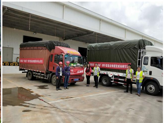
招商物流启动“灾急送”，驰援杨柳镇