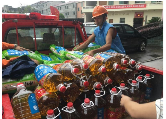
整齐装好救灾物资

3. 云南景谷 621 泥石流救援行动： 6 月 20-21 日，凤山镇突降暴雨。凤山镇集镇出现大到暴雨天气，降水量为 85 毫米。10 点 40 左右，凤山镇平寨村那肖田村民小组发生泥石流灾害，共造成该村民小组 37 户 166 人不同程度受灾。紧急转移安置人员 97 人，灾害造成经济损失约 893 余万元。经过灾情调研和需求评估，在昆明招商物流仓库紧急启动灾急送，发放物资：壹基金家庭救灾箱 37 个、壹基金温暖包 85 个、睡袋 74 个、彩条布 37 卷、大米 1850 公斤和食用油 185 升，物资总金额 77630.2 元，总受益人次 825 人次。