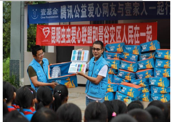
救灾伙伴给孩子们讲解壹基金温暖包内物品

4、云南宣威杨柳镇 622 泥石流救援行动： 6 月 22 日上午 9 时 20 分，宣威市杨柳镇杨柳村龙坪子地质灾害点发生山体滑坡，滑坡量约 150 万方，滑坡位移 290 余米，断面 900 余平方米，滑坡造成 1 人死亡，62 户 253 人受灾，200 余间 9800 余平方米房屋不同程度受损，直接经济损失约 2200 万元。第二天持续降雨，经地质和气象专家评估，滑坡体仍在移动，灾害风险依然存在，后又动员 60 余户 200 余人暂时转移搬迁至安全地带的安置点。经过灾情和需求评估，在昆明招商物流仓库紧急启动灾急送，共发放物资：壹基金家庭救灾箱 62 个、壹基金温暖包 35 个、折叠床 120 张、睡袋 124 个和食用油 130 升，物资总金额 69945 元，总受益人次 783 人次。