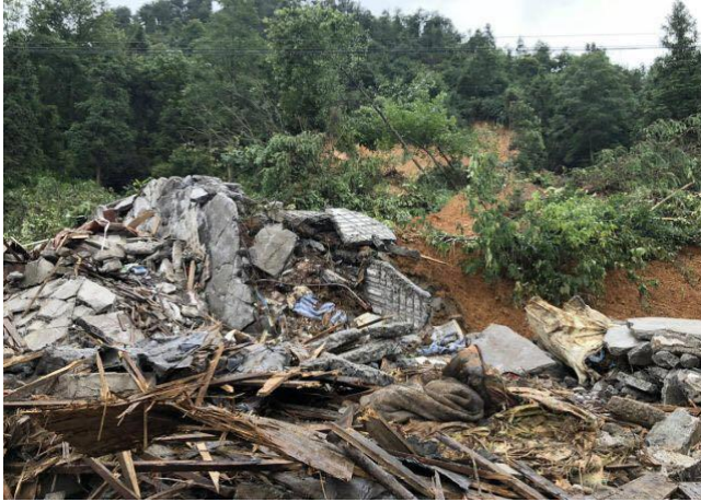
房屋受到洪水、山泥夹击

参与响应伙伴机构：贵阳市红十字会志愿者协会、贵阳市众益志愿者服务发展中心、黔东南州青鸟助学会、黔东南州青鸟助学会麻江分会。