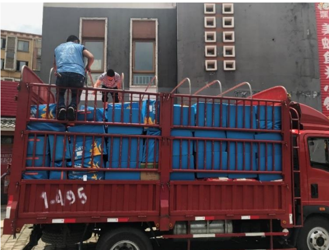
救灾物资在北川备灾仓库装车完成