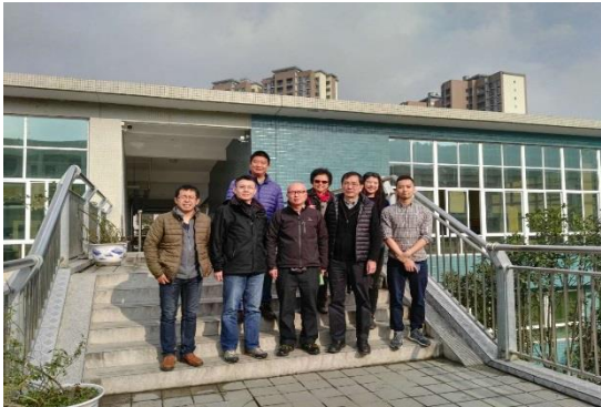
台湾设计师回访多营小学