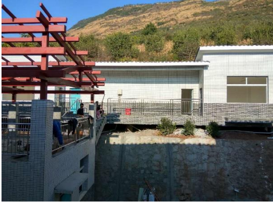
共和小学教师宿舍

1. 重建学校项目: 雅安重建的 8 所小学，其中 6 所已经竣工交付使用，审计完成后项目结项。汉源县富庄镇共和村小和汉源县片马彝族乡万坪村小学目前进入施工收尾阶段，预计 12 月验收后开始安装设施设备。