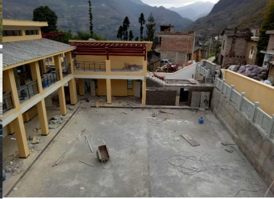
片马小学施工收尾阶段