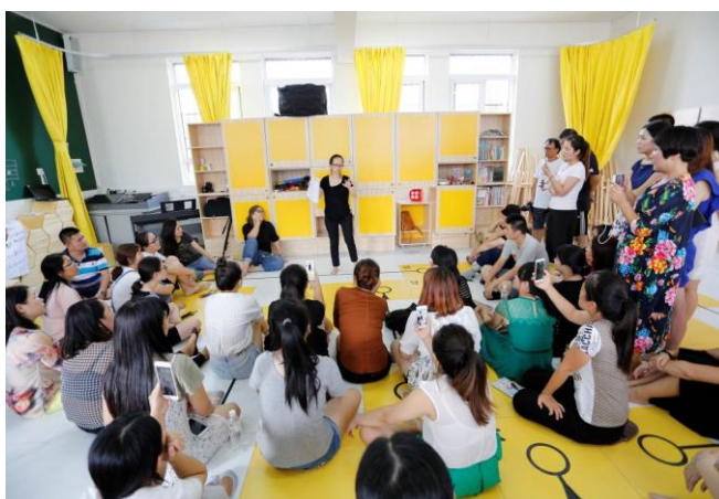
音乐教室项目设计方在教师培训中为老师讲解项目设计理念

1.项目整体进展: 11月10日,在甘肃临夏举行2016年壹乐园项目总结暨2017年壹乐园项目规划会,就2016年项目整体情况进行了总结回顾,壹乐园项目建设音乐教室共计80间(含阜宁灾后壹乐园项目9间),完成运动汇-多功能运动场建设91套(含49套鲁甸灾后壹乐园二期,鲁甸建设预计12月底完成),完成运动汇-游乐设施建设69套(含尼泊尔地震灾后西藏日喀则壹乐园4套,阜宁灾后壹乐园6套,鲁甸灾后壹乐园二期18套,其中鲁甸计划12月中完成);完成项目教师培训6次,其中音乐教室项目教师培训3次,运动汇项目教师培训3次,共计有180余名项目教师及伙伴获得培训支持。