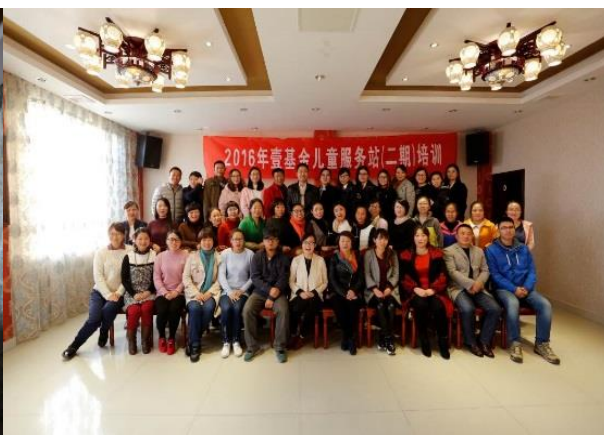
与会人员集体合影