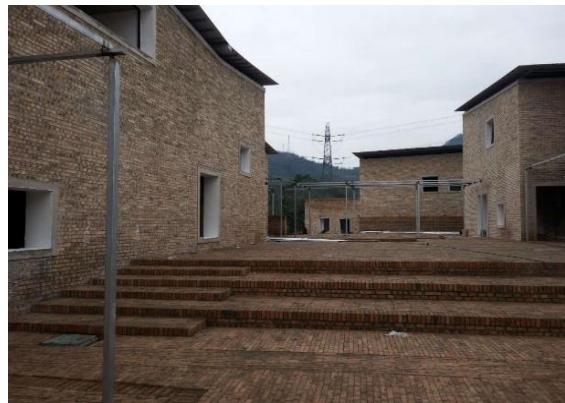
天全幼儿园主体验收场平装修中

2. 幼儿园建设项目: 14 所幼儿园建设项目，1 所处于前期设计准备阶段；3 所在设计阶段；施工中的 7 所；竣工阶段的 1 所；竣工验收交付使用的 2 所，具体而言，石棉县 3 所幼儿园，其中 2 所竣工投入使用，审计结项阶段，另 1 所施工图完成造价估算中；芦山县 1 所幼儿园完成竣工验收；汉源县 4 所幼儿园，其中 1 所幼儿园施工收尾阶段，1 所施工图审阶段；1 所设计中蒙经县 3 所幼儿园都在施工中；天全县 2 所幼儿园，其中 1 所主体验收后进入装饰装修阶段，另 1 所设计方案中；雨城区 1 所幼儿园施工中。