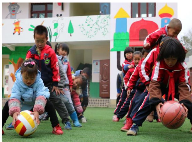
培训后正在进行体育活动的贵州织金新普小学的同学