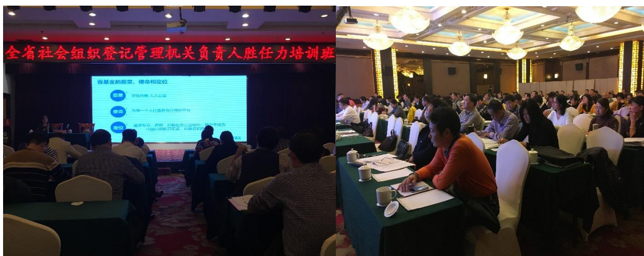
2016 民政系统胜任力示范培训项目湖南省培训班活动现场

1. 民政系统胜任力示范培训项目： 11月15-17日，湖南省社会组织登记管理机关政策法规及业务胜任力培训班在长沙举行，参会人员共计185位，2/3的人员为各地市州民政局/社会组织管理局副局长及以上人员，项目团队全程参与并监测，并就项目执行效果与相关方沟通反馈。