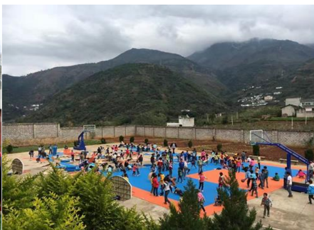
参与运动汇-多功能运动场建设的云南巧家营小学同学们