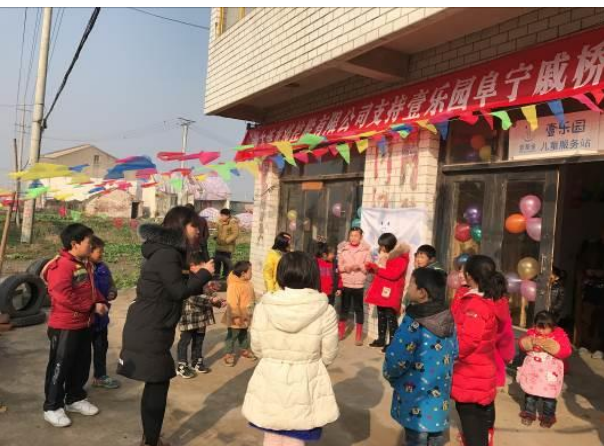
阜宁壹乐园儿童服务站戚桥村站点

3. 壹乐园运动汇： 11月，鲁甸灾后重建壹乐园二期项目完成运动场建设 15 套（共计 49 套），完成游乐设施安装 7 套（共计 18 套）。