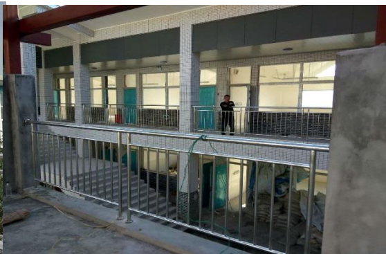
共和小学教学楼施工收尾阶段

2. 幼儿园建设项目: 14 所幼儿园建设项目，1 所处于前期设计准备阶段；3 所在设计阶段；施工中的 7 所；竣工阶段的 1 所；竣工验收交付使用的 2 所，具体而言，石棉县 3 所幼儿园，其中 2 所竣工投入使用，审计结项阶段，另 1 所施工图完成造价估算中；芦山县 1 所幼儿园完成竣工验收；汉源县 4 所幼儿园，其中 1 所幼儿园施工收尾阶段，1 所施工图审阶段；1 所设计中蒙经县 3 所幼儿园都在施工中；天全县 2 所幼儿园，其中 1 所主体验收后进入装饰装修阶段，另 1 所设计方案中；雨城区 1 所幼儿园施工中。