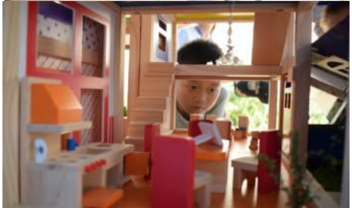
北川夏令营活该剪影