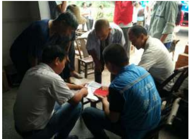
壹基金志愿者在麻城市调研受灾情况

据统计，在为期一个月的救援行动中，壹基金联合救灾共计在湖北省武汉市、黄冈市、孝感市、大冶市、荆门市、宜昌市、咸宁市、恩施州8个市州的新洲区、蕲春县、汉川市、宜都市、建始县、五峰县等共22个县（区、县级市）进行了救灾物资的发放工作。