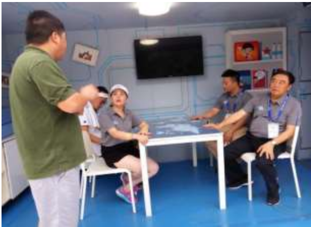
壹基金理事长马蔚华体验安全教育车