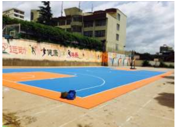
云南武定县多功能运动场安装及安装照片