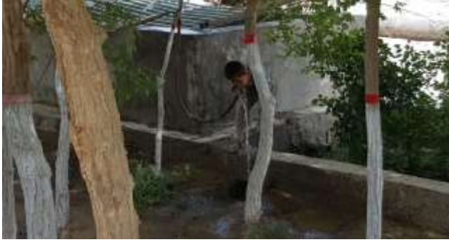
新疆项目点学生饮水现状