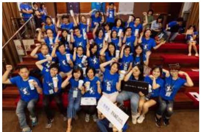
我能第一季线下培训活动

社群与传播 ：微信公众号和线上社群保持一定的频率更新推文和组织线上分享活动，并于7月开始进行线上课程的测试版本。