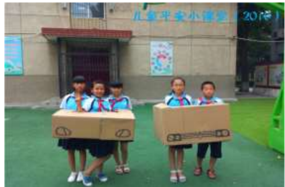
学生自己动手做交通活动道具