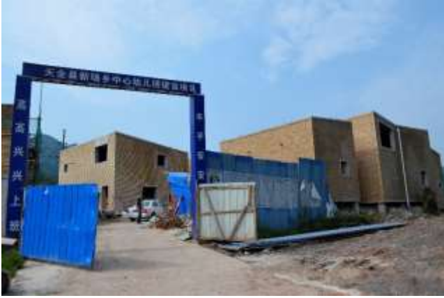
天全县新场中心幼儿园校门