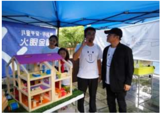
壹基金创始人李连杰先生参与活动现场