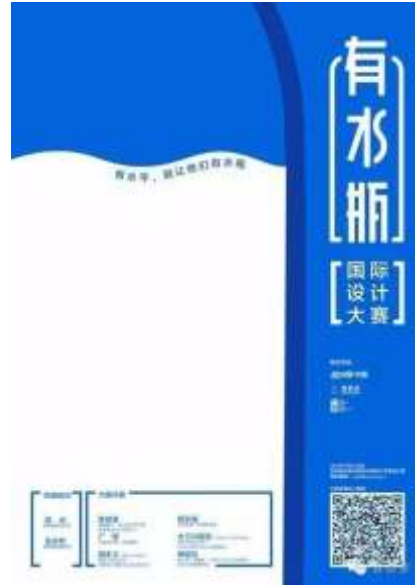
“有水瓶”设计大赛海报