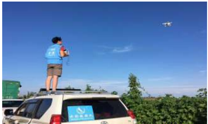
云豹救援队运用无人机进行勘察