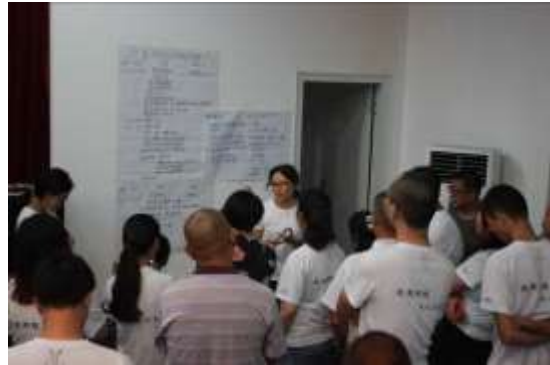
阜宁儿童服务站第一次项目培训