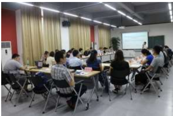
专家会现场方案汇报