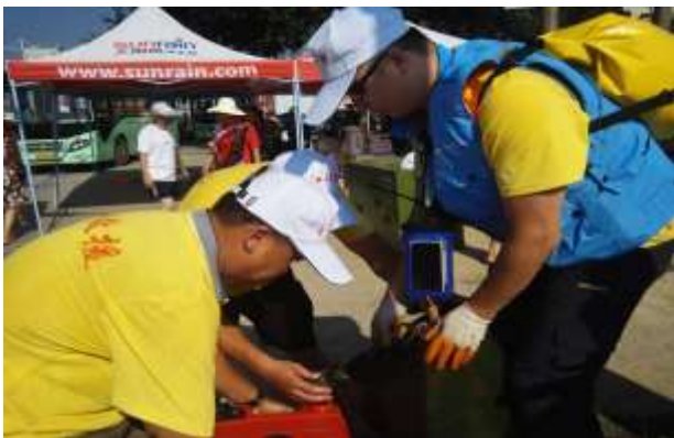
长江志愿救援队准备出发

壹基金共计发放了379,800瓶冰露水、99,400平米彩条布、2,000床棉被、6,980床夏凉被、90,600个编织袋、5,000个卫生应急箱、8,500个个人卫生包、168,000公斤大米、84,000升食用油和1,000公斤铁丝。其中，彩布条、铁丝、编织袋等物资已全部用于加固河堤、维护堤坝安全，饮用水、棉被、卫生应急箱等物资也已全部发放到了受灾地区的村民手中。