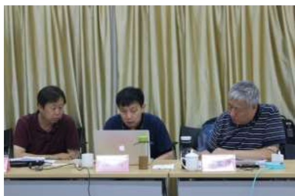
会场专家认真分析汇报方案