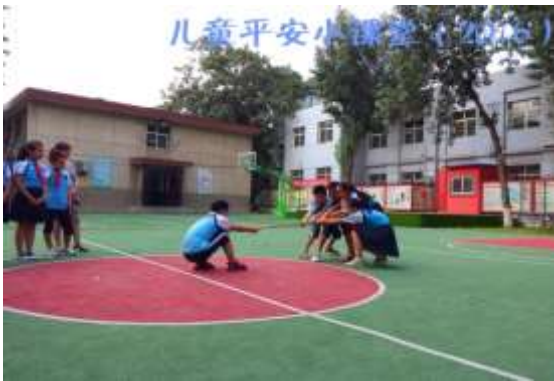
学生借助周边物品救助落水同学（演练）