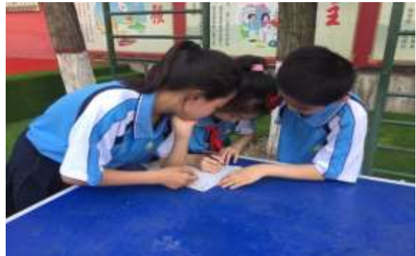
学生记录校园火灾风险点