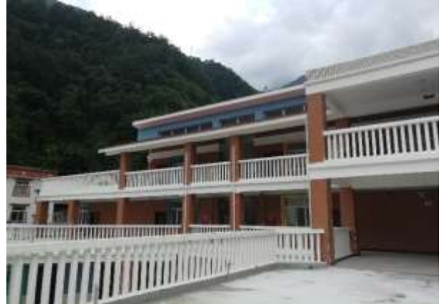
石棉县草科乡中心幼儿园活动中心外观