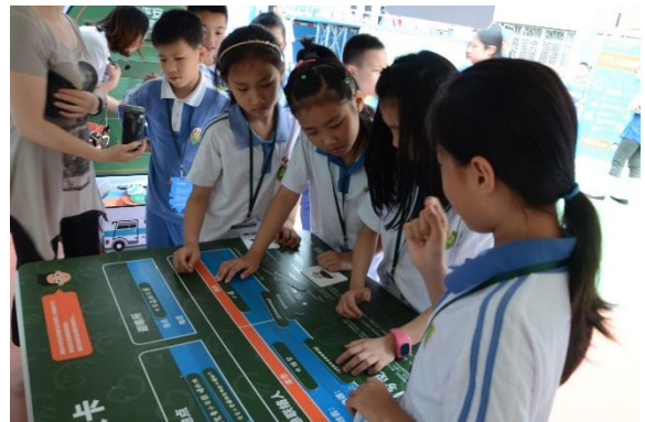
新洲小学四年级同学在“合家安心”活动区，共同讨论设计家庭紧急联系卡