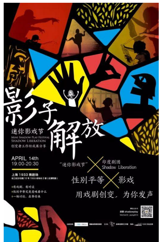
图为“创变者”（我能实验室第一季资助团队）于上海的活动“迷你影戏节”