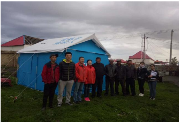
新疆伊犁龙卷风袭击之后