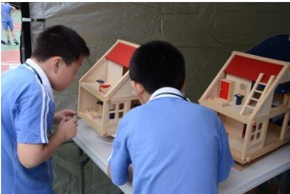
新洲小学四年级同学在“超强大脑”活动区研究地震发生时建筑物内的变化。

“雨停了是不是可以开始？你们今天一走，很难再有机会体验这样的活动了。” —深圳市明德学校碧海校区 3 年级学生家长