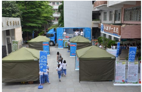
上沙小学的活动场地