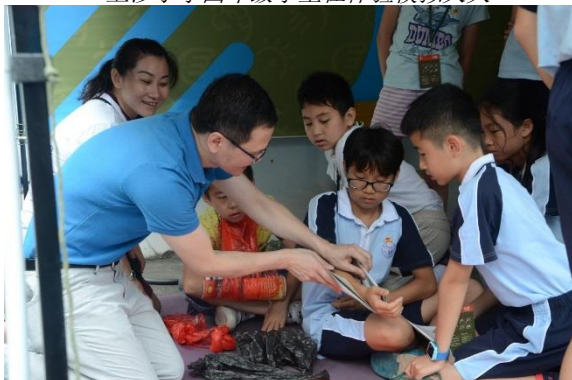
明德小学的家长义工正在给五年级学生讲解骨折固定的技术