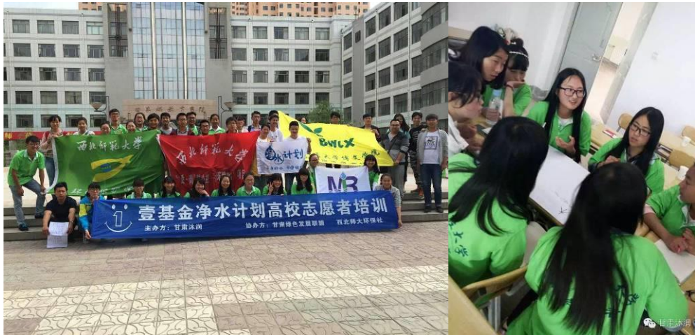
在伙伴的动员下，甘肃本地高校社团积极参与儿童水卫生课堂的设计