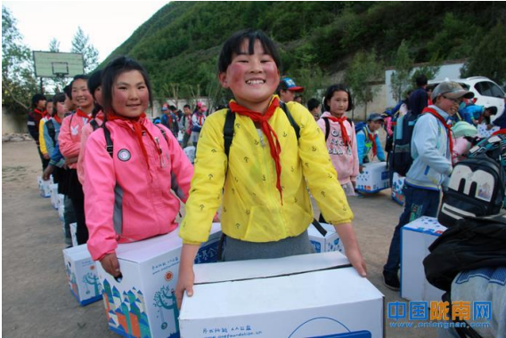
5月10日壹基金联合救灾网络甘肃伙伴为宕昌县4所小学160个孩子发放了温暖包

江西： 15日，壹基金联合救灾网络江西伙伴将 41 个温暖包送达本轮降雨受灾的江西省抚州市黎川县实验小学孩子们手中，并为供水受到影响的黎川县德胜村的 600 余名村民发放了 9600 瓶冰露水。