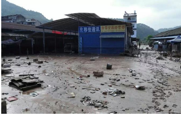
广西阳朔县城内涝