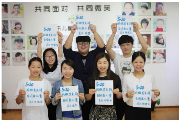
温州星儿-家长加油站

壹基金支持罕见病发展中心于2016年5月21日和22日在北京召开了网络年会，共有40个罕见病伙伴机构出席了会议，就各自的组织工作、经验等进行分享、交流。