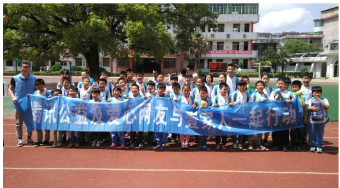
江西省抚州市黎川县实验小学的41名学生收到温暖包