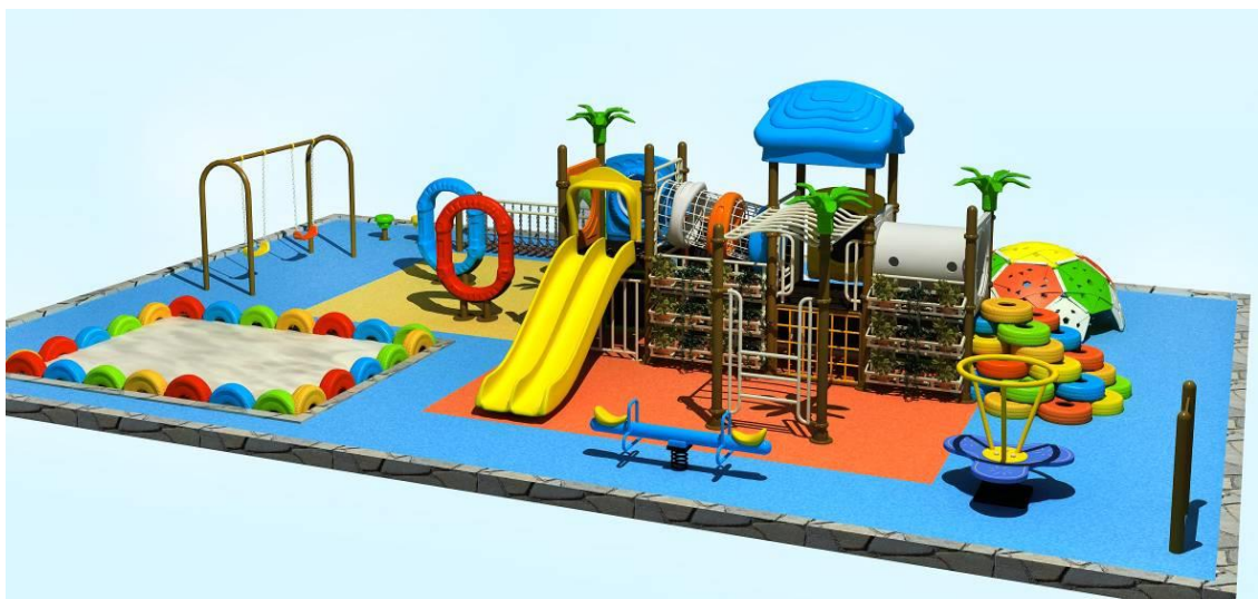
运动汇-多功能运动场: