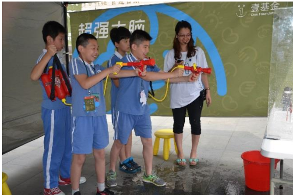
上沙小学四年级学生在体验模拟灭火