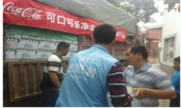
壹基金联合救灾网络广西伙伴在金宝乡发放冰露水