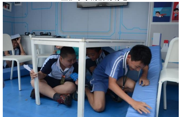
“主震”结束后急忙进行逃生的同学