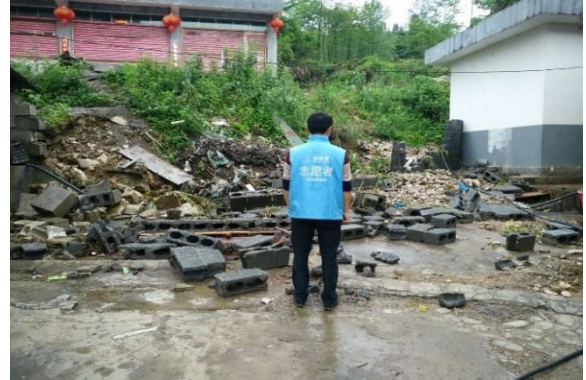
重庆酉阳县，伙伴进行灾情评估