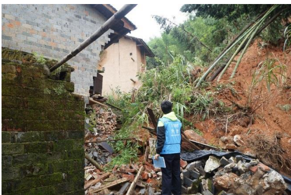
江西抚州 灾情评估