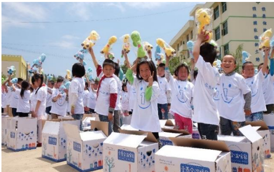
受灾严重的重庆酉阳县木叶小学孩子们收到温暖包