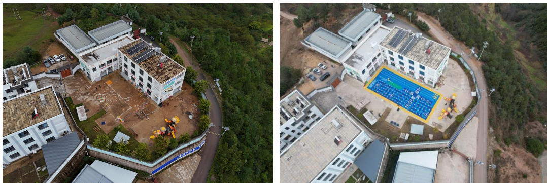
图：洱源县西山乡公立中心示范幼儿园-铺设前后航拍图