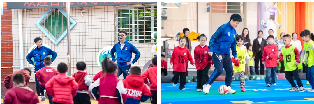
图：12月16日中国明星足球队操场回访精彩掠影