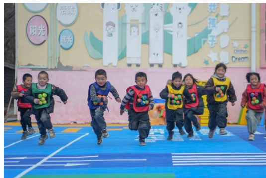
左：商河县白桥镇中心幼儿园白桥分园-儿童玩耍图 右：东乡族自治县坪庄幼儿园-儿童玩耍图