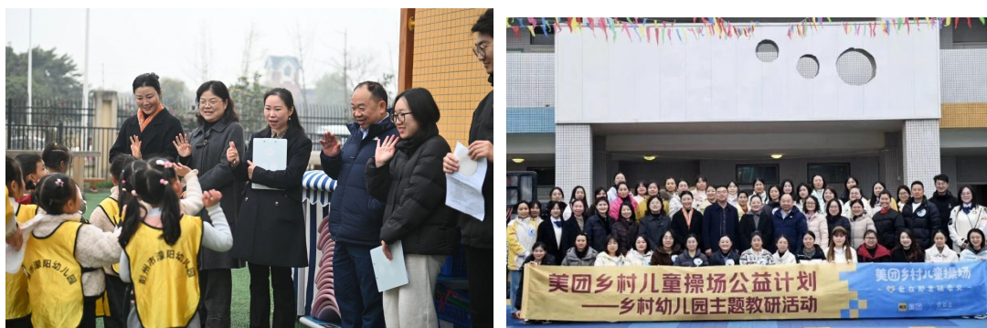
图：乡村幼儿园主题教研活动精彩掠影