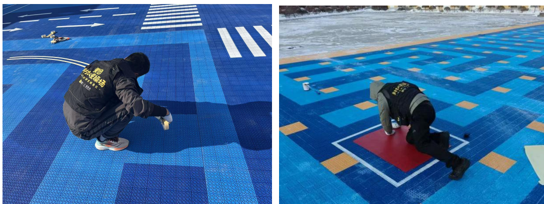
左：深泽县赵八镇中心幼儿园-场地铺设照片 右：明水县滨泉幼儿园-场地铺设照片