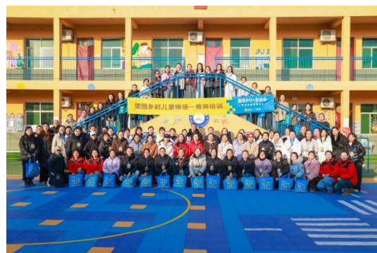
图：12月山西场教师培训精彩掠影