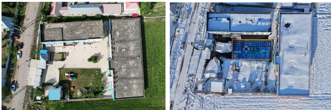
图：伊宁县喀拉亚尔奇乡中心幼儿园奥依曼布拉克村分园-铺设前后航拍图