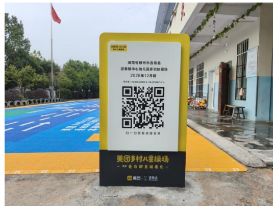
左：临夏回族自治州东乡族自治县坪庄幼儿园-铭牌场景照片 右：宜章县迎春镇中心幼儿园-铭牌场景照片