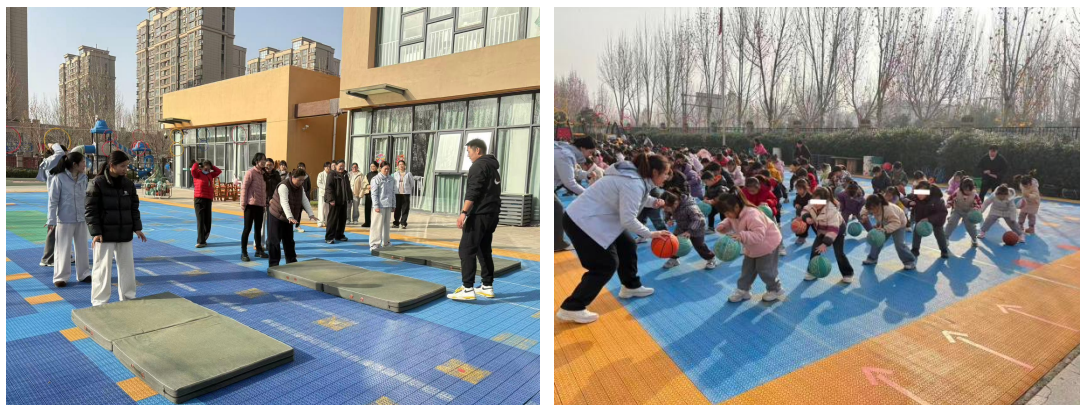
图：萌娃村运会-12月体育特色示范园线下指导精彩掠影