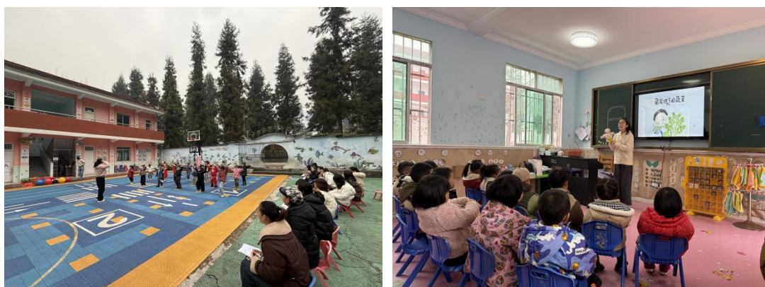
图：乡村儿童营养健康示范项目-专家线下指导交流精彩掠影