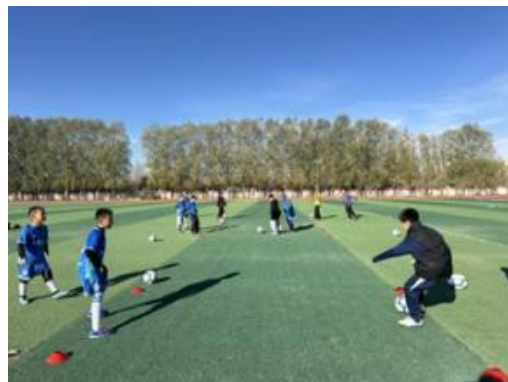
足球场上训练的孩子们