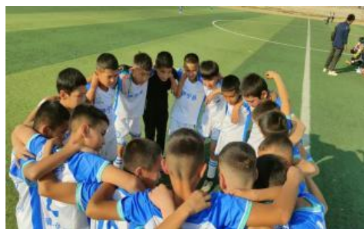
县级足球比赛现场