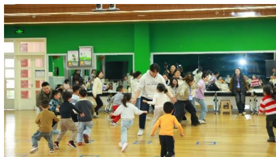
右：学员参与实践教学（二班）