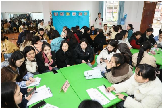
左：学员针对项目材料展开讨论（一班）