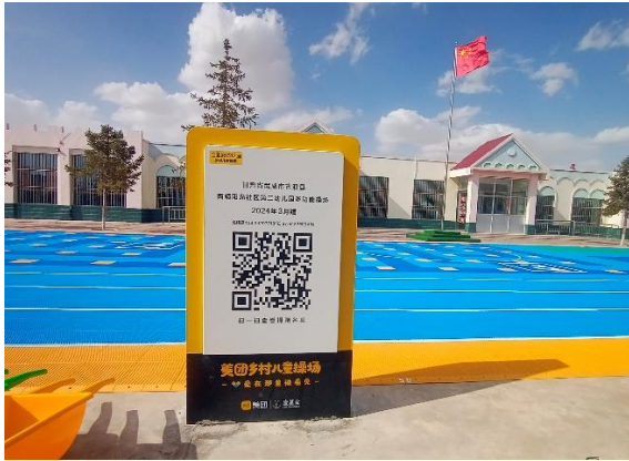
左：古浪县西靖阳光社区第二幼儿园-铭牌场景照片