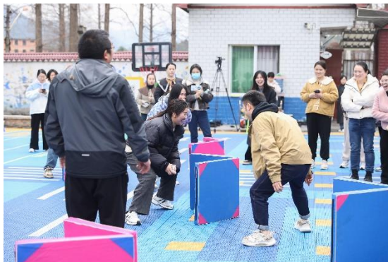
右：学员利用项目材料开展活动（一班）