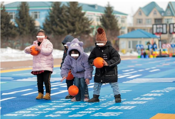
右：巴彦县天增镇中心幼儿园-铺设后幼儿场地活动图