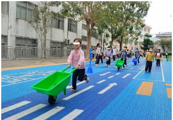
左：饶平县上饶镇埔坪小学附属幼儿园-铺设后幼儿场地活动图