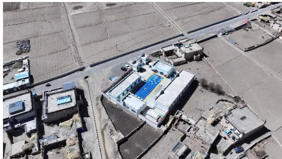
图：浪卡子县多却乡揉扎村幼儿园-铺设前后航拍图