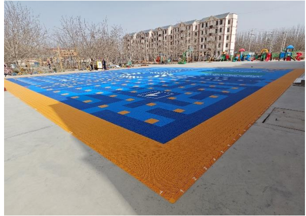
右：和田市吉亚乡中心幼儿园-铺设全景照片