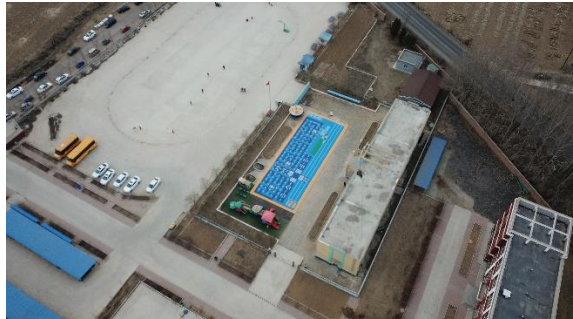
图：北票市小塔子乡中心幼儿园-铺设前后航拍图