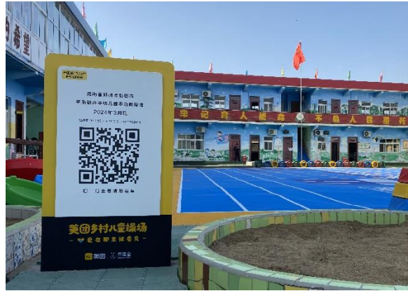
右：新密市平陌镇兴平幼儿园-铭牌场景照片