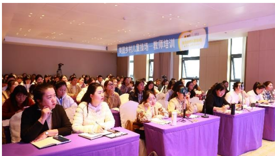
左：学员参与集中授课（二班）