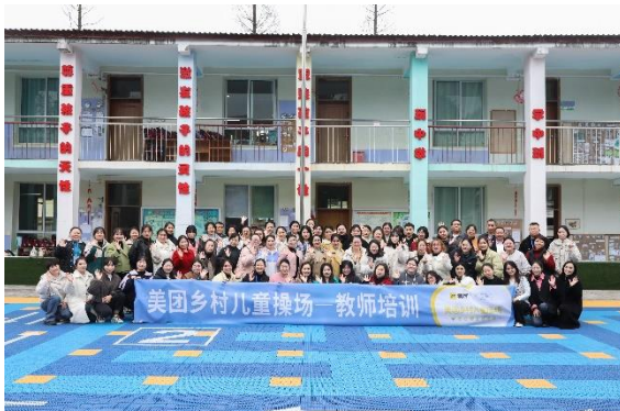
左：学员户外课程合影（一班）