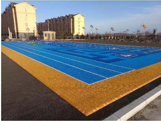
左：城子河区晨兴幼儿园-铺设全景照片