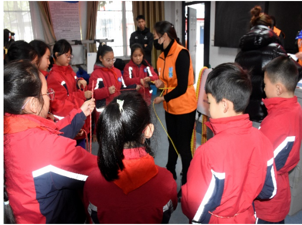
1月9日儿童平安生存训练营走进平顶山市湛河区沁园小学