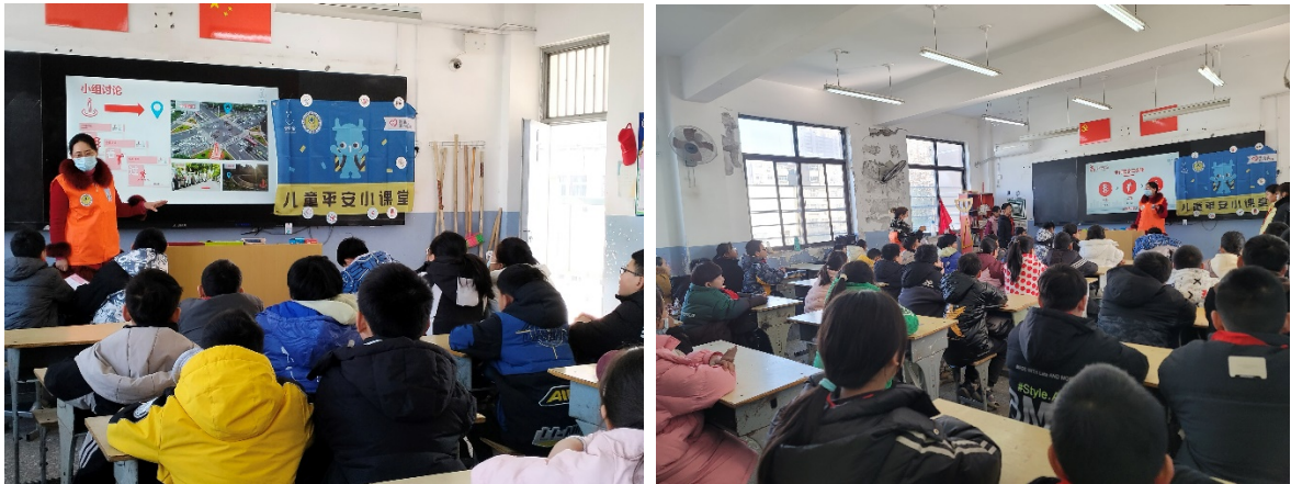
1月3日儿童平安小课堂走进平顶山市新华区胜利街小学