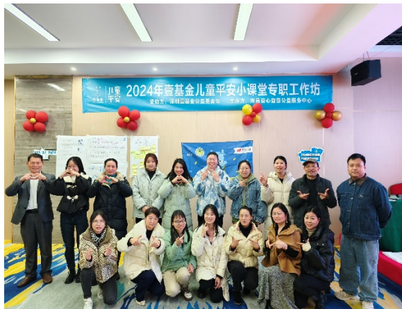
小课堂专职工作坊培训-江西场