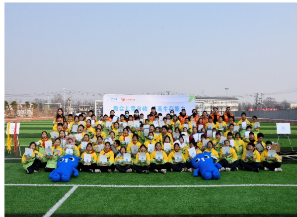
1月10日儿童平安生存训练营走进平顶山市湛河区实验小学稻香路分校