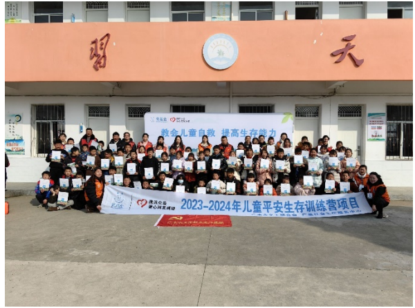
1月11日儿童平安生存训练营走进广水市陈巷镇刘店中心小学