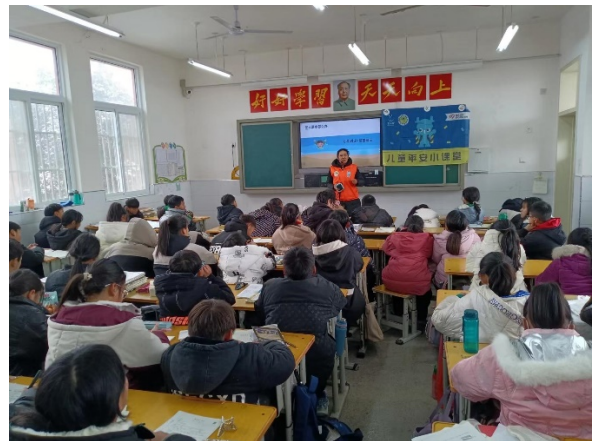
1月19日儿童平安小课堂走进宝丰县周庄镇实验小学