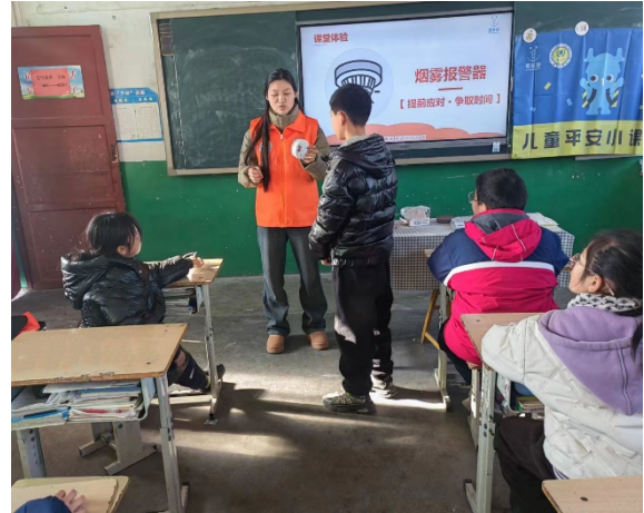
儿童平安小课堂走进新绛县横桥中心小学

② 为帮助项目执行机构理清项目脉络，增强项目的落地性和可操性，2024年1月18-19日，壹基金儿童平安小课堂专职工作坊在江西省南昌市顺利举行，共计有13家机构20位伙伴前来参加此次能建培训。