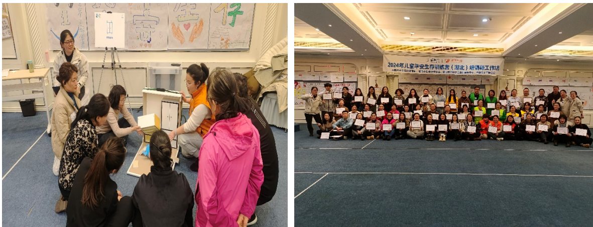
儿童平安生存训练营培训师培训会-湖北场

① 2024年1月15日-18日，2024年壹基金儿童平安生存训练营（湖北）培训师培训会在襄阳铁路大酒店正式启动，此次工作坊由孝感市义工联合会主办，襄阳市美好社会组织服务中心协办，襄阳市社会组织管理局和襄阳市社会组织总会支持，襄阳市广场舞协会提供物料，来自孝感、黄冈、武汉、黄石、宜昌、恩施、荆州、襄阳、荆门、十堰等地区的30家社会组织56人参加了本次工作坊，共同了解学习项目执行。