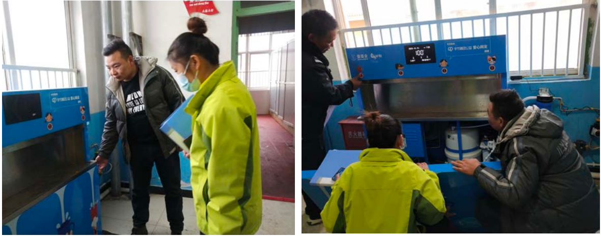
甘肃省宕昌县项目校净水设备使用情况

走访 1 所学校；山东省滕州市执行伙伴实地调研了 3 所学校，并对已安装的 5 所学校的设备进行了常规安全检查；重庆市潼南区执行伙伴回访了 2 所学校，查看设备的使用情况。