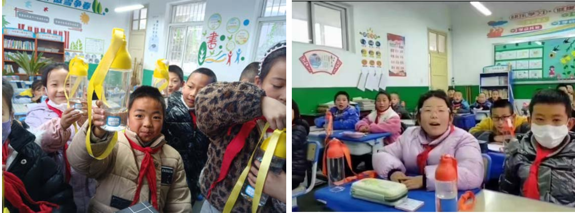
甘肃省庆阳市执行伙伴为项目校儿童发放水杯