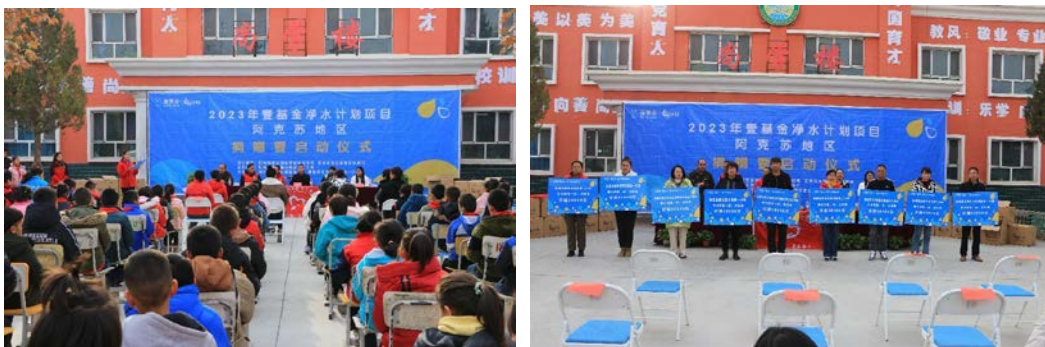
新疆维吾尔自治区阿克苏地区净水计划项目捐赠活动启动仪式

2023年12月1日，在温宿县吐木秀克镇第一小学举行壹基金净水计划阿克苏地区的启动仪式，温宿县教科局，温宿县民政局，阿珂地区指尖微爱公益协会以及各项目学校的代表出席启动仪式，启动仪式上还该校的学生发放水杯。启动仪式结束后，温宿县教科局和民政局的领导以及参加启动仪式的嘉宾参观了净水设备，当地执行伙伴详细为各位领导和嘉宾介绍了净水设备的各项功能和后期维护情况。