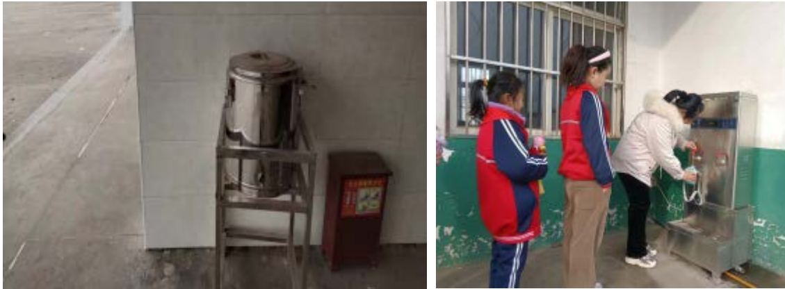
山东省滕州市执行伙伴走访学校