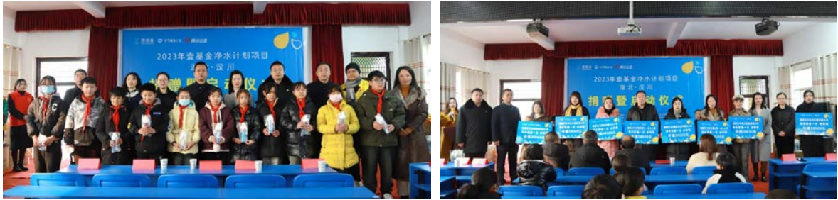
湖北省汉川市净水计划项目捐赠暨启动仪式

2023年12月28日，壹基金净水计划项目捐赠暨启动仪式在刘家隔镇金鼓城小学隆重举行。汉川市人民检察院、汉川市民政局、共青团汉川市委、汉川市妇联、汉川市疾控中心、汉川市未保中心等相关部门领导，以及汉川市向日葵社工中心志愿者，以及来自14所项目学校的代表参加了启动仪式。