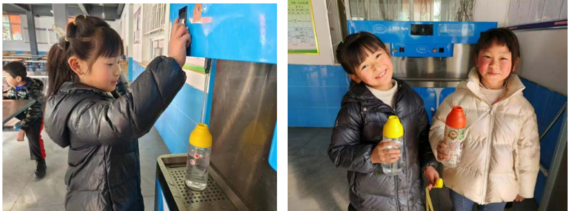
甘肃省成县执行伙伴回访项目校，设备正常使用