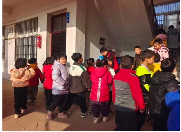
安徽省桐城市执行伙伴开展水质取样工作