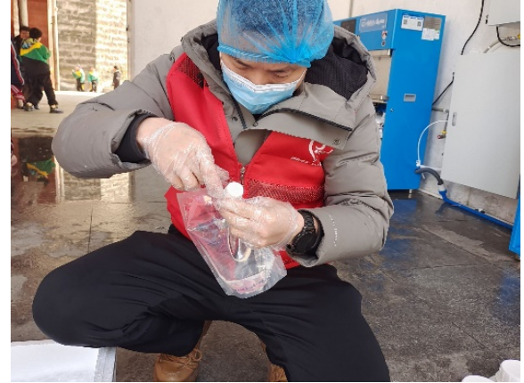
四川省内江市执行伙伴开展水质取样工作