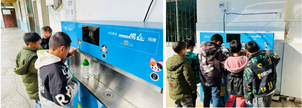
贵州省开阳县执行伙伴走访学校