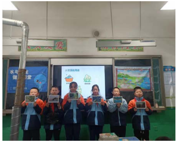
甘肃省宕昌县项目校水与卫生健康课堂