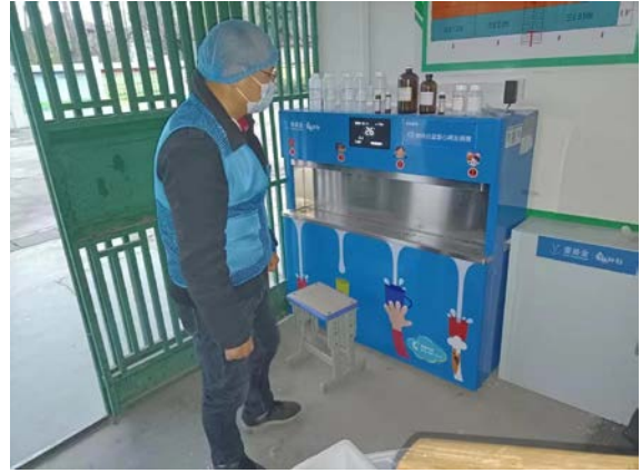
湖北省汉川市执行伙伴开展水质取样工作