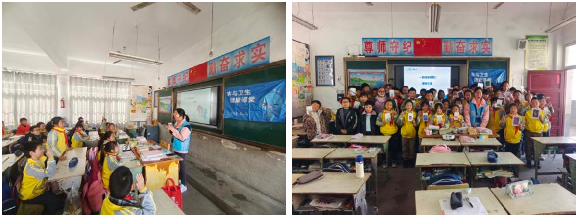
安徽省桐城市项目校水与卫生健康课堂

2023年12月，执行伙伴陆续入校开展水与卫生健康课堂。安徽省桐城市执行伙伴开展了1节水与卫生健康课堂；甘肃省庆阳市县执行伙伴为1所学校开展了水与卫生健康课堂；甘肃省宕昌县执行伙伴为10所学校开展了水与卫生健康课堂；广西壮族自治区三江侗族自治县执行伙伴到3所学校开展了6节水与卫生健康课堂；河南省兰考县执行伙伴一共为项目校开展了8节水与卫生健康课堂；河南省洛阳市执行伙伴一共为2所学校开展了12节水与卫生健康课堂；吉林省大安市执行伙伴在10所学校开展水与卫生健康课堂；山东省烟台市执行伙伴为3所学校开展了18节水与卫生健康课堂；山东省五莲县执行伙伴前往4所学校开展水与卫生健康课堂；陕西省榆林市执行伙伴为3所学校开展了6节水与卫生健康课堂；新疆地区执行伙伴开展了5节水与卫生健康课堂；重庆市执行伙伴开展了15节水与卫生健康课堂。