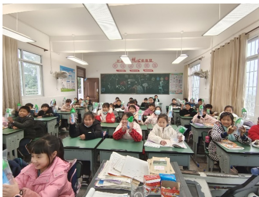
左：四川省内江市执行伙伴发放水杯

2023年12月，净水计划执行伙伴陆续为项目校儿童送去了水杯。四川省南充市执行伙伴为14所学校发放4525个水杯；四川省内江市执行伙伴为项目学校发放4506个水杯；甘肃省庆阳市执行伙伴发放了5所学校的水杯；贵州省开阳县执行伙伴为6所学校发放水杯；黑龙江省肇源县和杜蒙县执行伙伴为11所学校发放了水杯；江西省德兴市执行伙伴前往5所学校发放了1600个水杯；山东省烟台市和临朐县执行伙伴为4所学校发放了水杯；陕西省富县为7所学校发放了水杯；新疆地区执行伙伴为10所学校发放了水杯；云南省蒙自市执行伙伴为10所学校发放了4739个水杯。