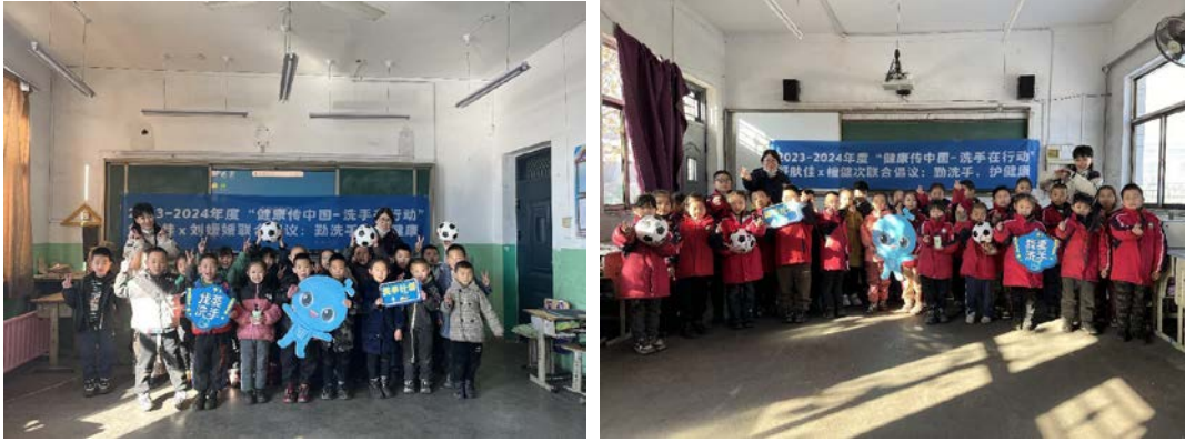
山西省洪洞县执行伙伴开展的洗手主题的卫生健康活动