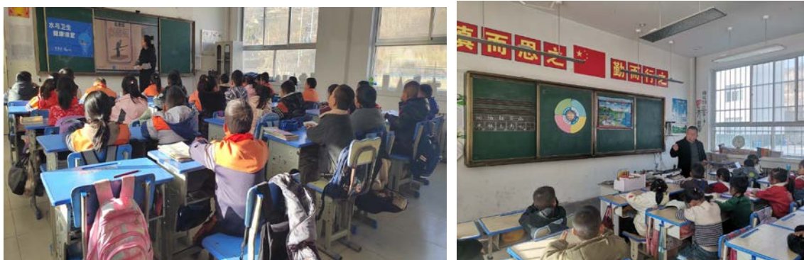
甘肃省庆阳市项目校水与卫生健康课堂