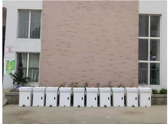
四川省江油市执行伙伴回访洗手设备的使用情况