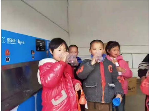
甘肃省庆阳市执行伙伴安装净水设备