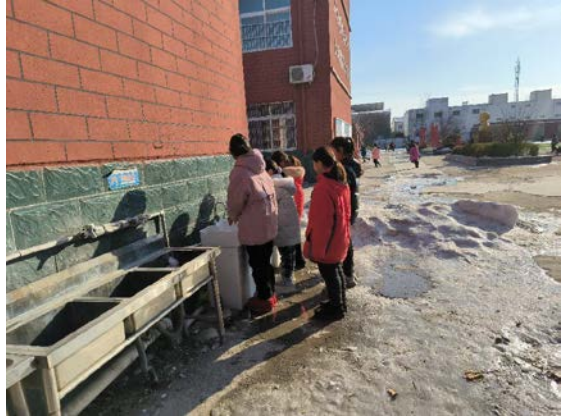
河南省兰考县执行伙伴回访设备使用情况