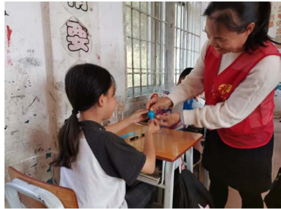
广西壮族自治区三江县的水与卫生健康课堂