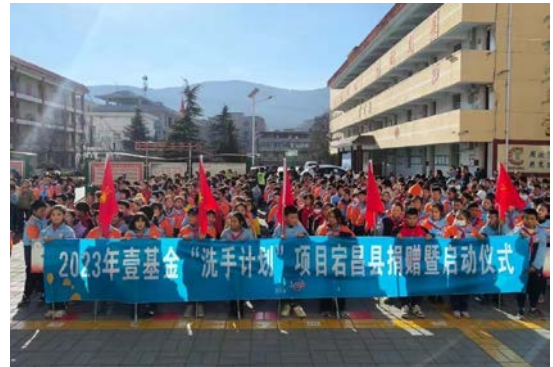
甘肃省宕昌县洗手计划项目启动仪式