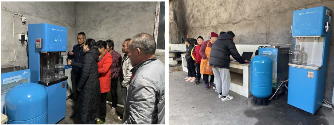
江西省永丰县七都乡黄家村委会安装设备