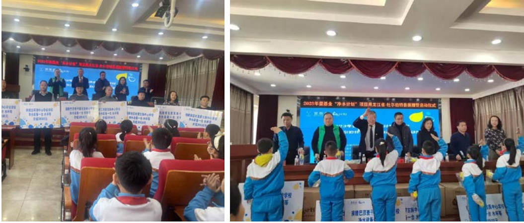
黑龙江省杜蒙县净水计划项目捐赠仪式

2023年12月28日，壹基金净水计划项目捐赠暨启动仪式在刘家隔镇金鼓城小学隆重举行。汉川市人民检察院、汉川市民政局、共青团汉川市委、汉川市妇联、汉川市疾控中心、汉川市未保中心等相关部门领导，以及汉川市向日葵社工中心志愿者，以及来自14所项目学校的代表参加了启动仪式。