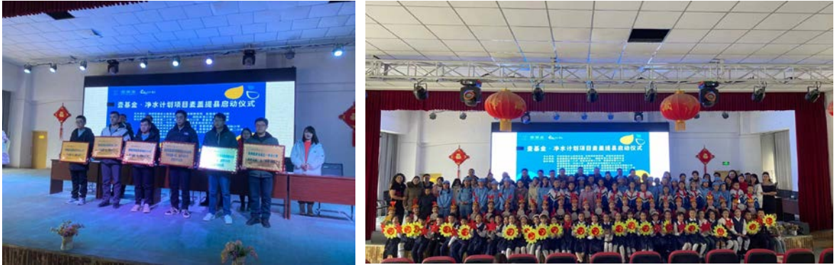
新疆维吾尔自治区麦盖提县净水计划项目捐赠暨启动仪式

2023年12月25日，壹基金净水计划兰考县项目捐赠暨启动仪式在惠安街道范楼小学顺利开展，县民政局、县教体局、惠安街道办领导及10所项目学校代表参与捐赠仪式。仪式上，县教体局副局长、惠安街道办副主任分别致辞，并向10所项目捐赠学校授捐赠牌，向学生代表发放捐赠水杯。捐赠仪式结束后，兰考正心社工还向范楼学校学生们讲授了水与卫生健康课堂，让学生进一步了解饮水安全知识，提高孩子们的饮水安全认知。