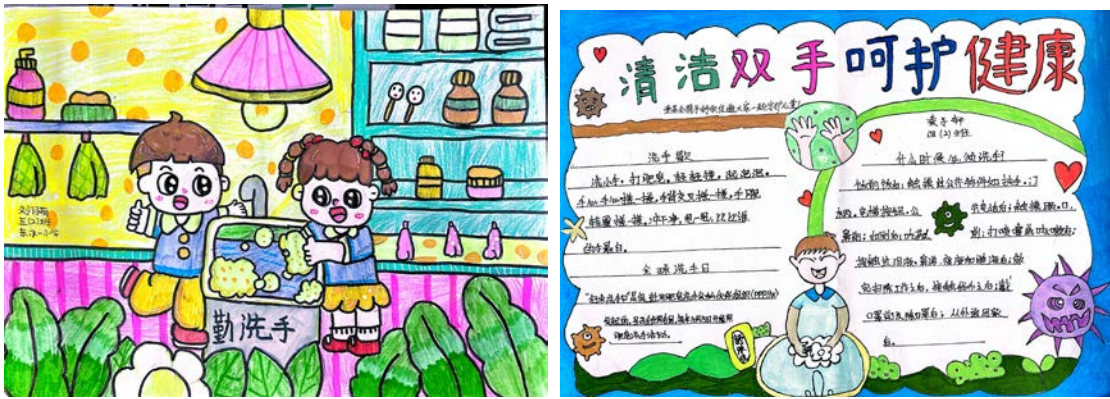
山西省洪洞县项目校儿童的手抄报作品