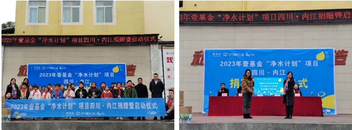
四川省内江市净水计划项目捐赠暨启动仪式

2023年12月22日，河南省洛阳市净水计划项目捐赠暨启动仪式在洛阳市丰李军屯小学顺利开展，全校师生参加仪式。仪式后，孩子们有序的排队接水喝，他们开心的告诉志愿者们：“我们也有热水喝啦！”，后续的卫生健康课程也会提高乡村儿童的卫生健康意识。