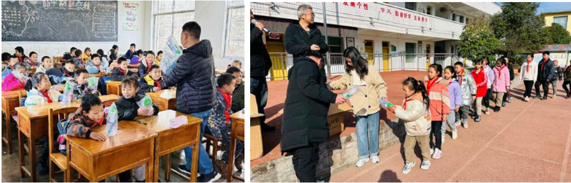
贵州省开阳县执行伙伴为项目校儿童发放水杯