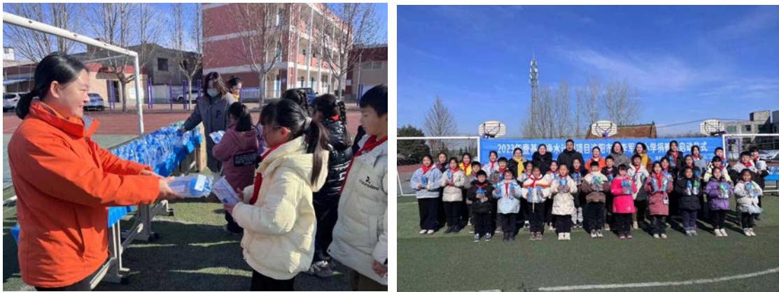
河南省洛阳市净水计划项目捐赠暨启动仪式

2023年12月22日，河南省洛阳市净水计划项目捐赠暨启动仪式在洛阳市丰李军屯小学顺利开展，全校师生参加仪式。仪式后，孩子们有序的排队接水喝，他们开心的告诉志愿者们：“我们也有热水喝啦！”，后续的卫生健康课程也会提高乡村儿童的卫生健康意识。