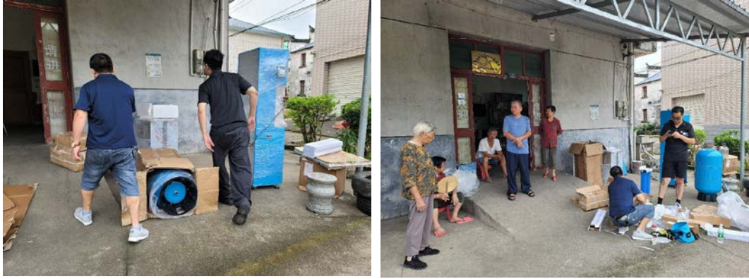
江西省德兴市皈大乡皈大村村委会安装设备