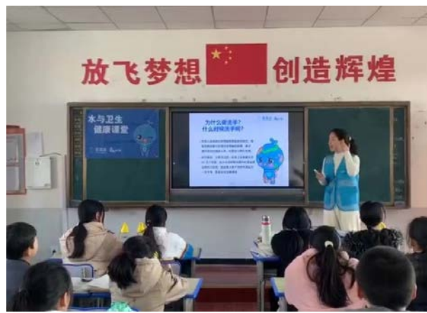
河南省洛阳市执行伙伴的洗手课程