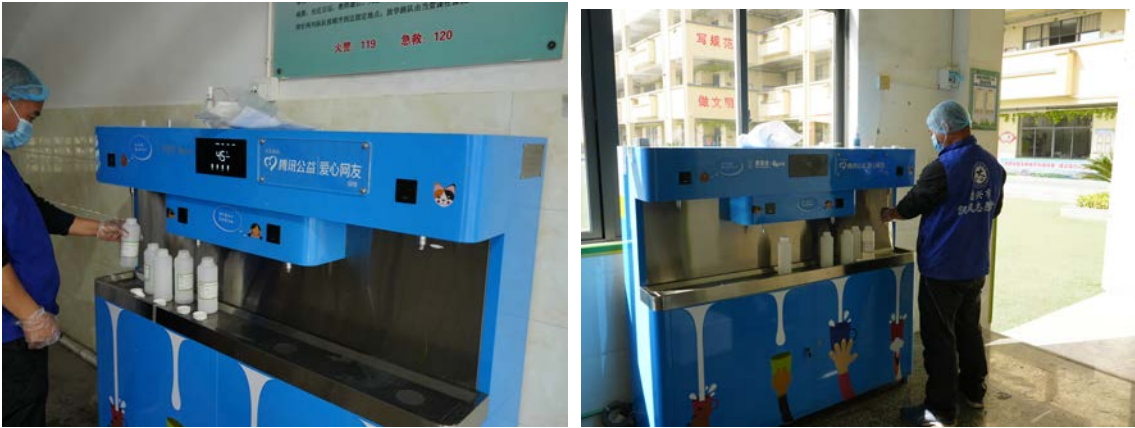
江西省德兴市执行伙伴安装净水设备