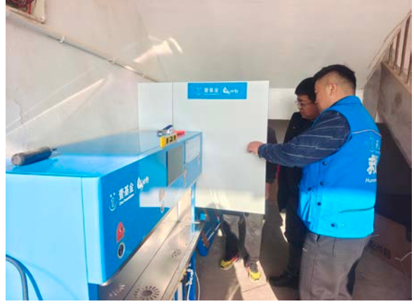
安徽省桐城市执行伙伴安装净水设备