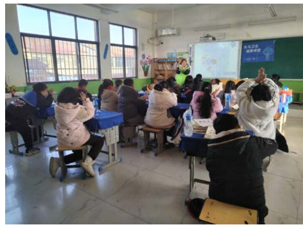
河南省兰考县的洗手活动