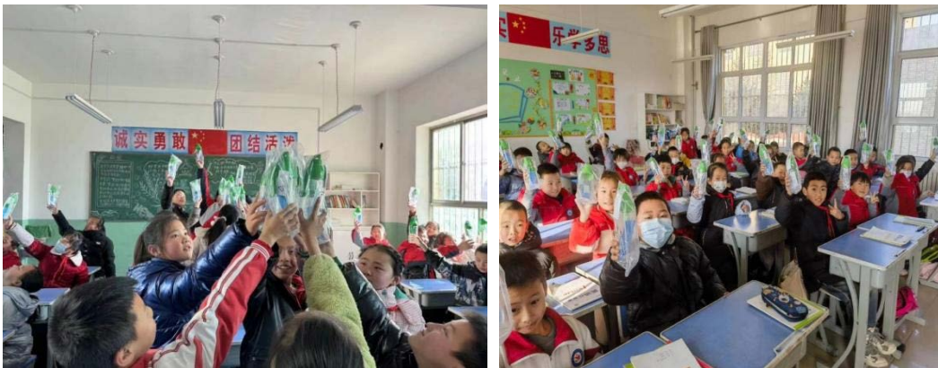
陕西省富县执行伙伴为项目校儿童发放水杯