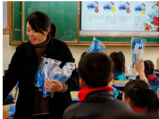
右：江西省德兴市执行伙伴发放水杯