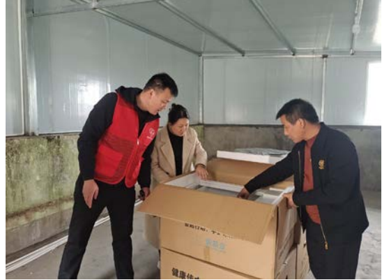
四川省内江市执行伙伴分装转运洗手设备